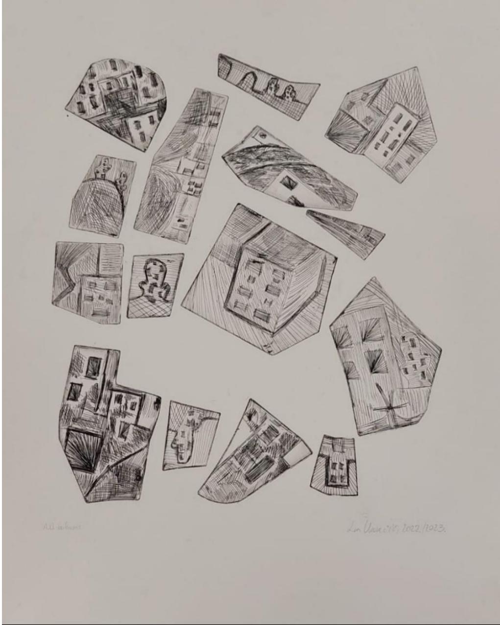
„Bez naziva“, 2023., bakropis, 50 x 70 cm