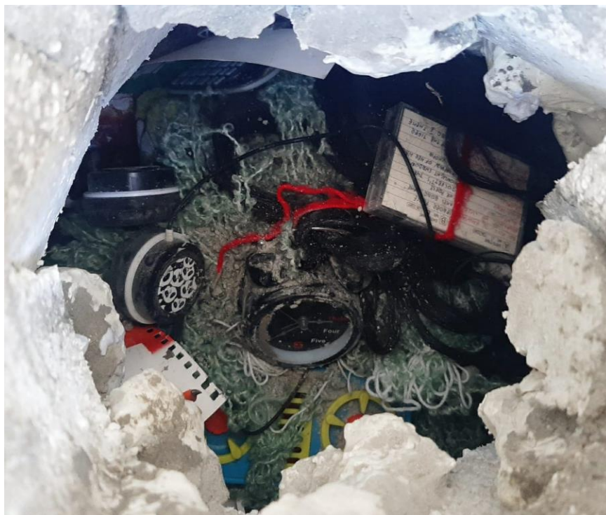
„Erupcija“, 2023., medijapan ploča, stiropor, ljepilo za pločice, crna boja za beton, 160 x 75 cm