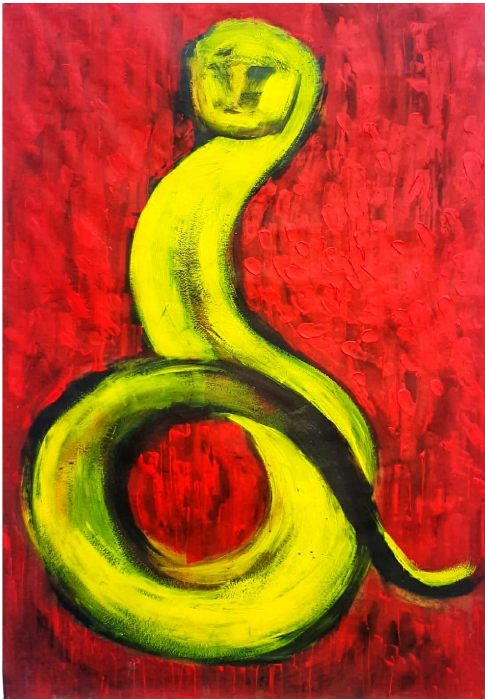
„Zmija“, 2022., akril na papiru, 121,8 x 80, 55 cm