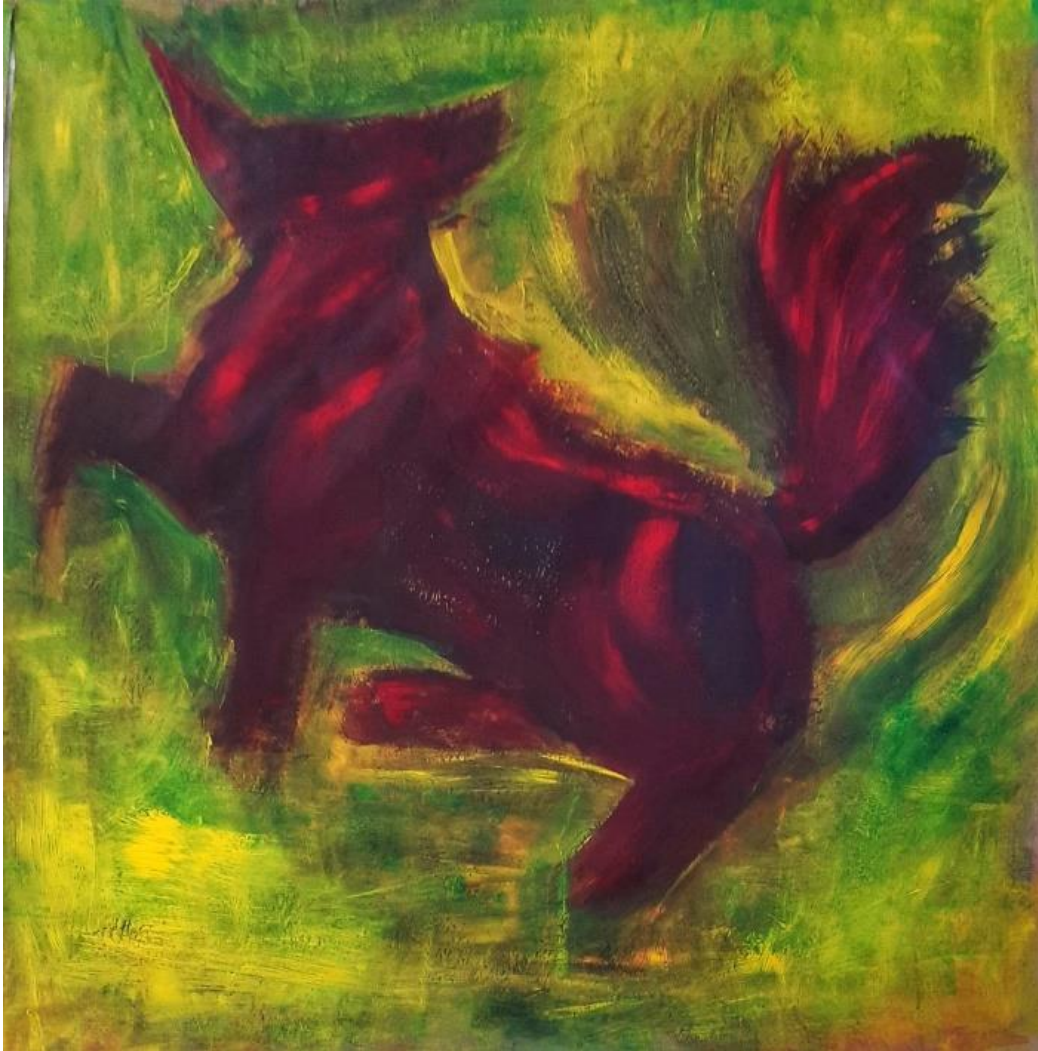
„Pas“, 2023., akril na papiru, 150,7 x 112,2 cm