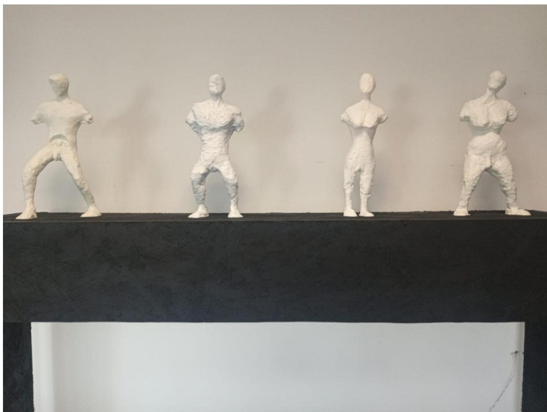
“Ljudi”, 2024. , PLA