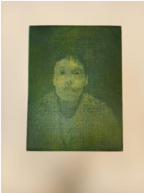
“Bez naslova”, fototransfer, akvatinta, 2023.

prenijeti na rad. Mislio sam da će ta dva izvora svjetla biti puno izraženija, ali nisu bila. Kad sam to shvatio ostao sam malo razočaran, ali me neočekivanost grafike navela da nastavim. Otisnuo sam 9 finalnih otisaka izvedenih u tehnici fototransfera. Kada bih mogao, još bih ih tiskao jer imam osjećaj da ne mogu zamisliti koji su svi potencijali i mogućnosti grafičkog medija.