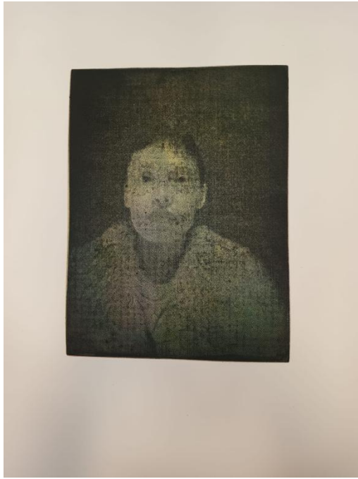
“Bez naslova”, fototransfer, akvatinta, 2024.