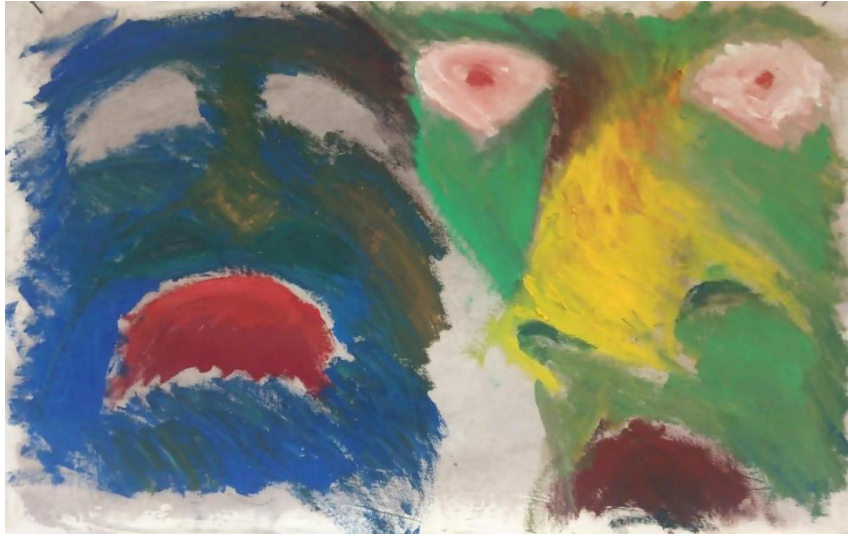
“Tihe spodobe 1”, ulje na platnu, 2023.