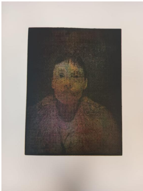
“Bez naslova”, fototransfer, akvatinta, 2023.