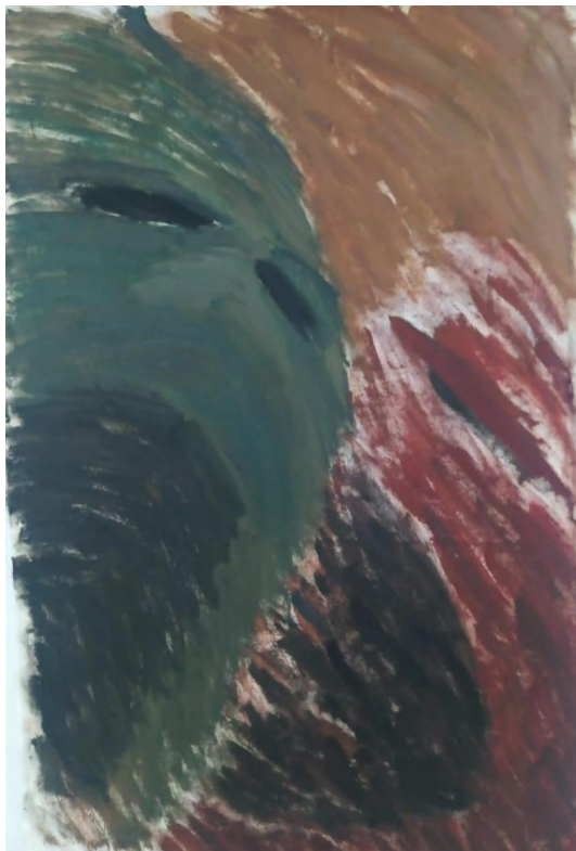
“Vrtlog vriska”, ulje i akril na platnu, 2024.