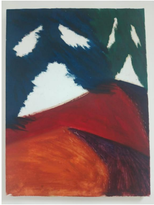
“Tihe spodobe 2”, ulje na platnu, 2024.