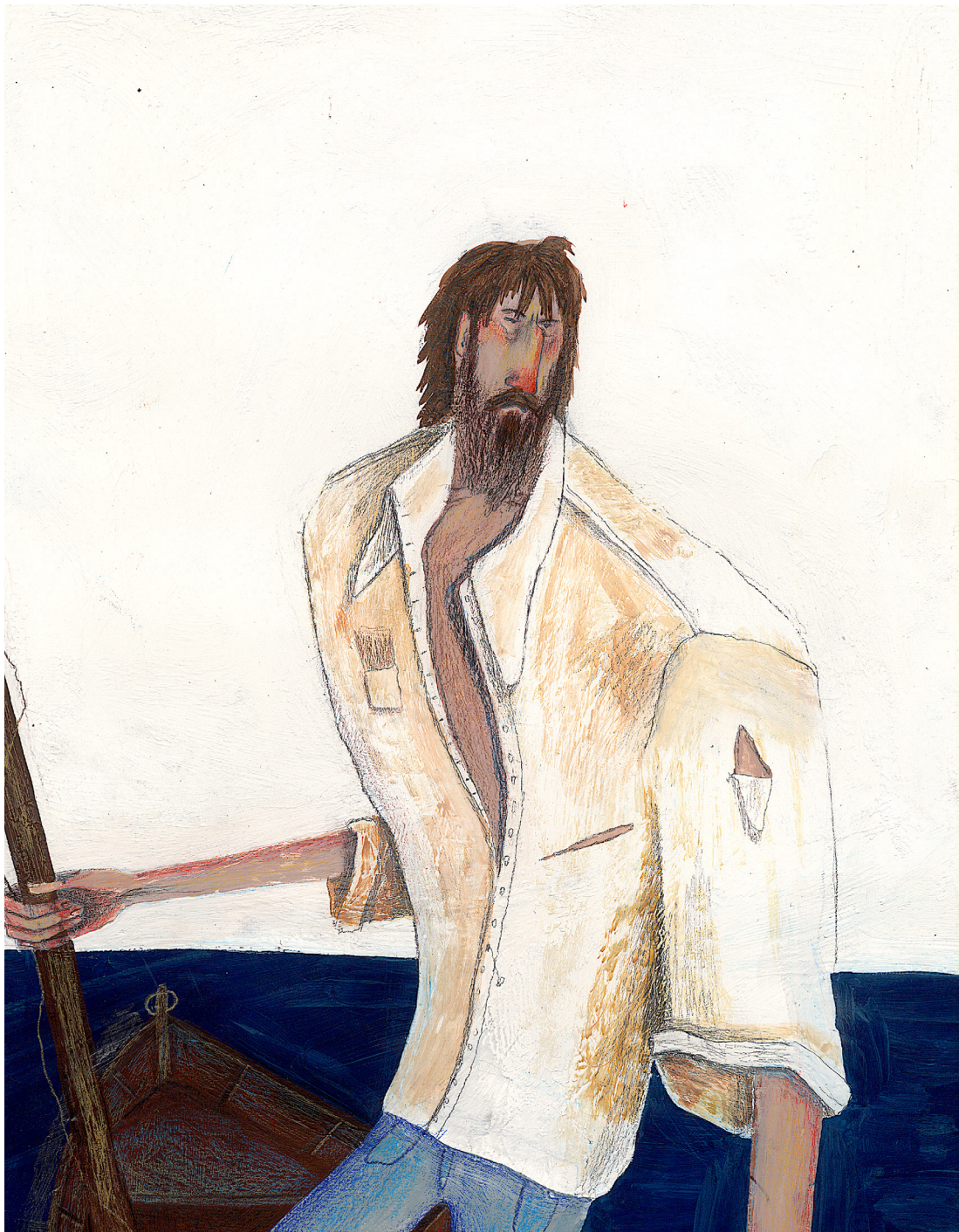
MOBY DICK tempera, akril i drvene bojice