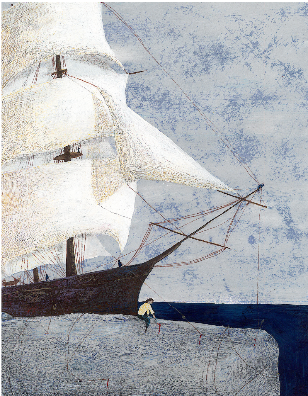
MOBY DICK tempera, akril i drvene bojice