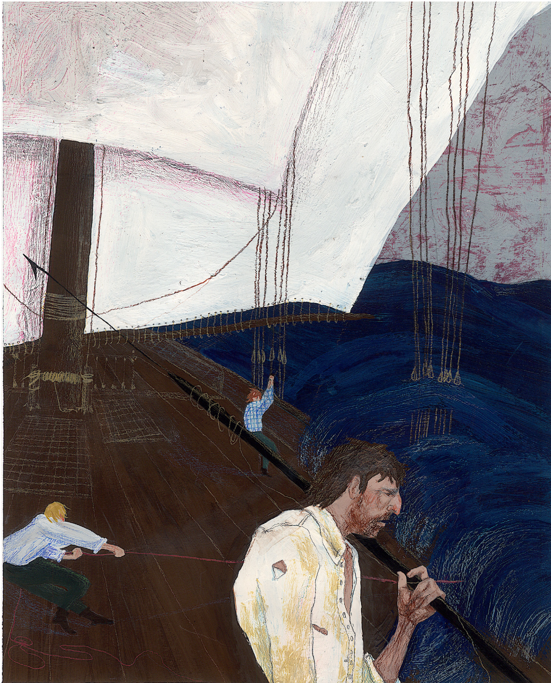
MOBY DICK tempera, akril i drvene bojice