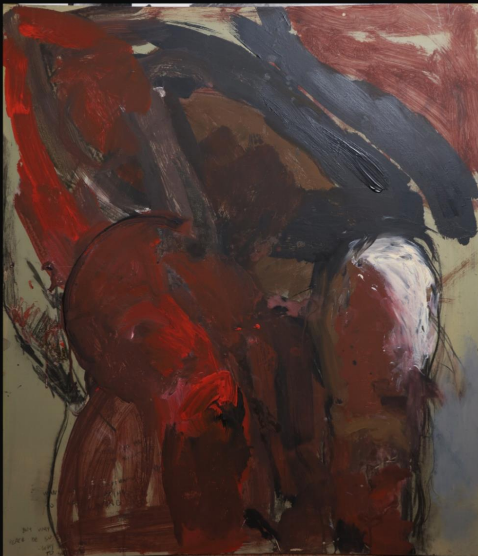
'Bez naziva', 2023., 70x80 cm, kombinirana tehnika na medijapanu