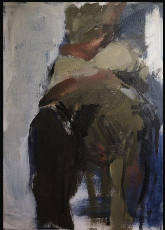
'Bez naziva', 2023., 50x70 cm, akril na platnu