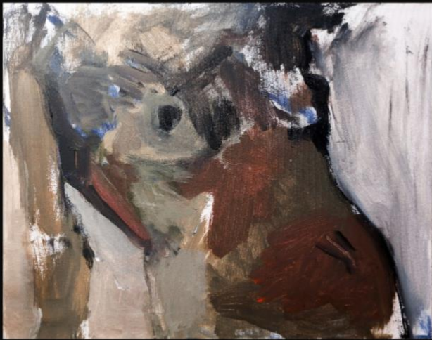
'Bez naziva', 2023., 50x41 cm, akril na platnu