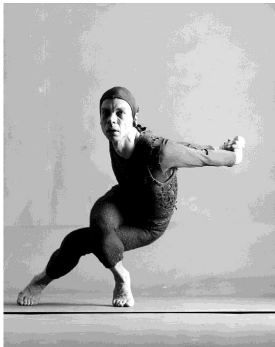
'Changeling'; Merce Cunningham, 1958.

Na način na koji Klein poziva tijelo da sudjeluje u umjetničkom procesu, sugerirajući njegovu dinamičnu narav, želim istražiti širinu i mogućnosti tijela, prikazujući različite oblike koje ono može preuzeti i ono što oni simboliziraju u kontekstu vizualnog jezika. Svaki oblik, svaki pokret, svaki detalj tijela postaje ključ za otkrivanje dublje povezanosti između ljudskog izraza i njegove vizualne manifestacije.