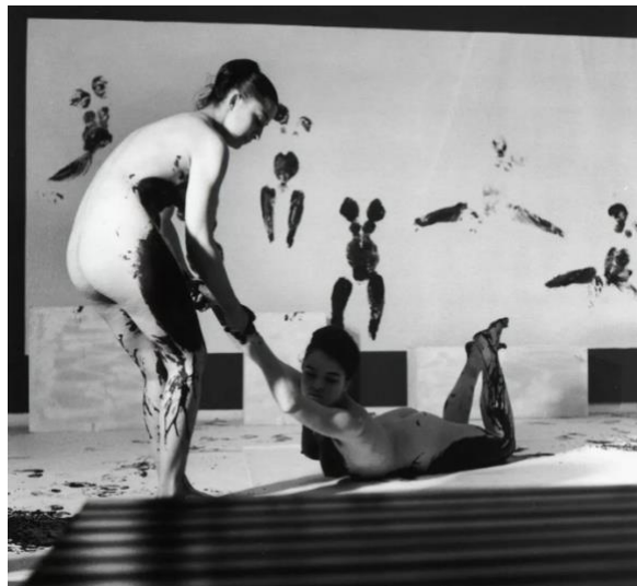
'Antropometrija'; Yves Klein

U Kleinovim radovima, vidljiva je vizija umjetnika koji se referira na tjelesnost kako bi pronašao dublju povezanost s procesom stvaranja. Kroz tu intimnu interakciju, granice se počinju gubiti. Tijelo više nije samo alat za rad, već postaje produžetak umjetnika samog.