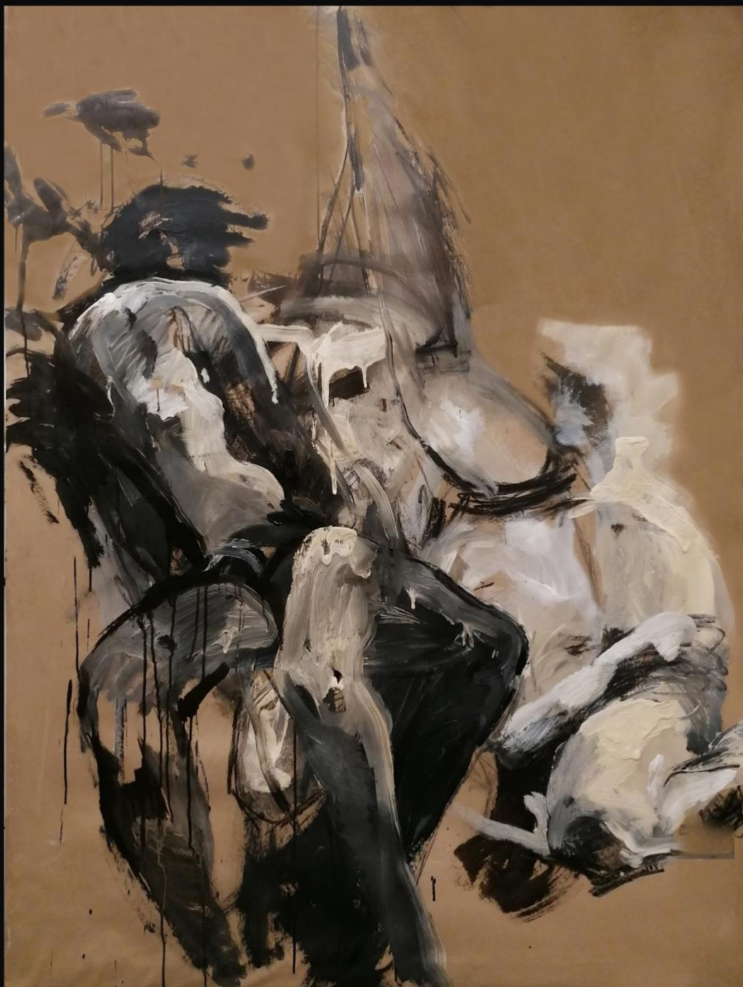
'Transformacija', 2023., 140x190cm, kombinirana tehnika na papiru