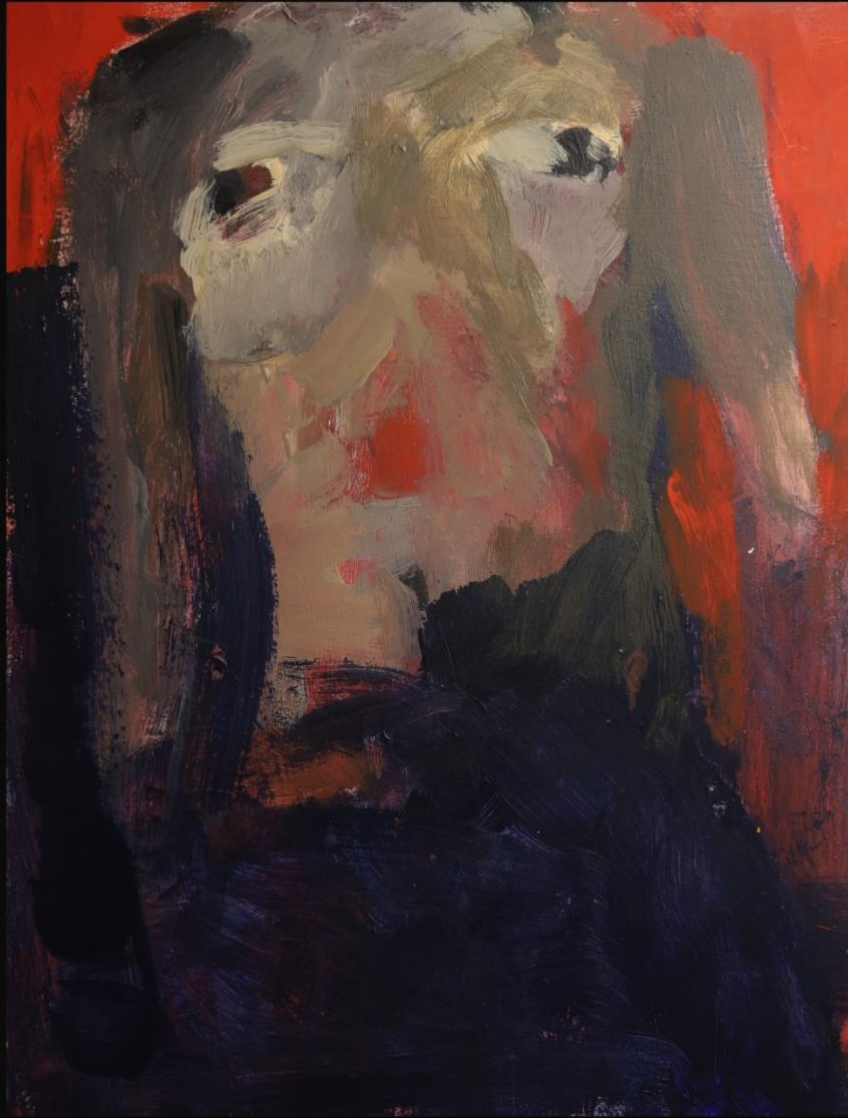
'Bez naziva', 2023., 50x70 cm