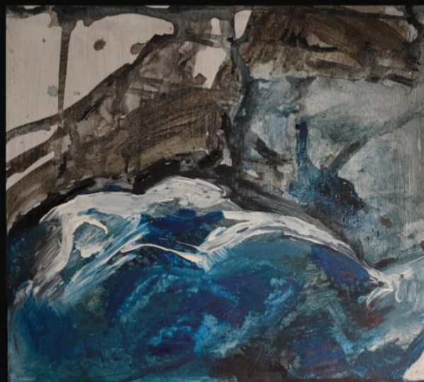
'Akt', 2023., 52x48 cm, akril na medijapanu