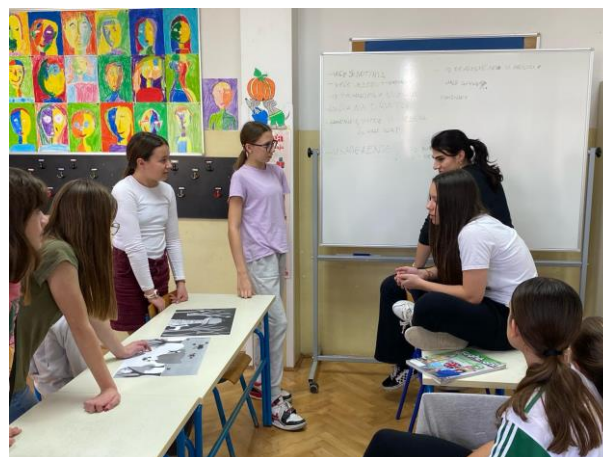
Fotografija 4: Oluja mozgova, drugi susret