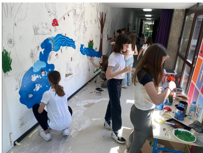
Fotografija 7: Oslikavanje zida, peti susret