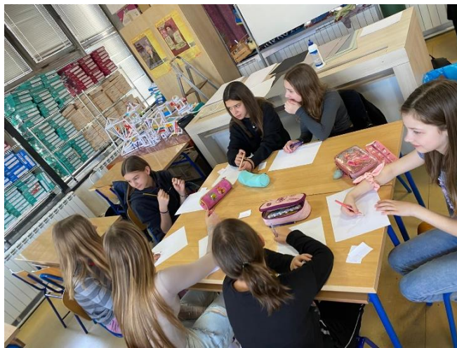
Fotografija 1: Odabir motiva, prvi susret

Druga fotografija prikazuje proces u kojem su odabrane elemente krenule izrađivati u kolažu koji je služio kao skica za daljnji predložak.