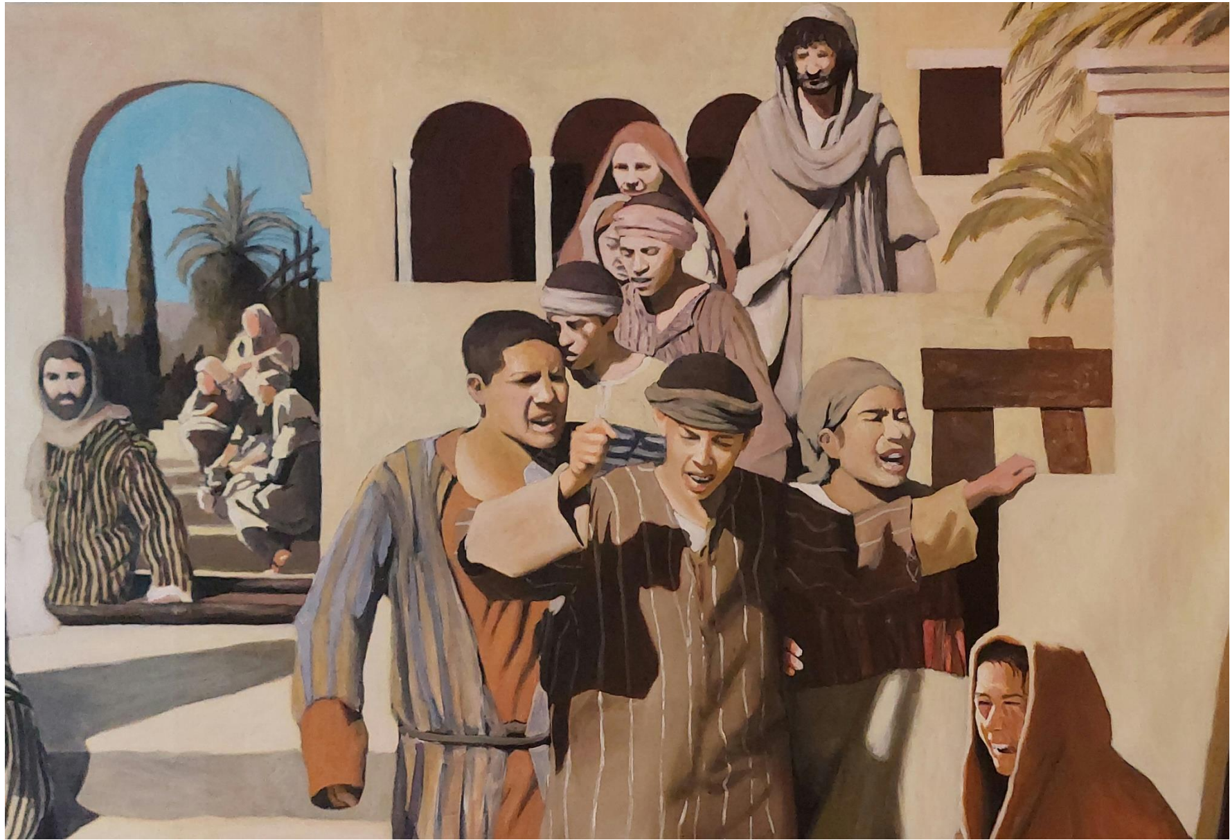
Slika 11. Detalj