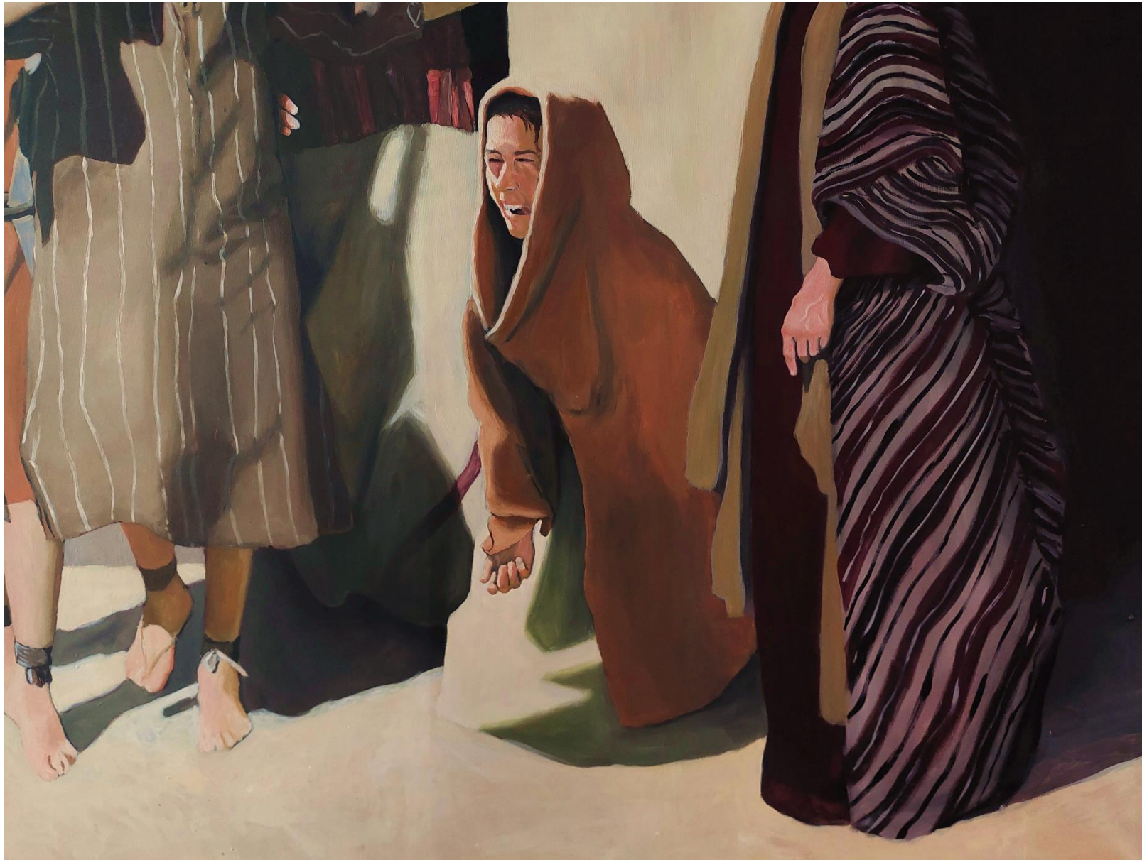
Slika 12. Detalj