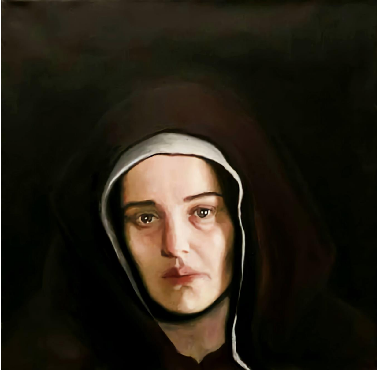
Slika 2. Gospa, 2023., akril na platnu, 40x40 cm