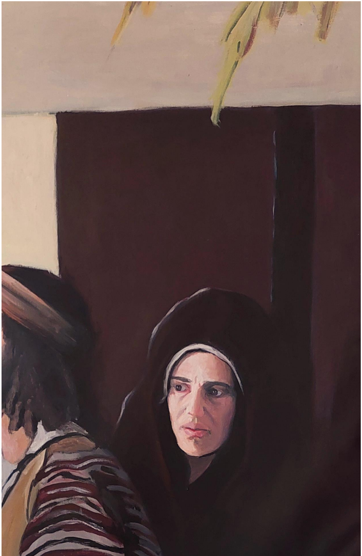
Slika 18. Detalj