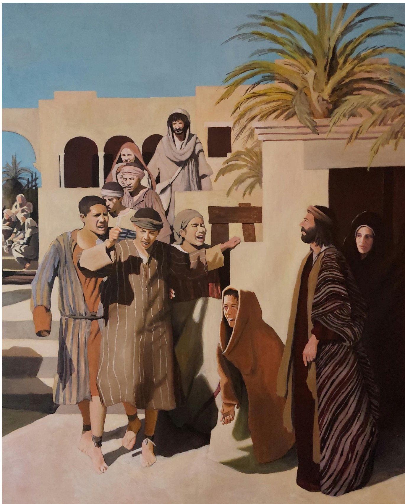
Slika 14. Detalj