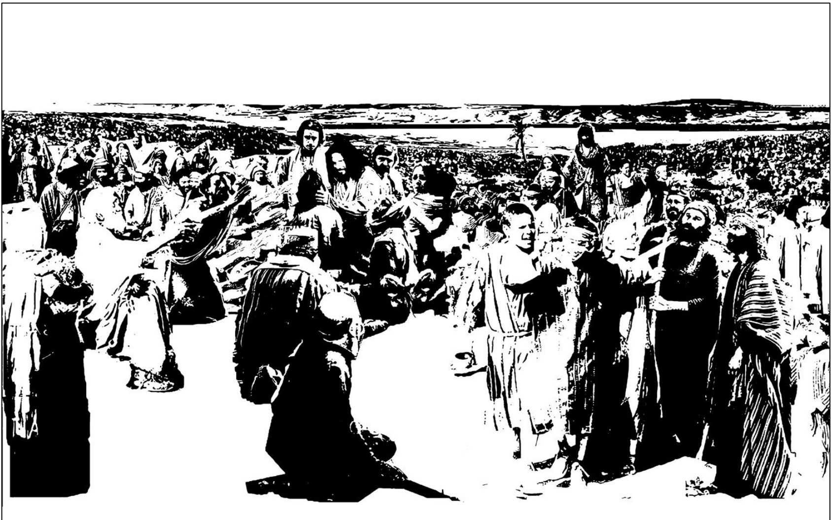
Slika 4. Isus ozdravlja bolesne, skica; jedna od detaljnijih razrada ideje za diplomski rad, digitalni kolaž 2023.