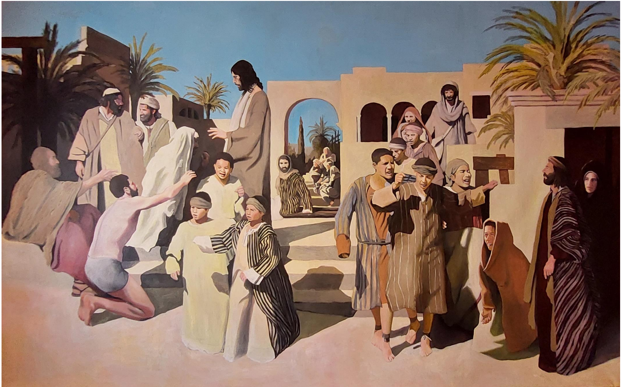
Slika 9. Diplomski rad. Antonio Piljek Jagić, Milosrde – Isus ozdravlja bolesne, 2024., akril na platnu, 250x400 cm