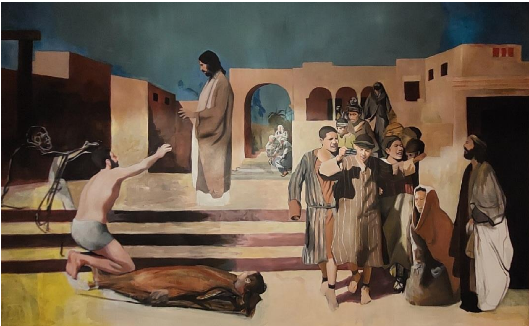
Slika 6. Fotografija tijekom slikanja - još nedovršenog rada, 2024.