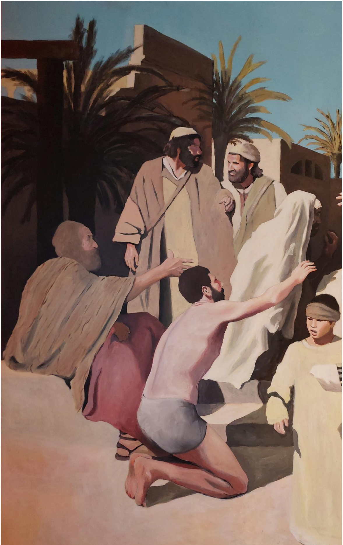
Slika 17. Detalj