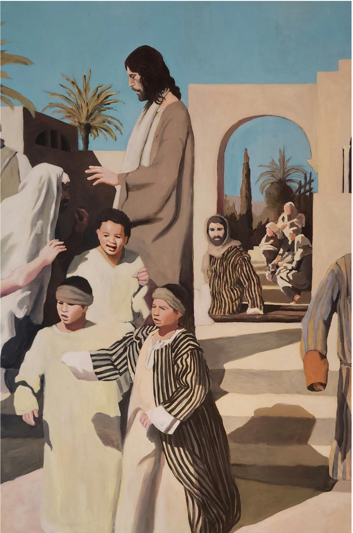
Slika 15. Detalj