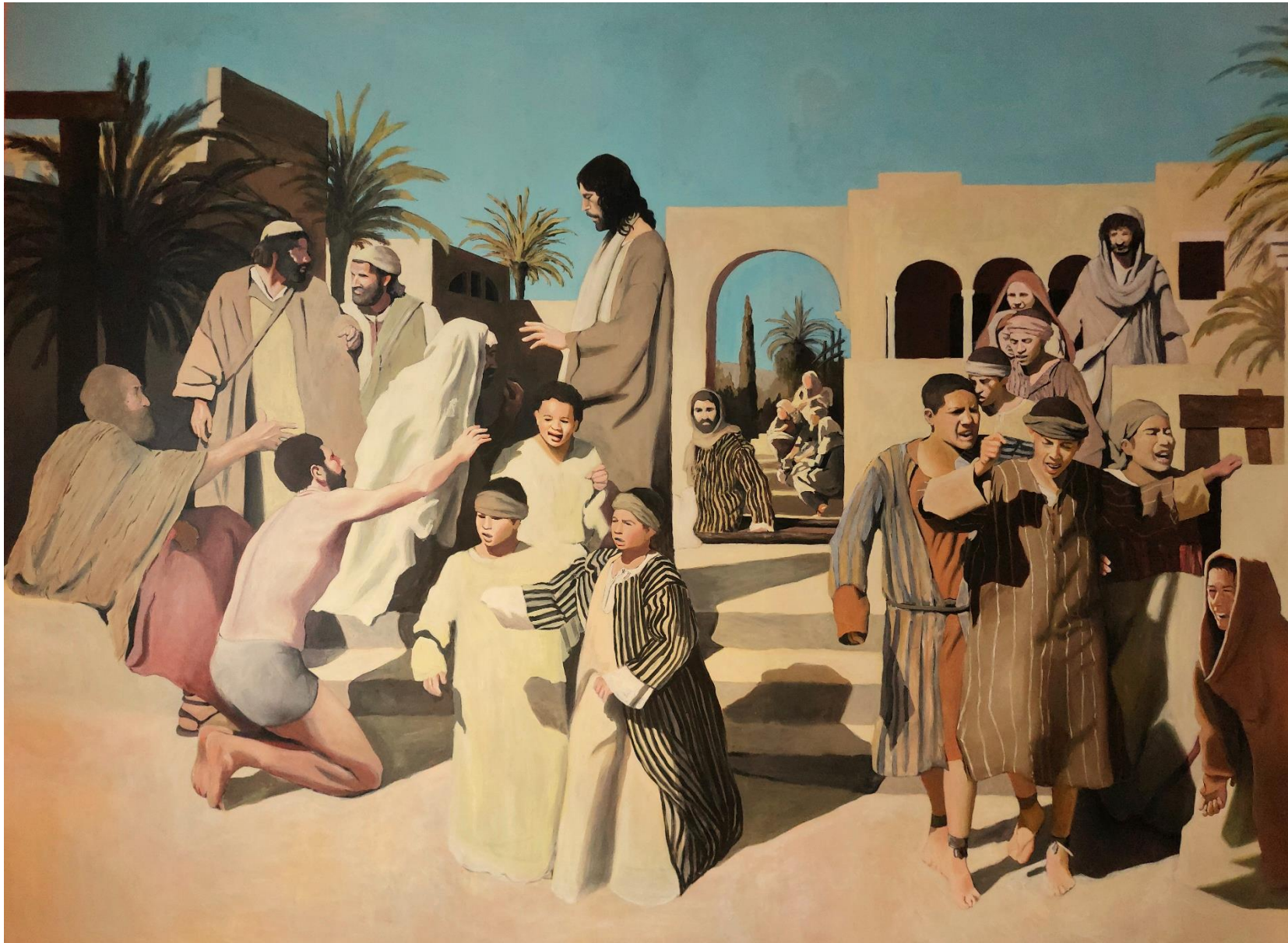
Slika 10. Detalj