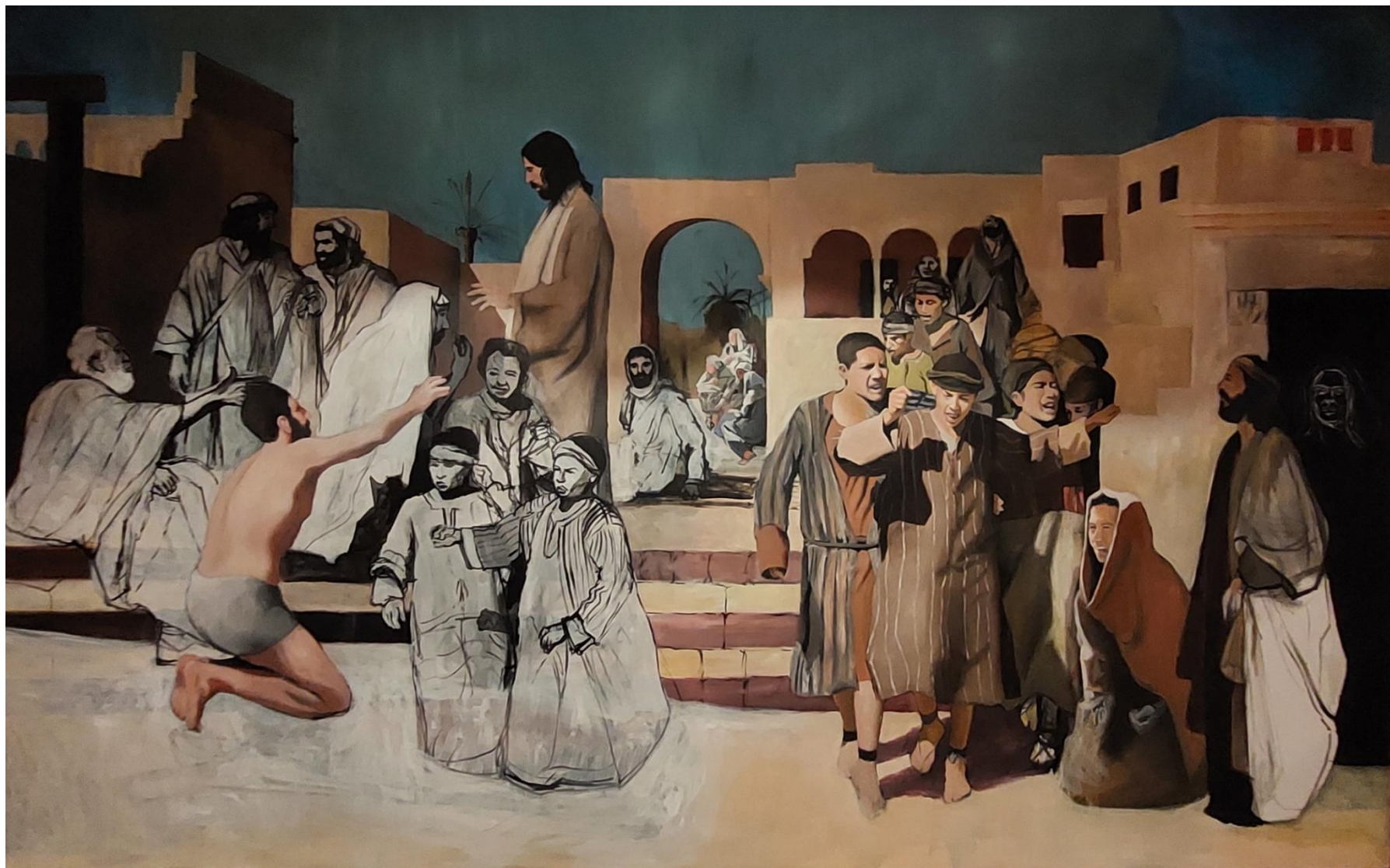
Slika 7. Fotografija tijekom slikanja - još nedovršenog rada, 2024.