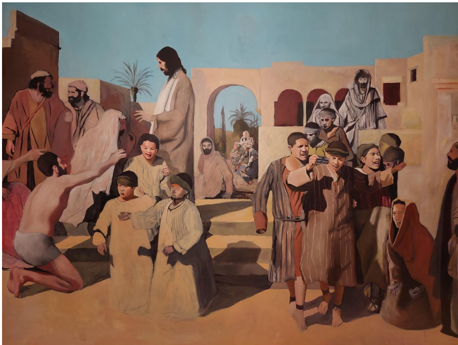
Slika 8. Detalj nedovršene slike, 2024.