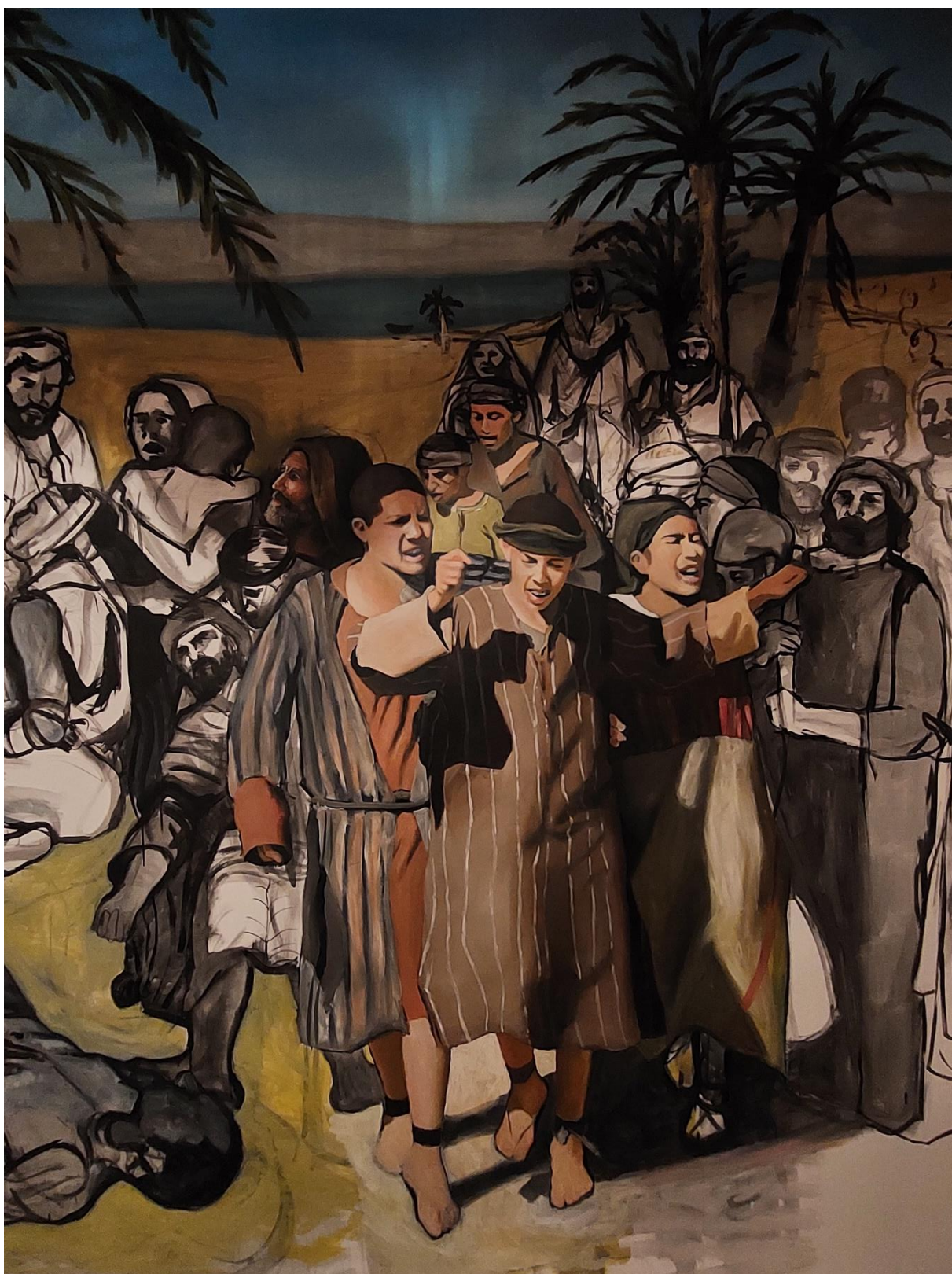
Slika 5. Detalj nedovršene slike, 2024.