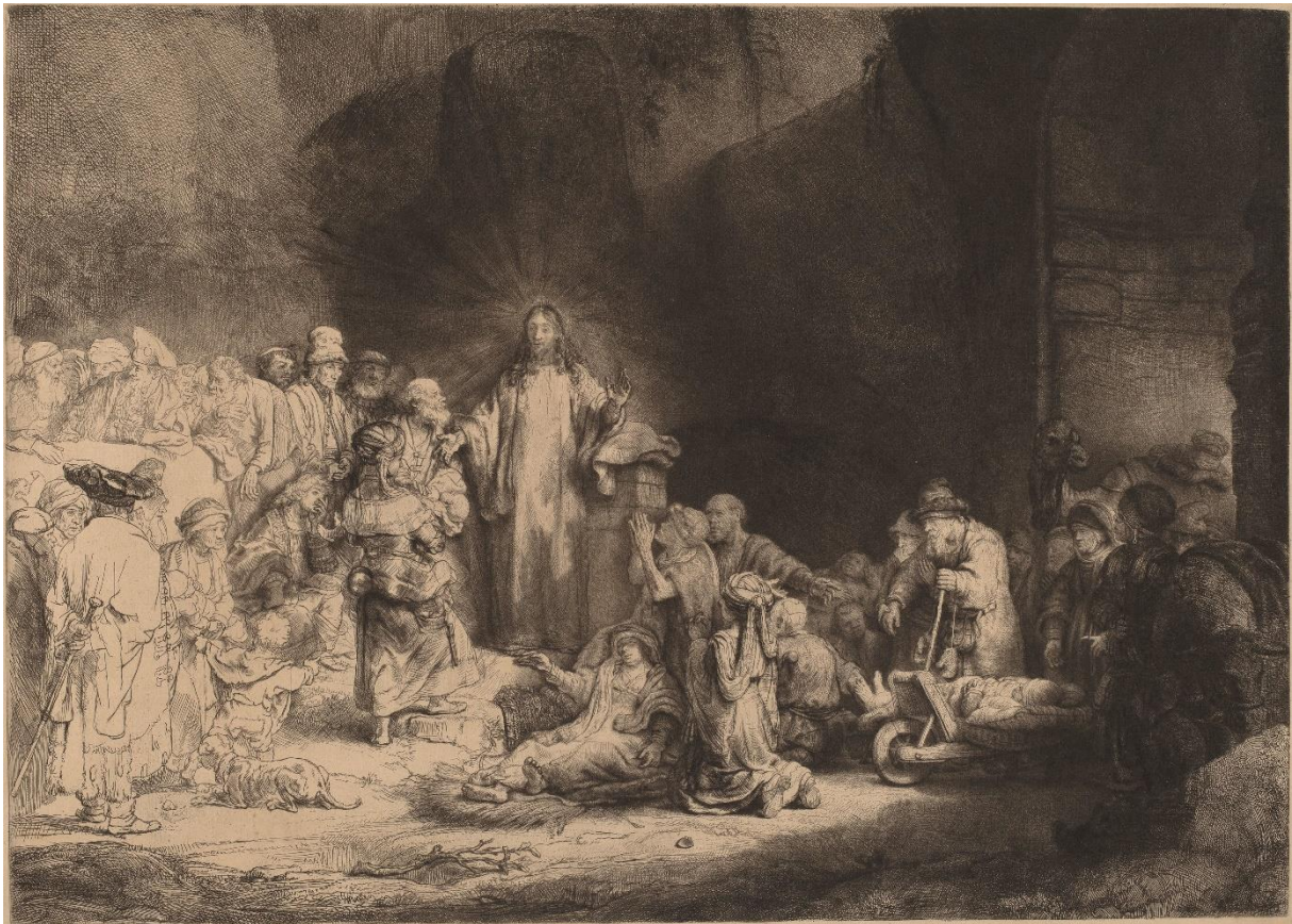
Slika 1. Rembrandt van Rijn, List za sto guldena , c. 1646., bakropis, akvatinta i suha igla, otisak 279 x 393 mm, list 381 x 562 mm, Rijksmuseum, Amsterdam

Rembrandtova (Rembrandt Harmenszoon van Rijn, 15. srpnja 1606., Leiden, Nizozemska - 4. listopada 1669., Amsterdam, Nizozemska) grafika List za 100 guldena koja se još naziva Isus ozdravlja bolesne i Isus propovijeda djeci je bliska slici ovog diplomskog rada i inspirirala je ovaj diplomski rad.