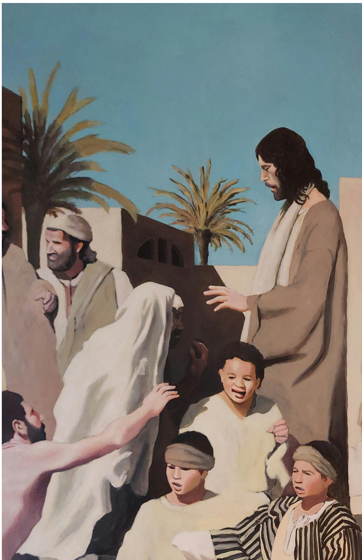
Slika 19. Detalj