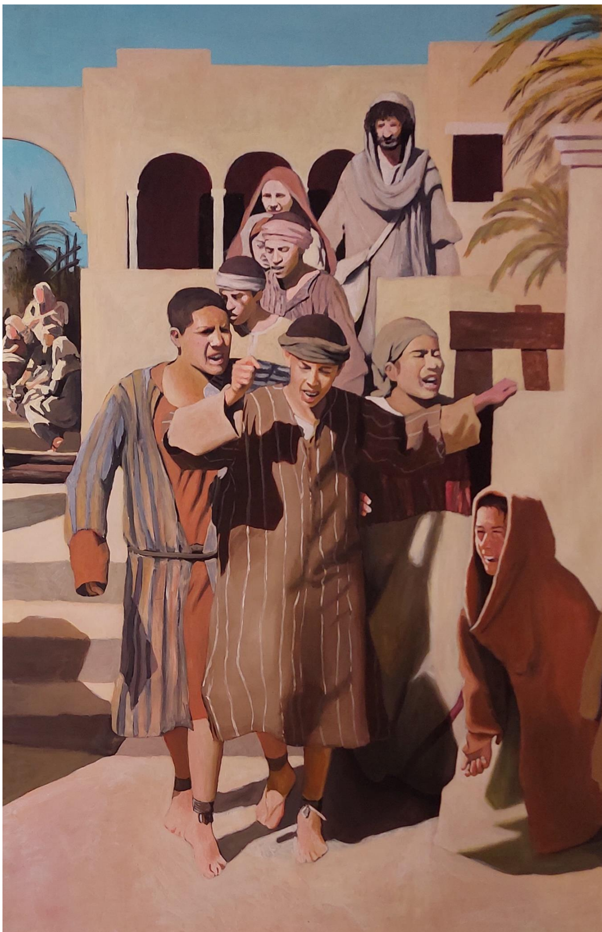
Slika 16. Detalj