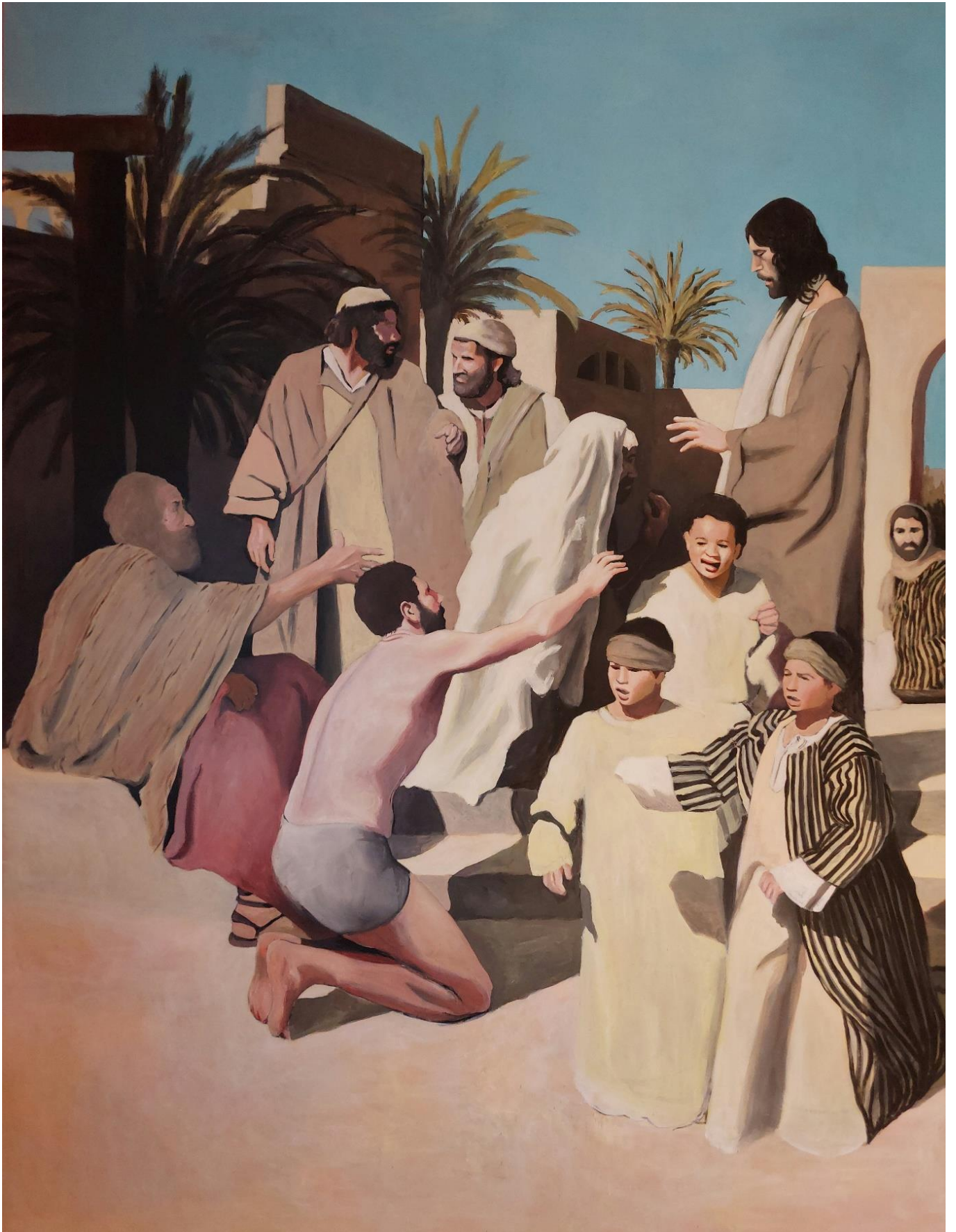
Slika 13. Detalj