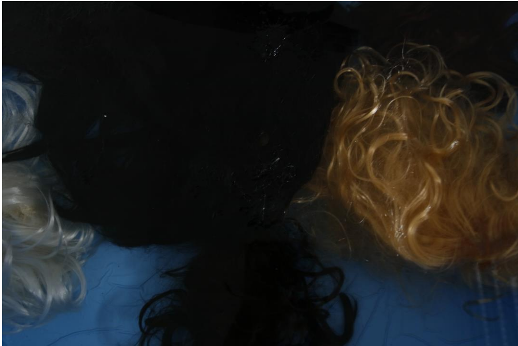
Sl. 4. Kiparska instalacija Skok su sebe , detalj