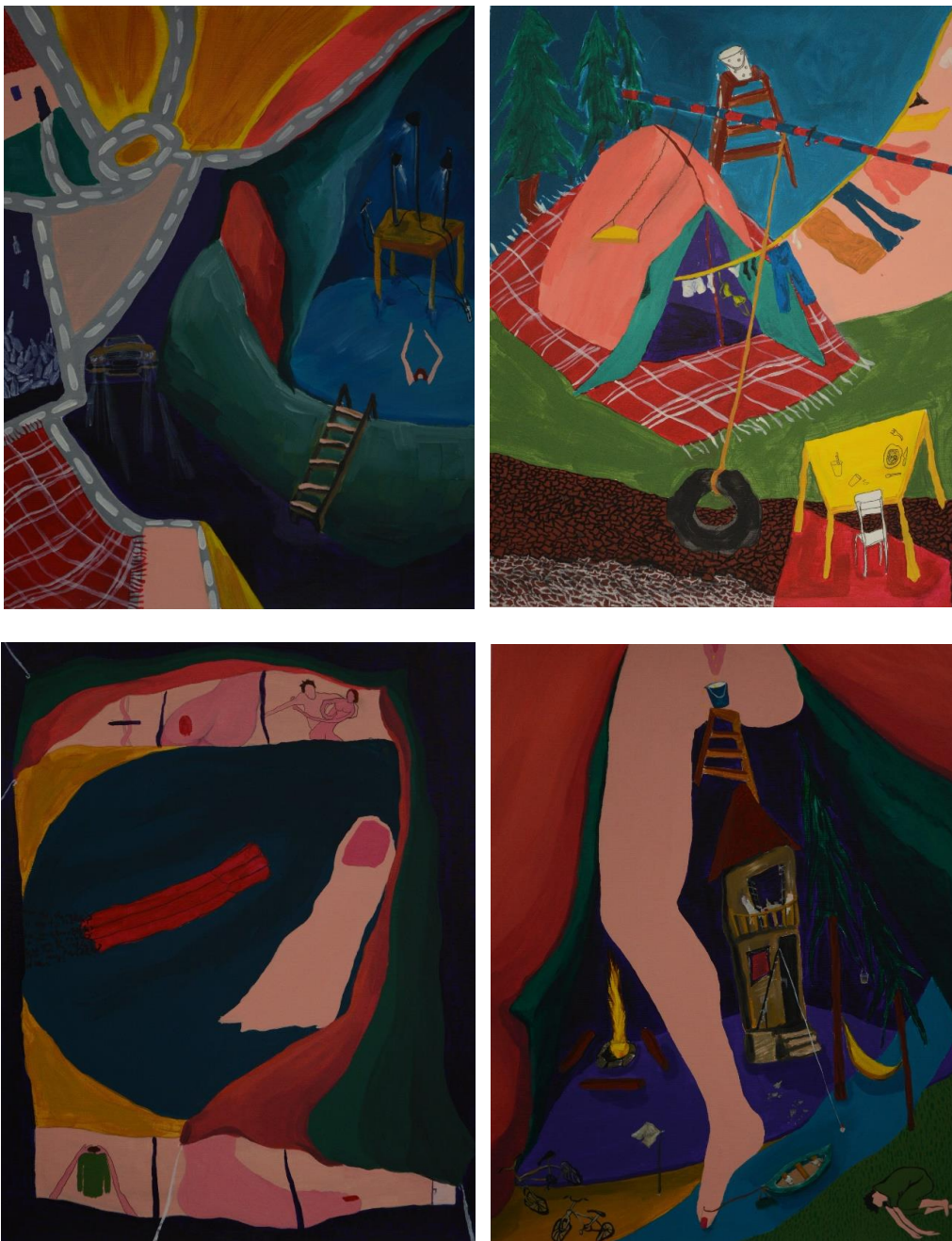
Sl. 1. Slikarski radovi, Gore lijevo: Prekid , Gore desno: Djetinjstvo , Dolje lijevo: Petnja , Dolje desno: Na vikendici , akril na lesonitu, 50 x 70 cm, 2016.