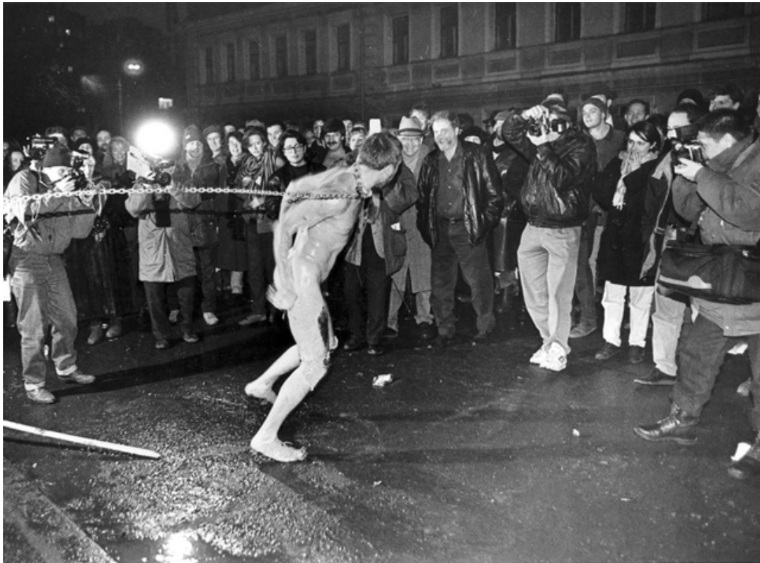
Oleg Kulik Mad dog 1994.