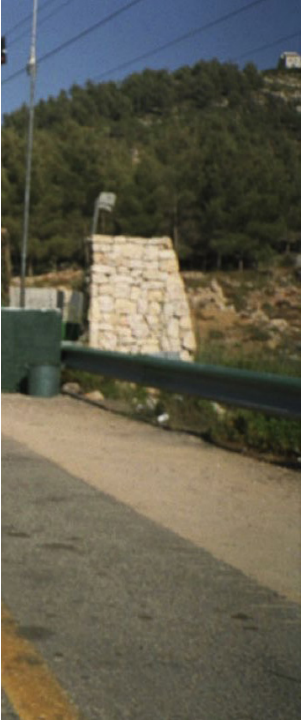
Francis Alÿs The Green Line 2004.