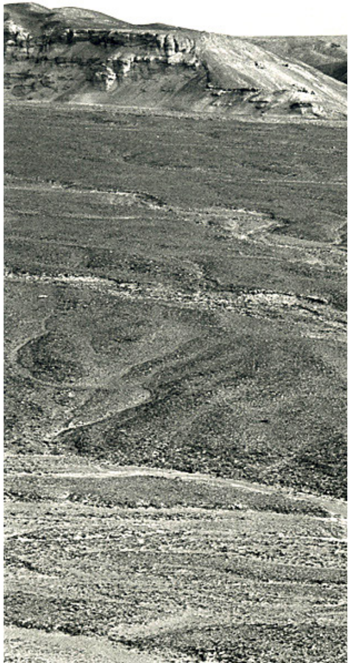
Richard Long Walking a line in Peru 1972.