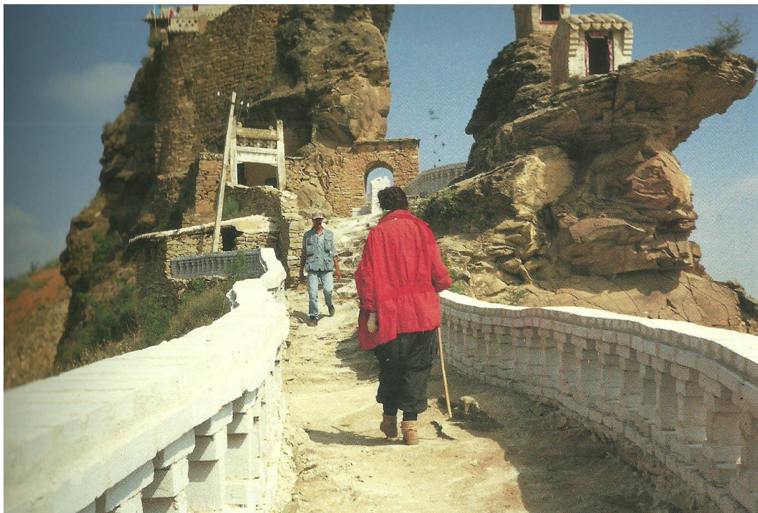
Marina Abramović i Ulay Lovers - The Great Wall Walk 1988.