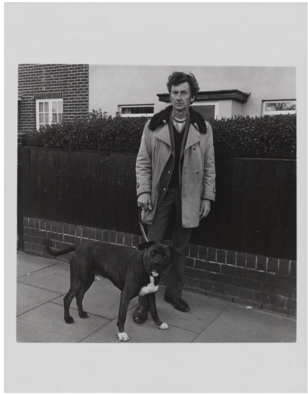
Keith Arnatt Walking the dog 1976. - 9