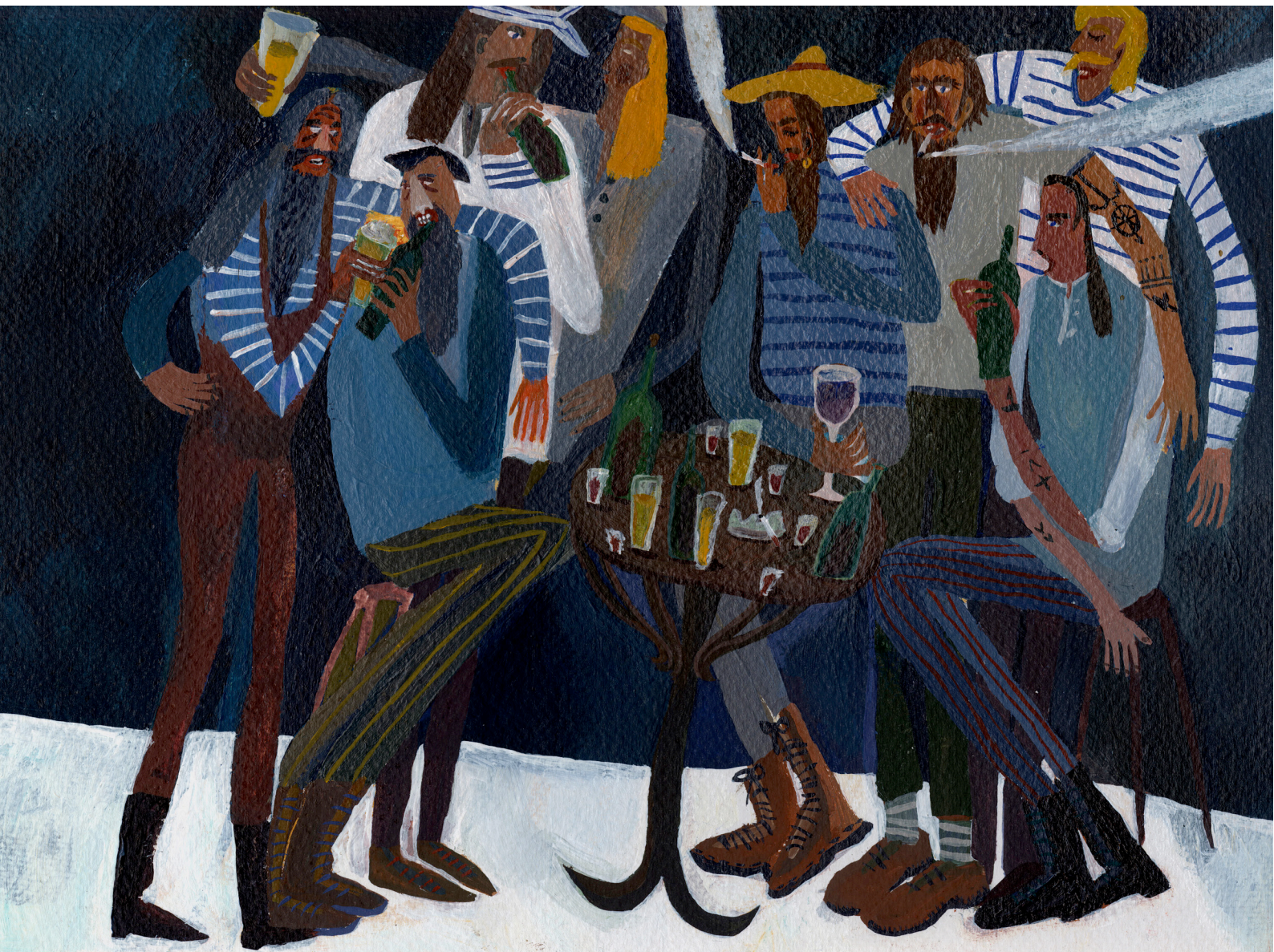
slika 8. Gostionica Kitolovac