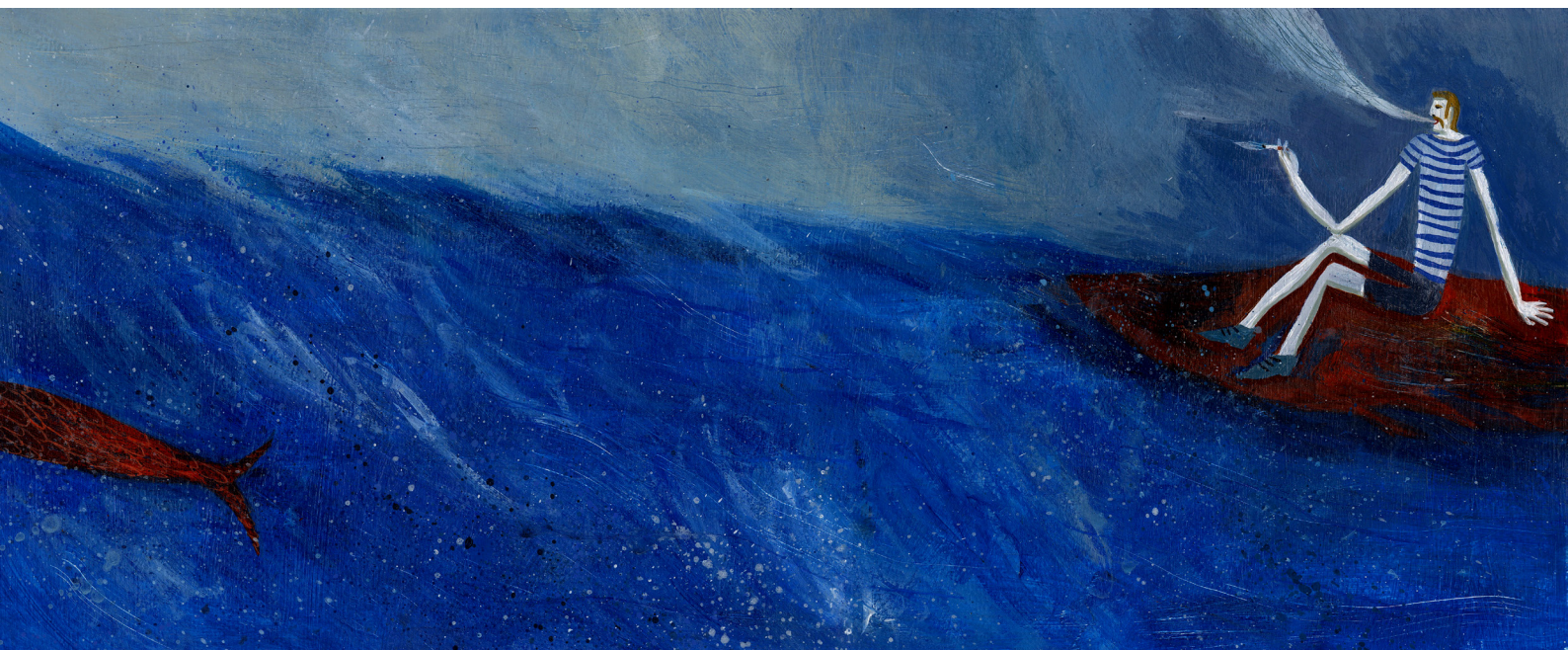
slika 6. Ismael žudi za životom na moru