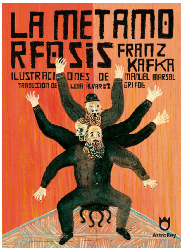
slika 12. Manuel Marsol Franz Kafka: Preobražaj

Mnogo puta kada je netko spominjao ilustraciju i dječje slikovnice, čula sam u tonu pomalo negativan prizvuk. Možda zato što je u dosta slučajeva namjenjena djeci, a ne zato da bi je „učeni i stručni“ promatrali na zidovima galerija. Nikada mi nije bilo jasno zašto, s obzirom da knjige odgajaju mnoge naraštaje, a počinjemo ih gledati od najranije dobi. Djeca bi trebala biti okružena sa što kvalitetnijim vizualnim sadržajem, na taj način uče o tome što sve postoji, ali istovremeno razvijaju svoju maštu i kreativnost. Također smatram da ilustracija nije nešto što je isključivo namijenjeno „samo za djecu“. Postoje mnogi klasici na čijim se stranicama nalaze ilustracije iz svih krajeva svijeta. Mnoga izdanja imaju naslovnice svjetski poznatih ilustratora i umjetnika.