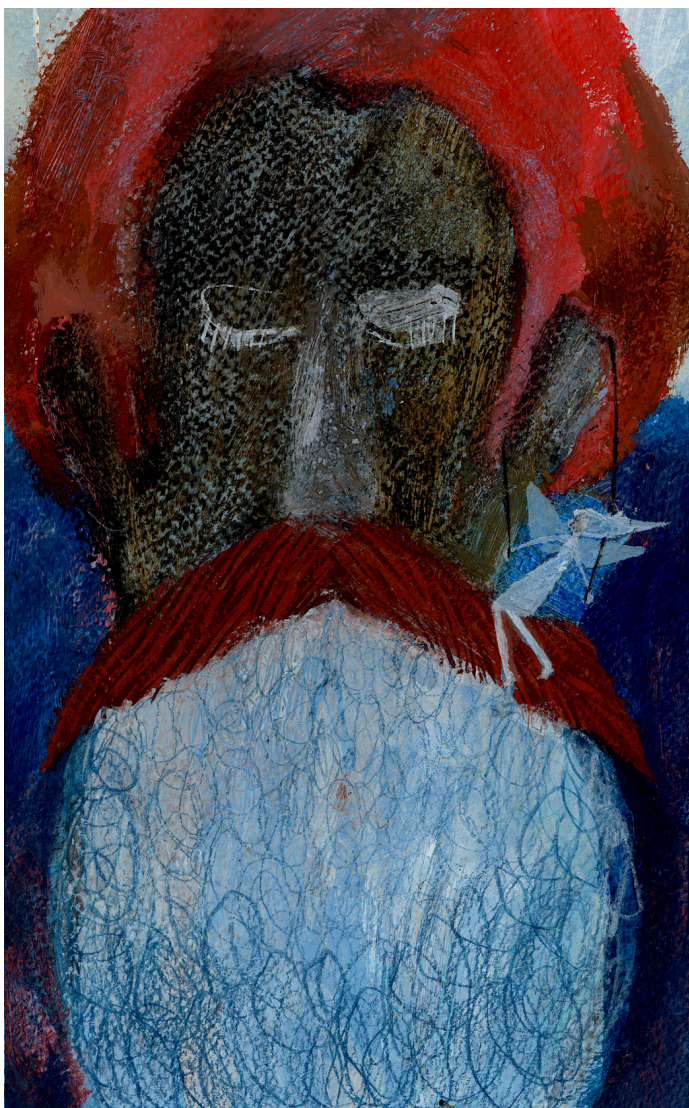
slika 3. skica Regoča i Kosjenke

Na toj godini tek sam zagrebla površinu i probala sam raditi ilustracije prema zadanom tekstu. Odabrala sam Regoča Ivane Brlić Mažuranić i na kraju sam se zadržala samo na skicama. Tada sam započela razmišljati o tome što je bitno kada pred sobom imam napisani tekst. Počela sam skicirati likove i kompozicije, tražila sam segmente teksta koji su bitni te sam smišljala što i kako prikazati. Istovremeno sam se prisjetila autora i ilustratora čiji rad smatram kvalitetnim, a otkrila sam i mnogo novih čiji me rad inspirira. Kako nikada nisam završila taj projekt i započela sam još par sličnih koji su na koncu ostali nedovršeni u ladicama ili mapama htjela sam se zaista posvetiti tome da realiziram jedan ilustratorski projekt i napravim seriju ilustracija. Ta godina na Akademiji kroz sve zadatke i vježbe, od plakata, prijeloma i ilustracija bila mi je poticajna da me usmjeri da započnem i završim ono što me intrigiralo.