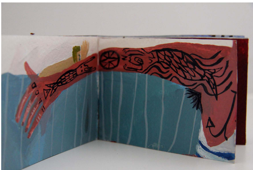
slika 4. i 5.. skice za ilustracije

Paralelno dok sam čitala knjigu bilježila sam dijelove teksta koji su mi bili zanimljivi i istovremeno sam ih skicirala. Nakon puno malih skica u blokiću, crteža likova, mjesta, broda započela sam storyboard cijele radnje i kronološki sam podijelila ilustracije u malu knjižicu. Nakon skiciranja, krenula sam s izradom ilustracija. Odabrala sam meni osobno najzanimljivije dijelove knjige i pokušala ih prikazati svojim očima. Odlučila sam ilustracije namijeniti mlađoj publici, s obzirom da bi ovakav klasik htjela približiti i djeci. Kao što sam već i napisala, uvijek će mi ostati u sjećanju priče o raznim avanturama i pričama iz književnosti koje mi je prepričavao tata, te sam iz takve perspektive htjela prikazati Moby Dicka. Informacije koje sam saznala čitajući knjigu i analizirajući tekst, htjela sam prikazati vlastitim očima i ukazati na svoj doživljaj te priče.