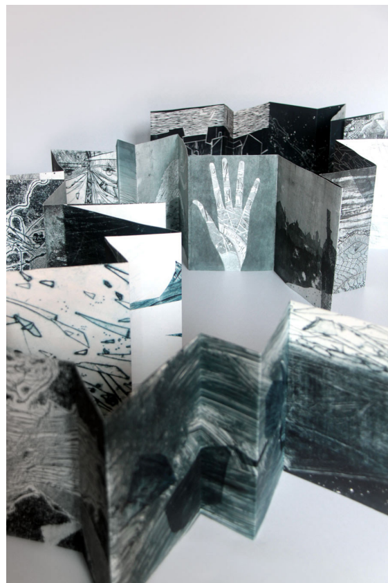
slika 13. Victoria Semykina F.M. Dostoevski: The Double