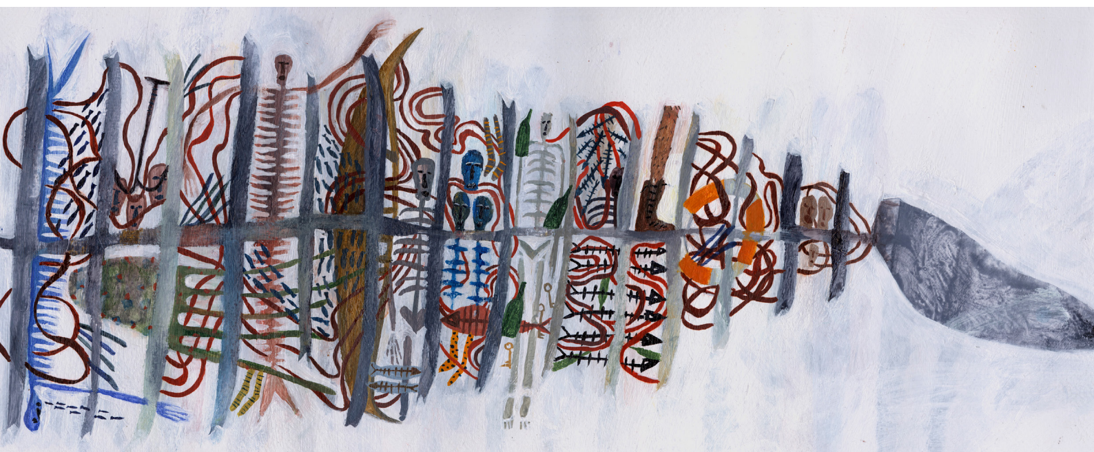
slika 7. Što se sve nalazi u utrobi kita