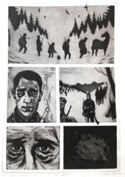
Idi i smotri, 2018., bakropis i akvatinta

Moje stripove karakterizira potpuno odsustvo teksta, što u prvi plan donosi sliku, odnosno vizualni jezik stripa. Nadalje, nepostojanje tekstualnih oblačića ostavlja dojam mističnosti i nepoznatog, te pruža mogućnost osobne interpretacije radnje koju strip donosi. Eksperimentiranje u ograničenoj, jednostraničnoj formi stripa jednako je ograničavajuće koliko i zabavno zbog likovne „igre“, odnosno traženja odgovarajućeg motivskog ili rakursnog rješenja za svaki kadar (vinjetu). Vrlo važnu ulogu pri stvaranju sveukupne, mračnije, atmosfere ovih stripova imao je tehnički aspekt njihove izrade, odnosno grafička priprema i tisak, kao i slučajnosti koje taj proces ponekad proizvede na završnom otisku. Tehnike dubokog tiska, bakropis i akvatinta, koje su korištene na ovim stripovima, omogućuju stvaranje zasićenih crnih sjena i naglašenih kontrasta karakterističnih za europske strip crtače kao što su Manu Larcenet ili Ivo Milazzo čije me stvaralaštvo inspirira.