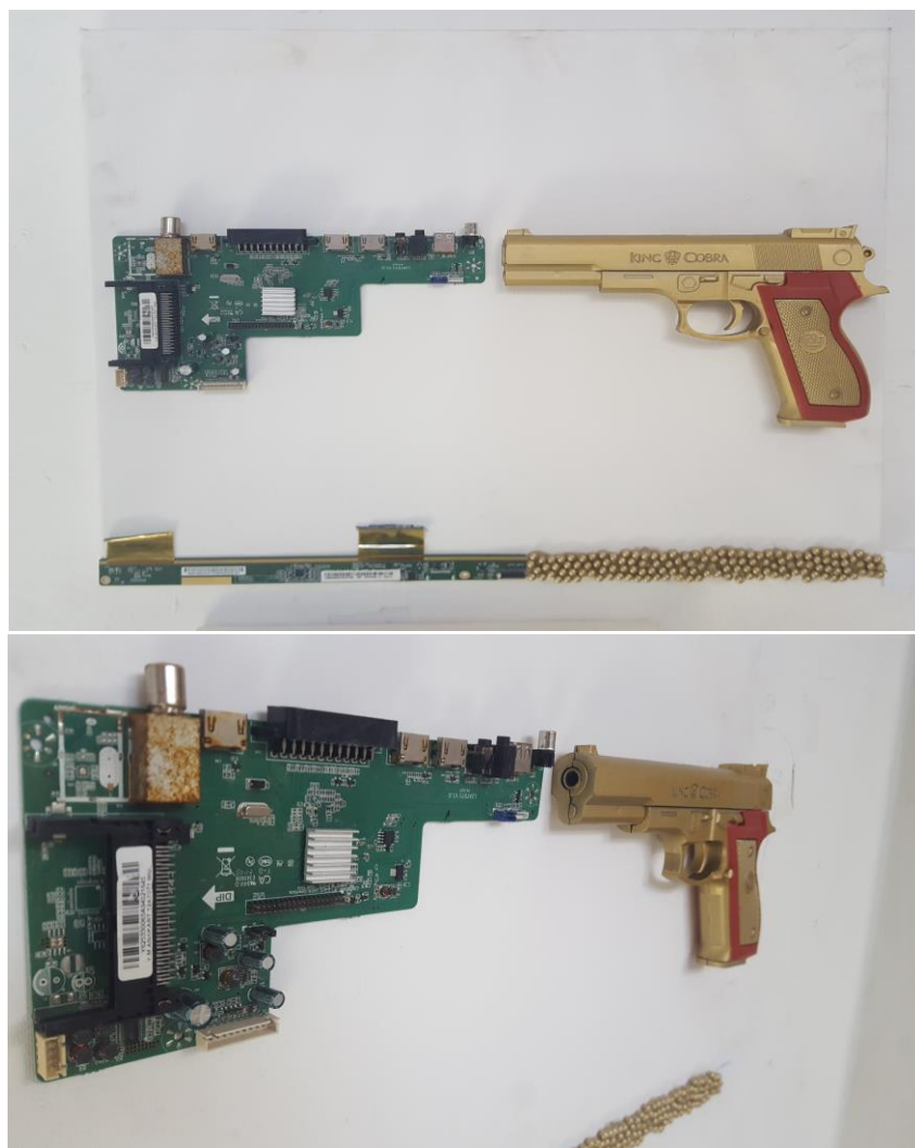
Hibridni rat; 2018., eksperimentiranje oblicima i predmetima

Umjetničkom procesu je zadana svrha proširenja granica umjetnosti istraživanjem novih medija.