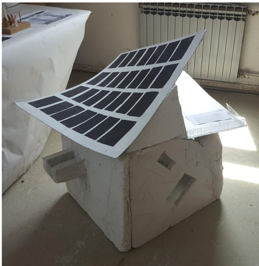
Sunčev krov ; 2018., gips, pleksiglas, ljepenka, stiropor, boja