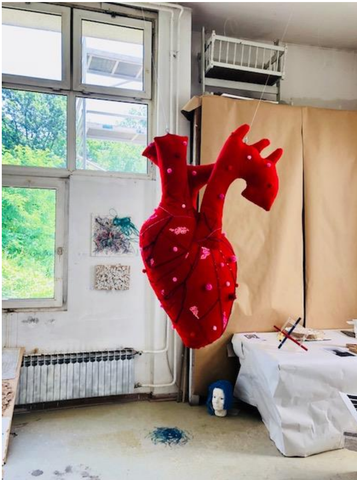
Samo se srcem dobro vidi, 2018., kombinirana tehnika