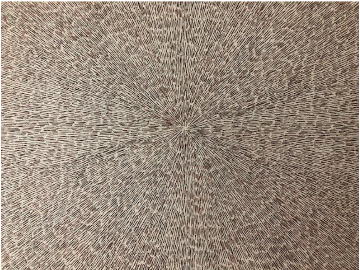
Titram , 2018., Bakropis, detalj