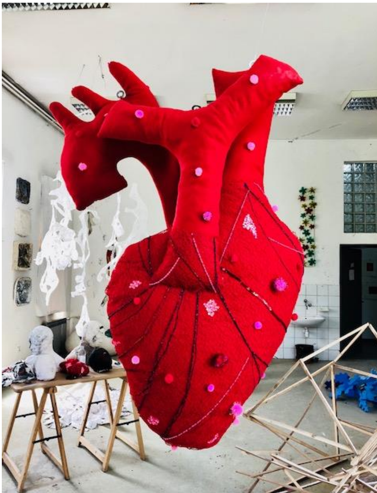
Samo se srcem dobro vidi , 2018., kombinirana tehnika