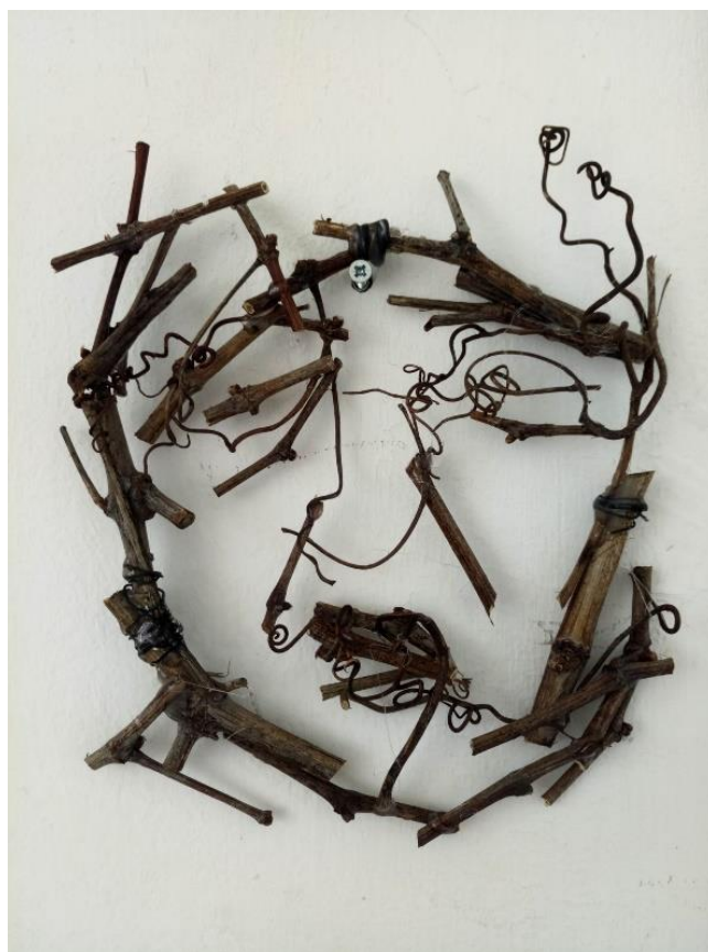
Bez naslova, 2018., drvo žica, silikonsko ljepilo

U kiparstvu sam se iz sličnih pobuda bavila temom gubavaca. Za izvedbu tih ideja više sam razmišljala o samome materijalu koji bih koristila pri izvedbi. Razmišljanja su rezultirala odabirom trulog drveća i granja. Koristila sam trulo drvo koje sam nalazila u šumi, po tlu te granje sa stabala koja su se urušila i sasušila. To drvo se raspada, veoma je krhko i suho, slabo je i puca. Lica gubavaca gradila sam od njih, usredotočivši se samo na glavne crte, bez detalja. Pokušala sam ostati u skladu sa samim materijalom i njegovom poetikom te prenijeti glavne sugestije crta lica, emocija i pogleda. Isto tako, tim svojstvima koje granje ima, pokušala sam dočarati raspadnutost kojom odišu gubavci, tu bolest i krhkost. Svi portreti koje sam napravila jako su krhki i lagani, povezani samo žicom ili ljepilom. Materijal je ovdje još dodatno naglasio cijelu ideju gubavaca te joj aktivno doprinosi time što propada zajedno s njima. Kako gubavci propadaju tjelesno i približavaju se smrti, tako i to drvo i dalje propada i truli. Ono je u cijelom procesu raspadanja te će se s vremenom potpuno raspasti i umrijeti, a radovi više neće postojati.