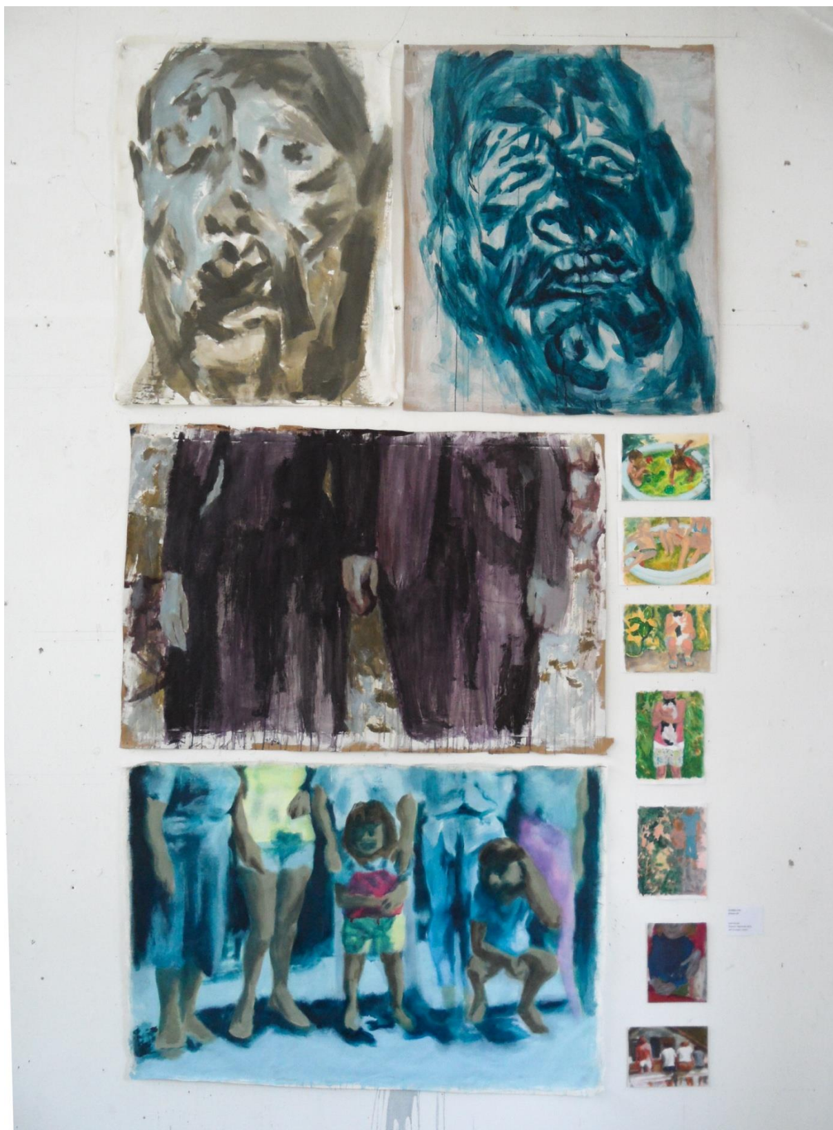
Gubavci/Nepoznati, 2018., akril na platnu i papiru