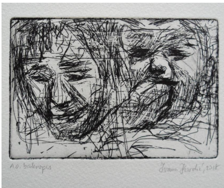
Bez naslova, 2018., bakropis

Mogućnosti ove teme istraživala sam i u mediju grafike, kroz koju tema na jedan drugačiji način progovara. Radila sam prvenstveno u tehnici bakropisa, iako sam isprobala i tehniku akvatinte. Na početku sam bila zarobljena tehnikom. Doživjela sam bakropis kao nešto pedantno i sitničavo, no kroz proces rada i upoznavanje sa svime, odbacila sam tu svoju krivu percepciju. Napravila sam seriju od 10 bakropisa na istu temu. Kako bih se oslobodila određenih pravila i procesa, za materijal sam uzimala cinčane pločice koje nisu bile ispolirane - bile su prljave, izgrebane i oštećene. Te stare pločice rezala sam na nepravilne oblike i nisam se ograničavala s kadrom i formatom. Sve sam gubavce iscrtavala bez prenošenja skice indigom na bakropisnu osnovu, bez posrednih načina i pomoći. Sve sam direktno crtala na bakropisnoj osnovi. Radila sam po raspoloženju, nisam brinula o tome da mora sve biti identično kao skica, brinula sam o ekspresiji koju ću prenijeti i o emocijama koje su me povezivale s temom. Koristeći deblje igle i grebanje, stvarala sam linije koje se međusobno isprepliću, što je kod jetkanja rezultiralo njihovim spajanjem i stvaranjem tamnijih površina kod otiskivanja. Te tamne površine doprinijele su ekspresiji i izobličenjima koje sam htjela prikazati. Uz sve to, neispolirana pločica doprinijela je cijelom kontekstu rada i priči koja stoji iza radova. Sveukupno, cijela atmosfera ove tehnike i procesa doprinosi sadržaju i potpunom doživljaju.