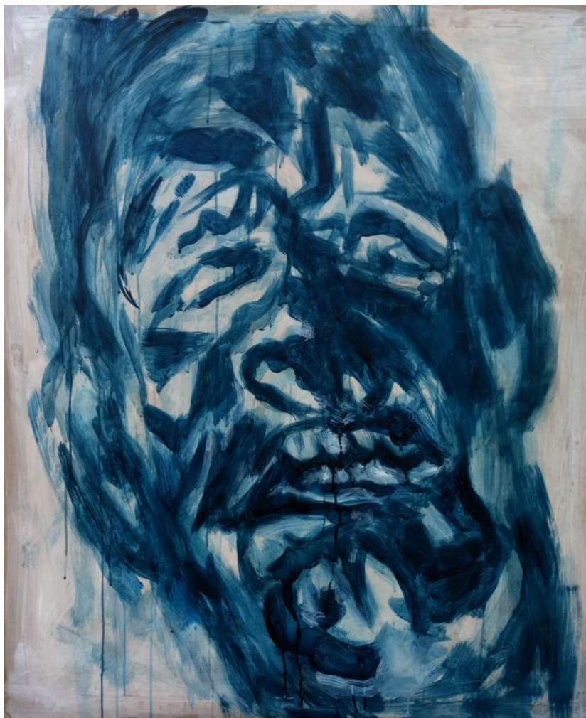
Gubavac II , 2018., akril na papiru

Na kraju se dogodila ta suprotnost da poznatim osobama iz obiteljskog albuma na slici izostavljam lica kao glavnu oznaku identiteta i pronalazim ga u njihovim radnjama, postupcima i odnosima, a identitet gubavaca pronalazim upravo u ekspresijama njihovih lica. U tom smislu postoji poveznica između tih dvaju ciklusa.