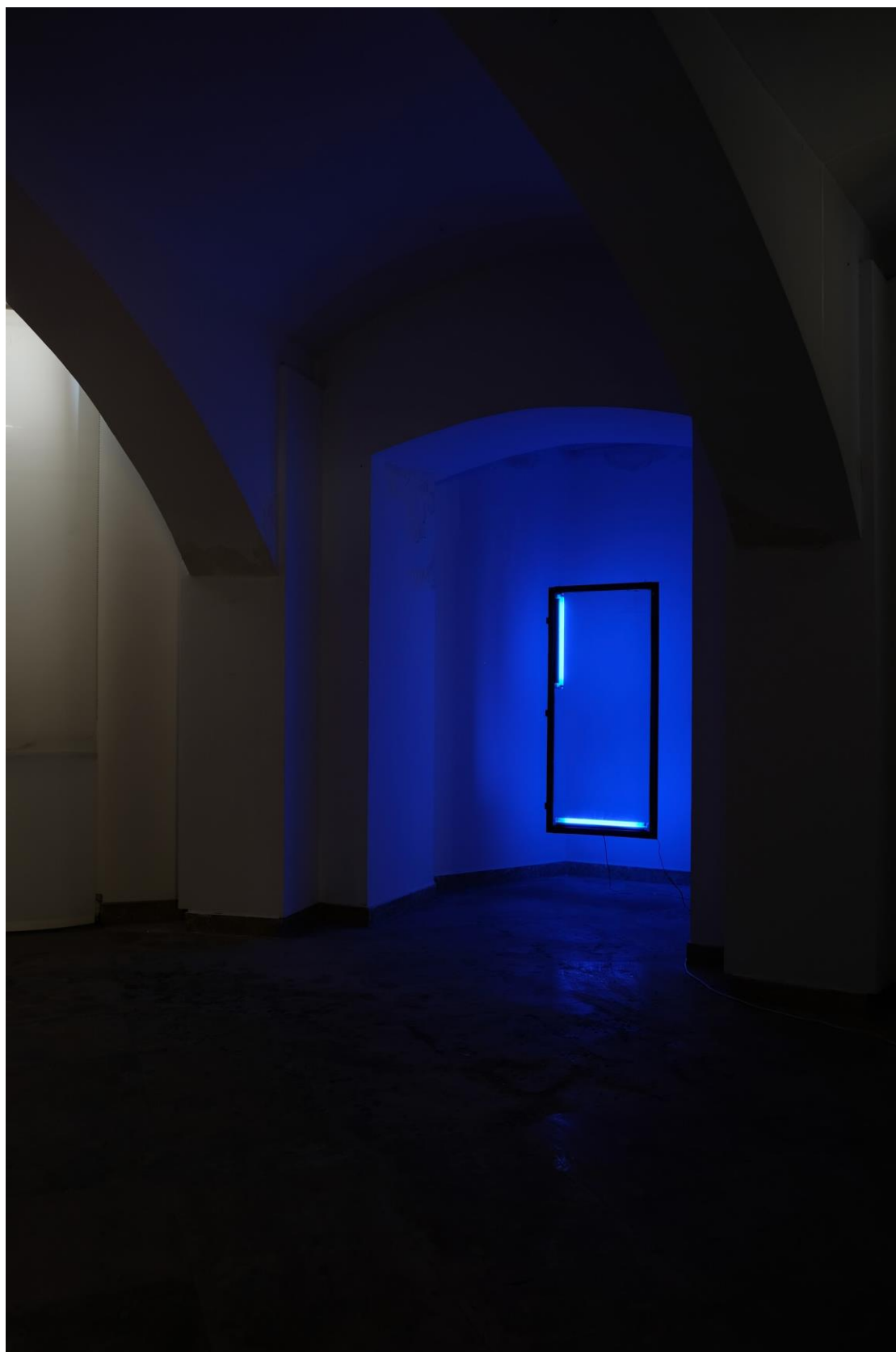
Slika 9 -plavetnilo- , 2019 Instalacija od prozora; 160 cm x 75 cm i dvije UV-fluorescentne cijevi; 60 cm