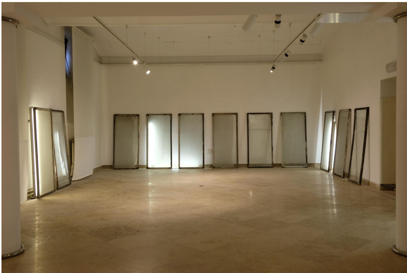
Slika 1 Soba s pogledom , 2019, detalj Instalacija promjenjivih dimenzija; 13 prozora; 160 cm x 75 cm, 3 neonske cijevi; 160 cm, 120 cm, 120 cm, 2 led cijevi, 120cm, 120 cm