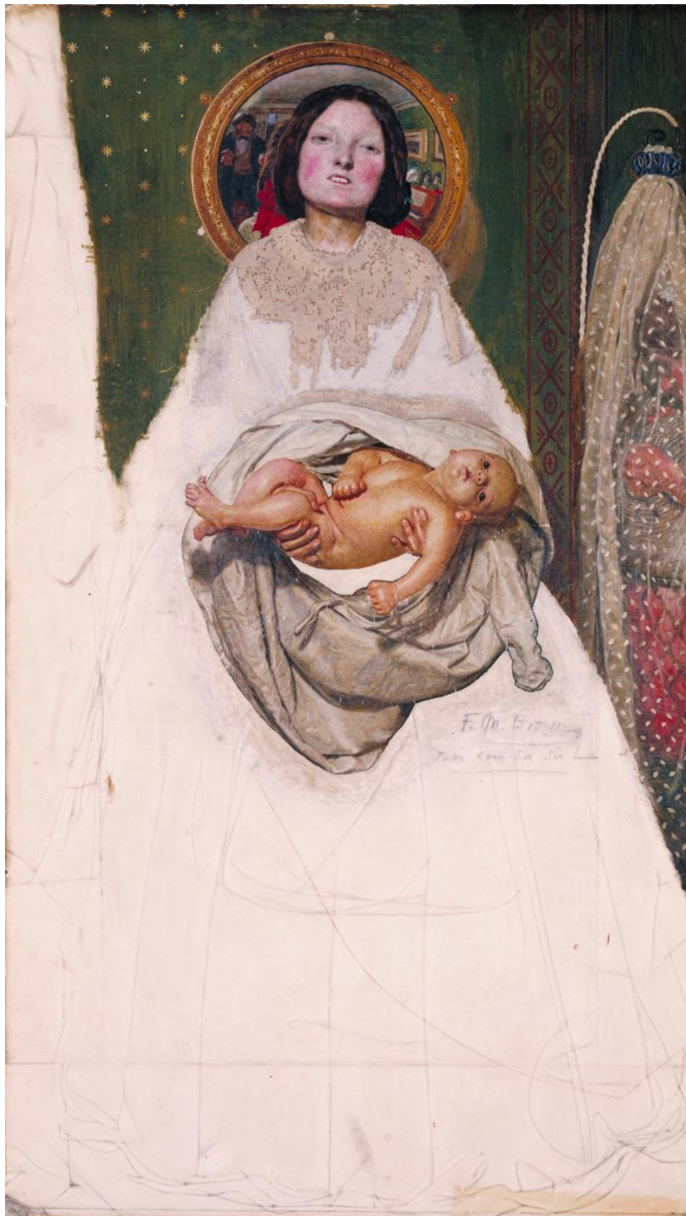
Ford Madox Brown, „Take your son Sir!” (1851.-1855.)

(Izvor: https://artsandculture.google.com )