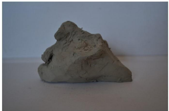
Autoportret, 2020., glina majolika