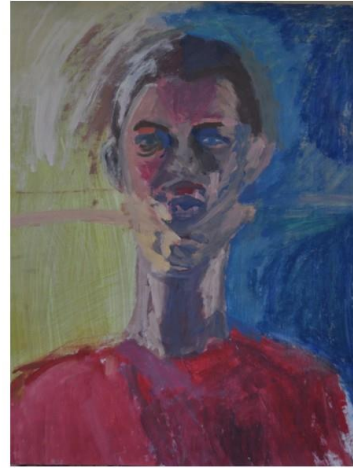
Autoportreti, 2019./2020., tempera, akril pastela na papiru