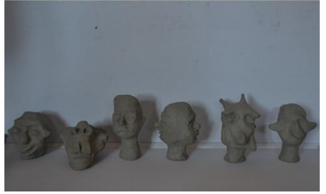
Autoportreti, 2020., glina majolika