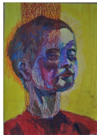
Autoportreti, 2019./2020., akril, tempera, pastela na papiru