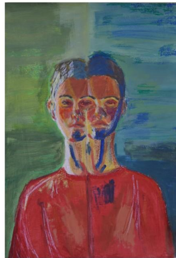
Autoportreti, 2019./2020., tempera, akril, pastela uljana i voštana na papiru