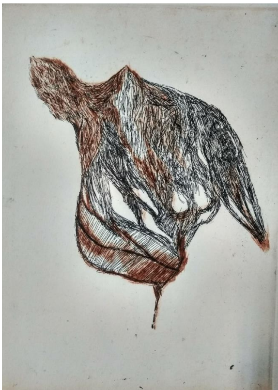
„ I.“, 2019./2020., bakropis i suha igla