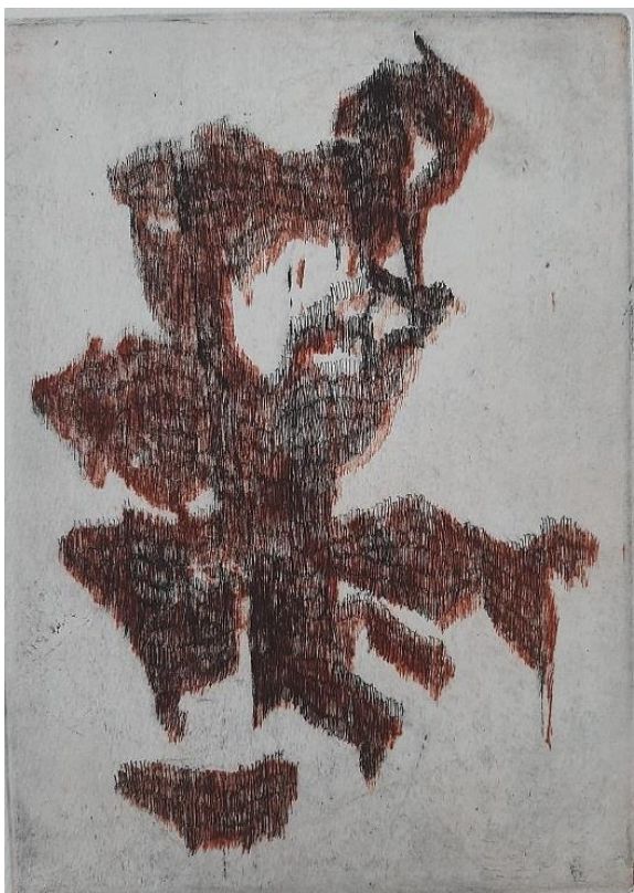
„III.“, 2019./2020., bakropis i suha igla