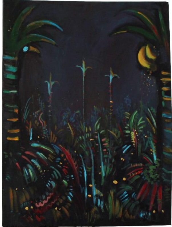
„Džungla“, diptih , 2020., akril na platnu