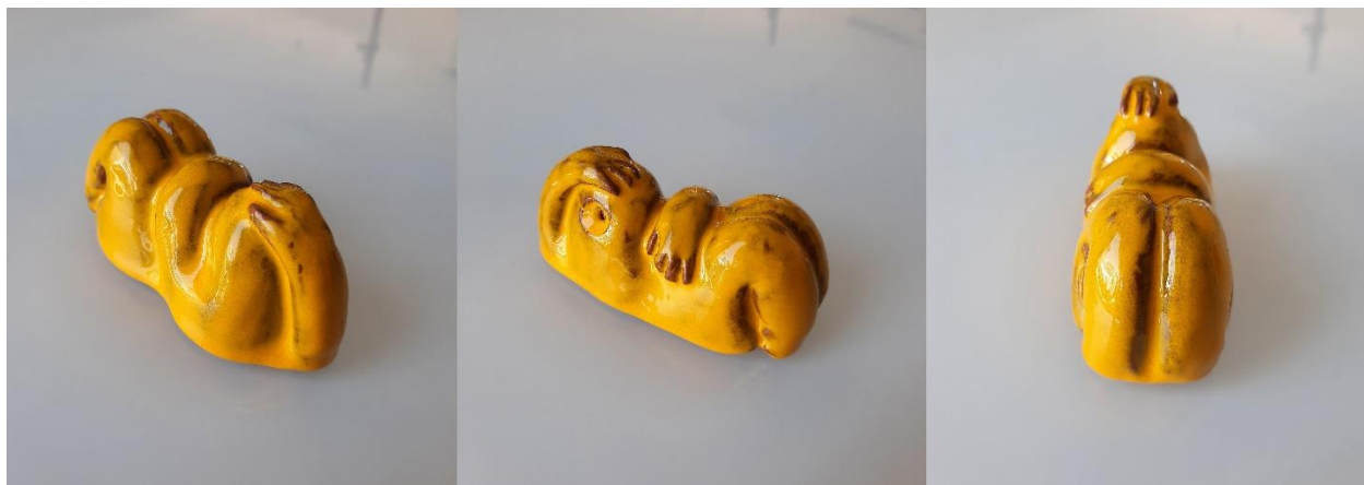
Ležeća figura na boku, 2020., glazirana keramika (crvena glina)