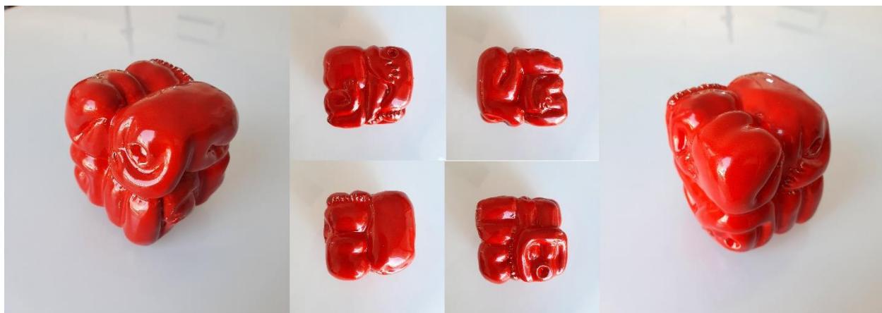
Kocka, 2020., glazirana keramika (bijela glina)