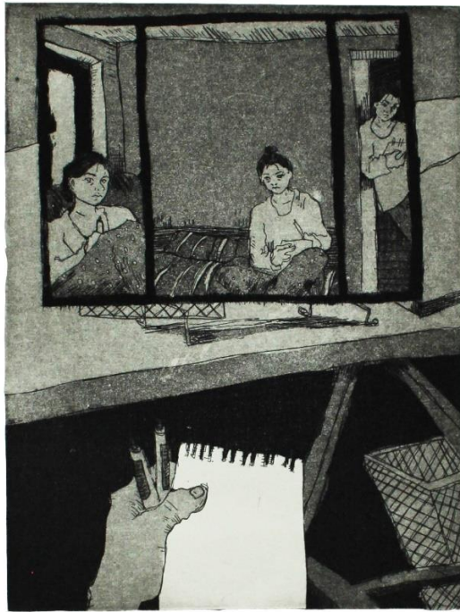
„Zapis iz karantene I“, 2020., akvatinta