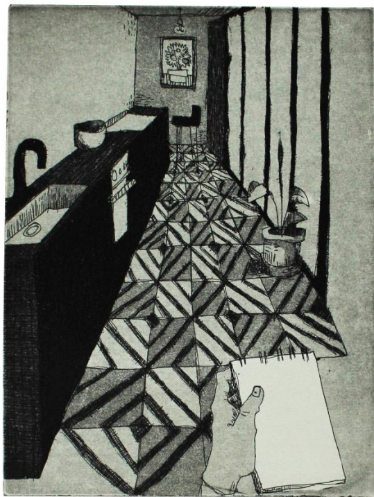
„Zapis iz karantene II“, 2020., akvatinta