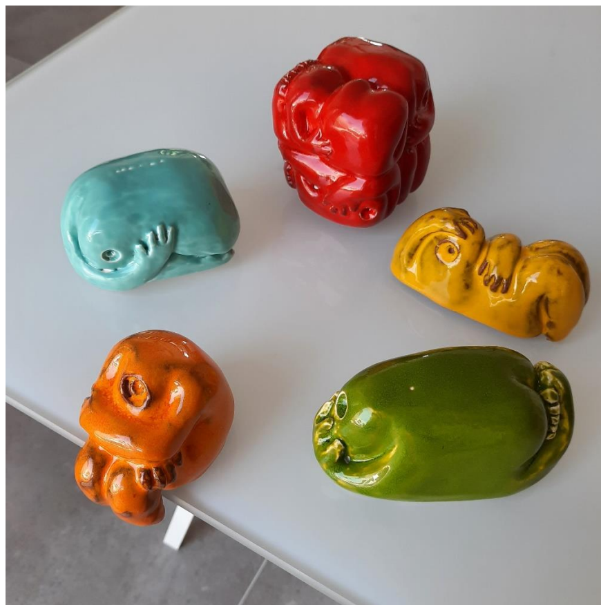
„Zatvoreno u zatvorenom“, 2020., glazirana keramika (bijela i crvena glina)