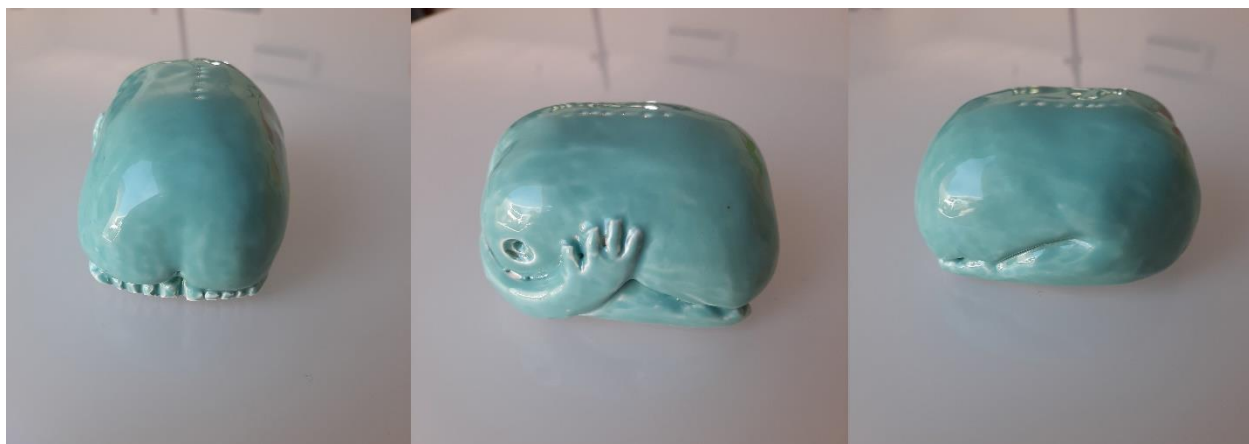
Klečeća figura, 2020., glazirana keramika (bijela glina)