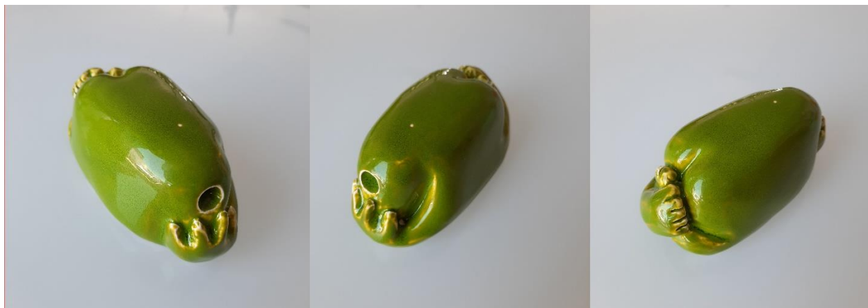
Ležeca figura na trbuhu, 2020., glazirana keramika (bijela glina)