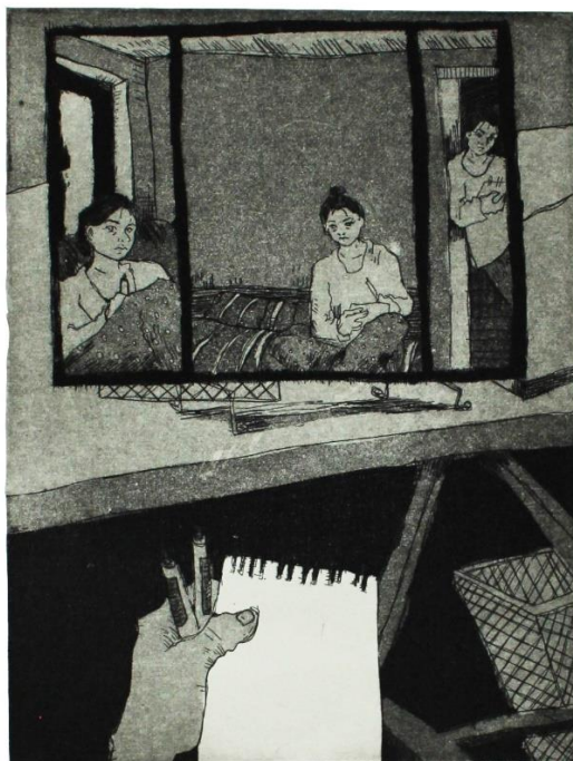
„Zapis iz karantene I“, 2020., akvatinta