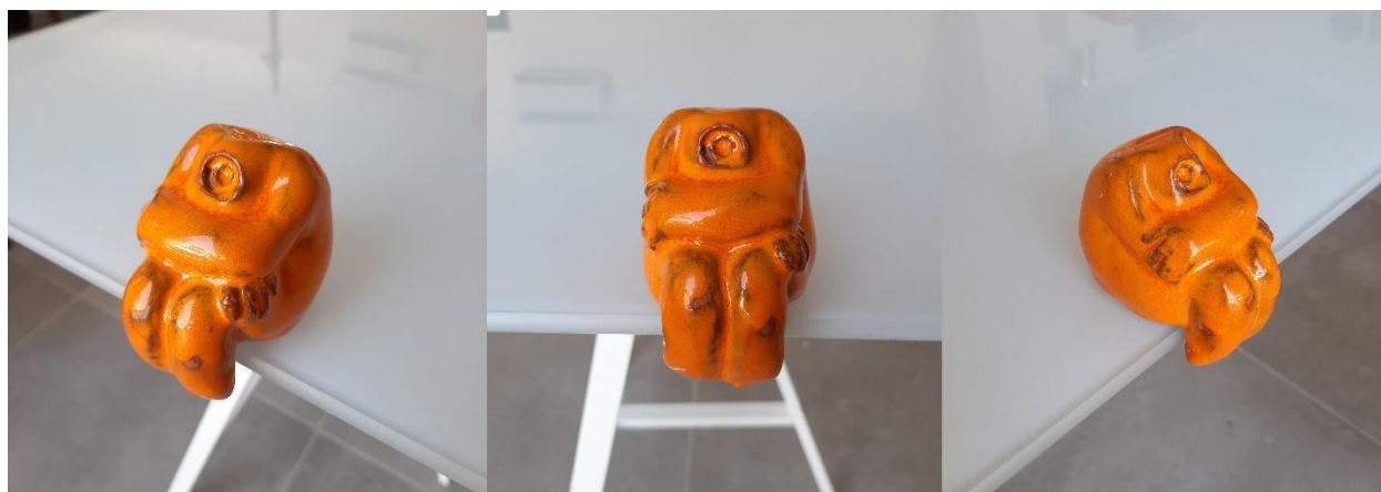
Sjedeća figura, 2020., glazirana keramika (crvena glina)