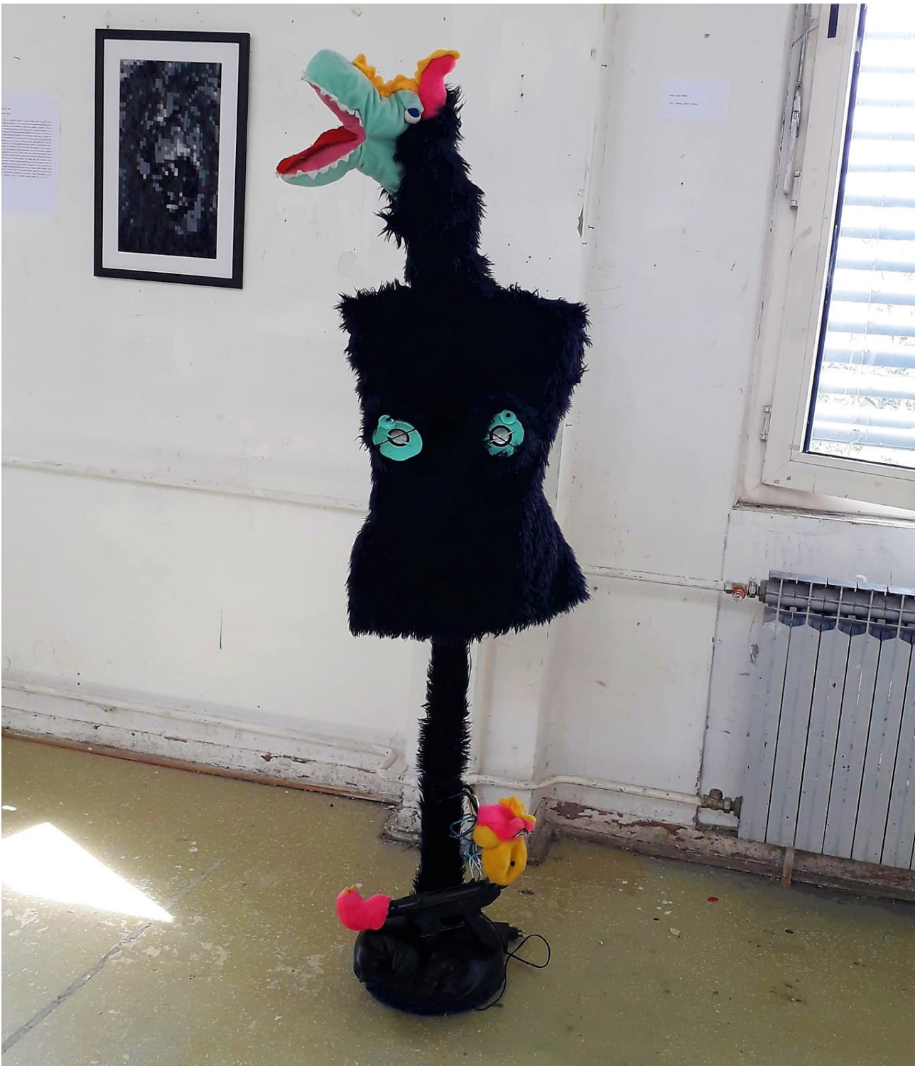
Stereo , 2020., tekstil, igračke, zvučnici