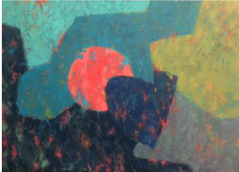
Slika 3. „Pomrčina“