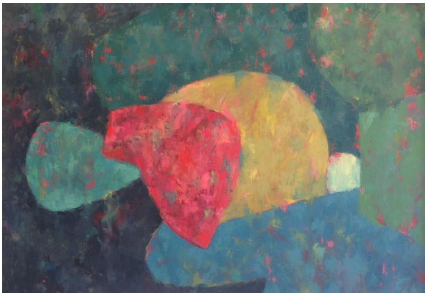
Slika 6. „Mjesecina“