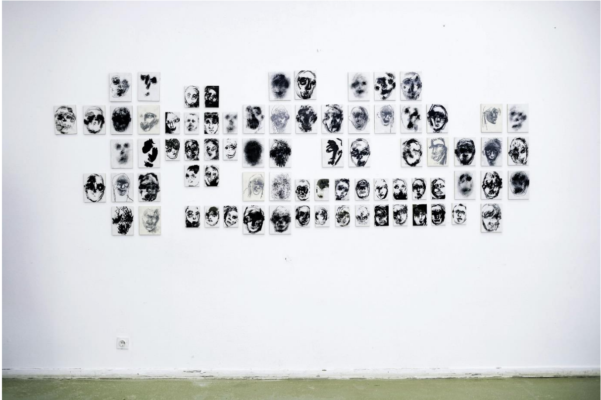
Lica, crteži u postavu