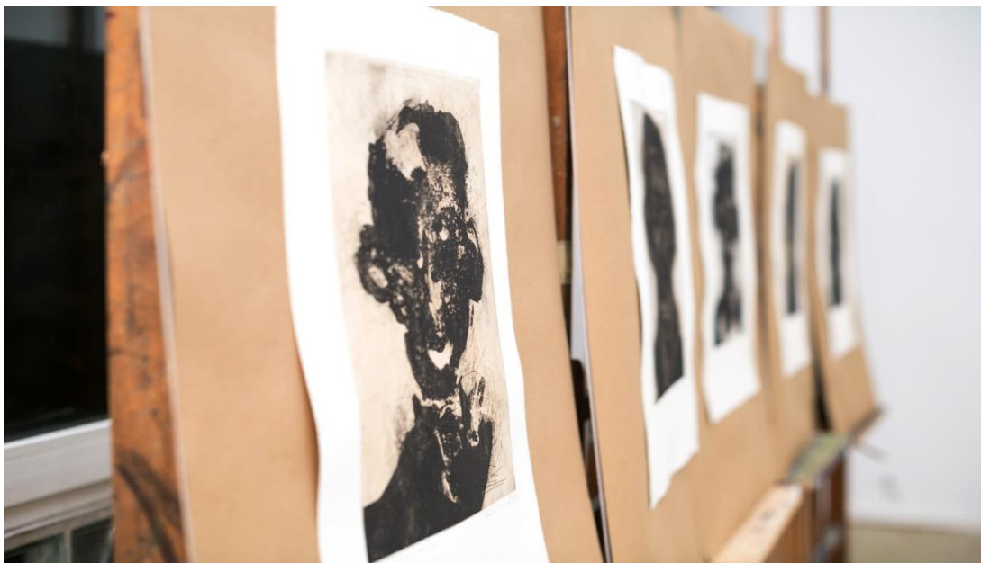
Lica, grafički listovi

Jedan od glavnih ciljeva za kojim sam stremila tijekom crtanja, a koji je i dalje bitna stavka u mojoj umjetničkoj ekspresiji jest izbjegavanje slikovitosti, dopadljivosti, to jest „svidanja“, ljepote i stereotipnog prikazivanja učestalog motiva u mom likovnom izražavanju. U mom odabiru motiva, crtanje u tušu ima svoje prednosti i mane, ukoliko ih se tako tumači. Tuš je jasan, čvrst, neponištiv. Ono što je napravljeno, napravljeno je, ne dozvoljava popravke i izmjene što mi u ovom slučaju i odgovara jer, kao što sam već navela, crteži predstavljaju moje bilješke, zapažanja i interpretaciju istih.