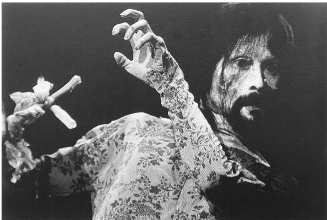
Tatsumi Hijikata u izvedbi Butoh plesa

Osim na klasičnu japansku umjetnost, u svom radu referirala bih se i na Butoh. Butoh 5 , kao jedna od forma japanskoga suvremenoga plesa u sebi nosi obilježja groteske i razigranosti, a prikazuje često ekstremno i apsurdno okruženje ili ambijent koji utječe na tjelesno izražavanje umjetnika - plesača. Butoh je teško definirati, no ukratko, naglasak je na emociji koju plesač prenosi publici svojim sporim i kontroliranim mikropokretima. Povezanost između ovoga plesa i svoga rada vidim ne samo u grotesknom izgledu i izvedbi samoga plesa, već i u samoj zadaći istoga, a to je prijenos iskonske ekspresije i emocije, a ne fizičke ljepote. Ples, ali i tijelo kao „instrument“ koji dočarava plesne pokrete, odraz su bolesti, osakaćenosti te produkt okoline i vremena u kojemu nastaju.