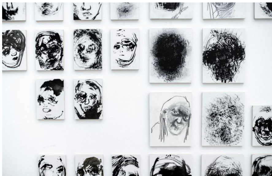
Lica, detalji crteža

Upravo prethodno navedeni fenomen emocionalne uključenosti i suodnos s okolinom navodi na zaključak da je upravo okolina ključni čimbenik koji nas uvjetuje, određuje i oblikuje kao cjelinu. Stvaranjem, nametanjem te naposljetku i prihvaćanjem izvrsnih društvenih vrijednosti i normi, prilagodbe radi, prisiljeni smo pretvarati se i zavaravati druge, a često i sebe same. Živimo da udovoljimo, da ispunimo kriterije kako bi se osjećali "korisno". Slijepim prihvaćanjem takvih pravila upućenih od strane okoline u koju smo duboko umreženi, bježimo u virtualne svjetove koji omogućuju stvaranje novoga identiteta, novoga života, uloga koje priželjkujemo i preuzimanje novog lica koje nam daje samo trenutno zadovoljstvo. No, u stvarnom svijetu, unatoč pretvaranju i suzbijanju istinskih želja, nije moguće u potpunosti negirati i zatomiti stvarne emocije s kojima se suočavamo, a koje kao rezultat potiskivanja toga izviru na površinu i to vrlo često u neprirodnom, ekstremnom i destruktivnom obliku.