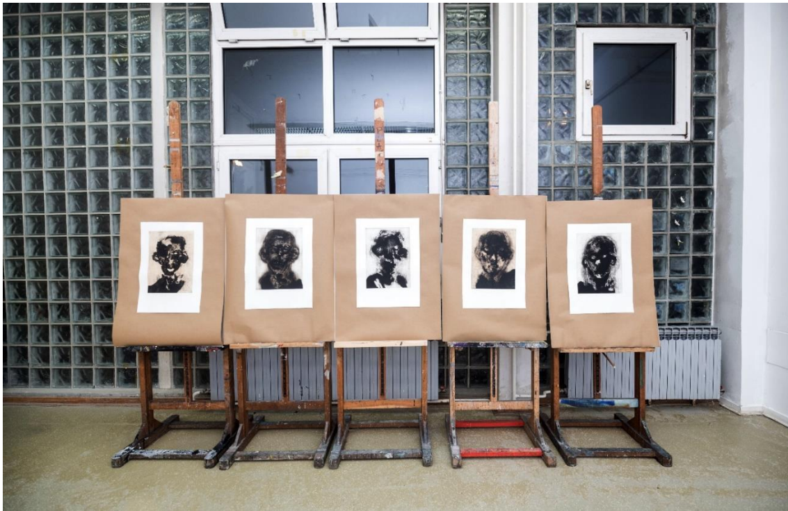
Lica, grafički listovi u postavu

Jedan od glavnih ciljeva za kojim sam stremila tijekom crtanja, a koji je i dalje bitna stavka u mojoj umjetničkoj ekspresiji jest izbjegavanje slikovitosti, dopadljivosti, to jest „svidanja“, ljepote i stereotipnog prikazivanja učestalog motiva u mom likovnom izražavanju. U mom odabiru motiva, crtanje u tušu ima svoje prednosti i mane, ukoliko ih se tako tumači. Tuš je jasan, čvrst, neponištiv. Ono što je napravljeno, napravljeno je, ne dozvoljava popravke i izmjene što mi u ovom slučaju i odgovara jer, kao što sam već navela, crteži predstavljaju moje bilješke, zapažanja i interpretaciju istih.