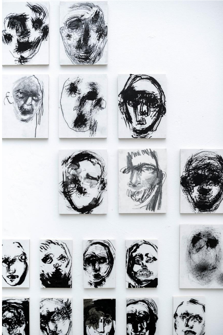
Lica, detalji crteža