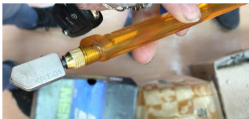
Alat korišten za rezanje

Staklo je pronađeno u okolici Samobora, u jednoj od mnogih šuma sa istim problemom neadekvatnog odlaganja otpada. Nakon detaljnog čišćenja nastupilo je rezanje rubova koji će kasnije biti uleknuti i slijepljeni u drvo. U svakom dijelu su rezani samo rubovi koji su na drvenoj dasci odnosno postolju. Svi drugi rubovi su zadržali svoju prirodnu formu u kojoj su bili nađeni u prirodi.