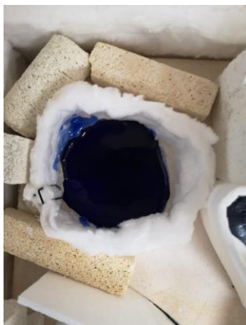
izgled rastaljenog stakla za medalju, keramička vuna

Staklo sam ljepila UV ljepilom. UV ljepilo koristi se za lijepljenje metala ili kamena na staklo. Postiže spoj vrlo velike čvrstoće te je najčešće proziran. Aktivira se UV lampom ili UV aktivatorom i otporno je na temperaturu od -40^{\circ}\text{C} do 140^{\circ}\text{C} . Reagira kao među sloj, odnosno pod UV svjetlom reagira na način da se napuhne između dva materijala i stvara neku vrstu pritiska. Taj proces je golom oku nevidljiv, ali pri pomaku dva materijala prije nego što je ljepilo imalo vremena aktivirati se do kraja, rezultira neadekvatnim spojem. UV ljepilo ima mogućnost stvrdnjavanja samo kroz prozirne materijale.