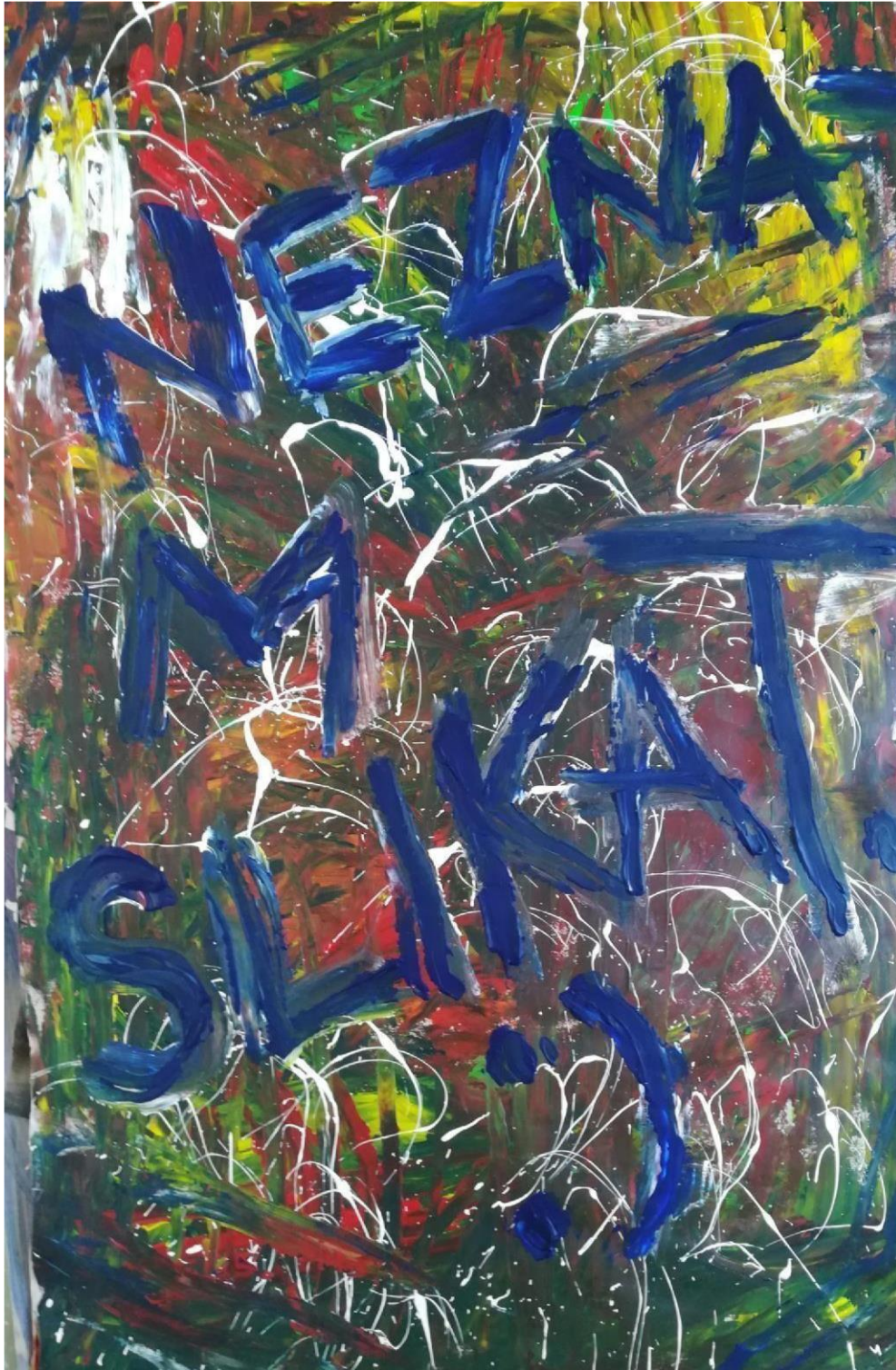
Art Block , 2021., tempera i akril na pak papiru