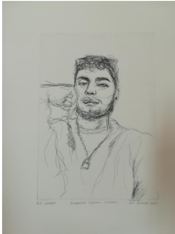
Bakropis, 210 x 297 mm