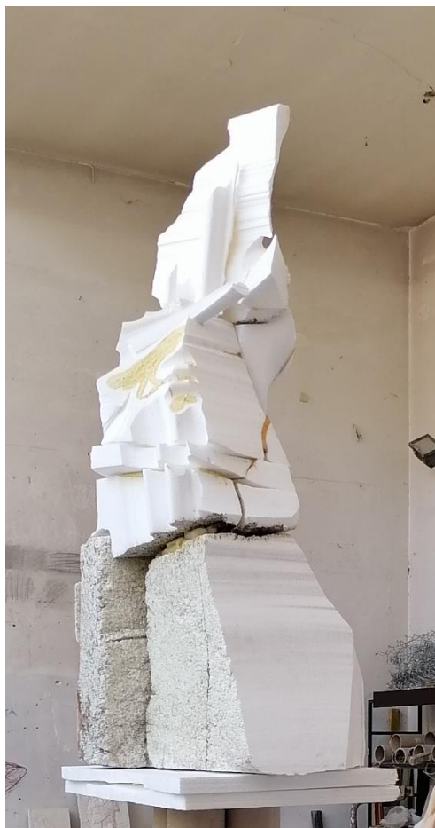
Skulptura I.(2021.,stiropor i purpen)