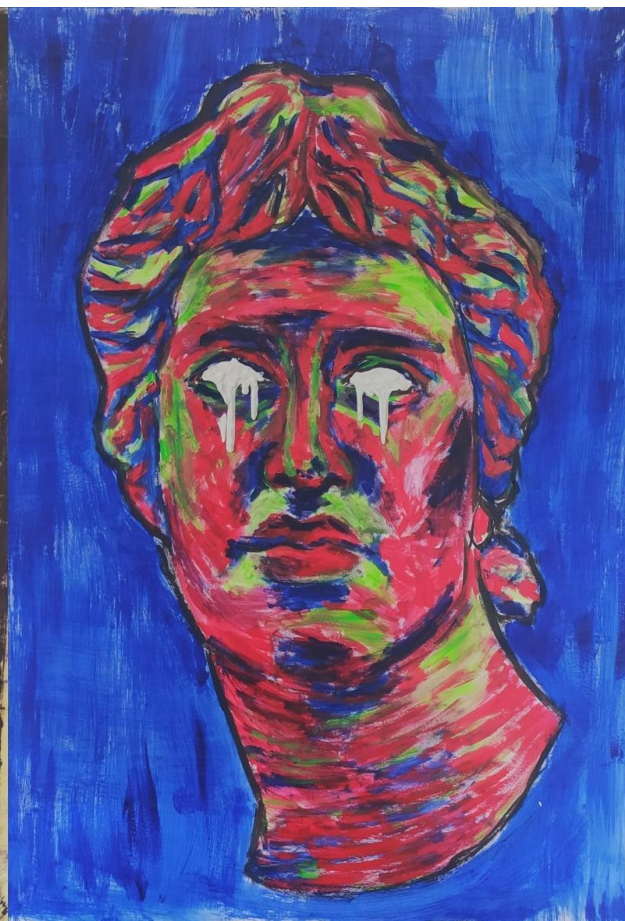
Glava 4, 2021., akril na papiru, 183 x 143 cm