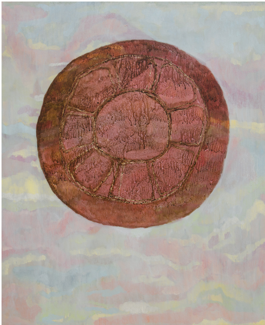
Abnegacija 1 100 × 81 cm akrilik, platno 2019.