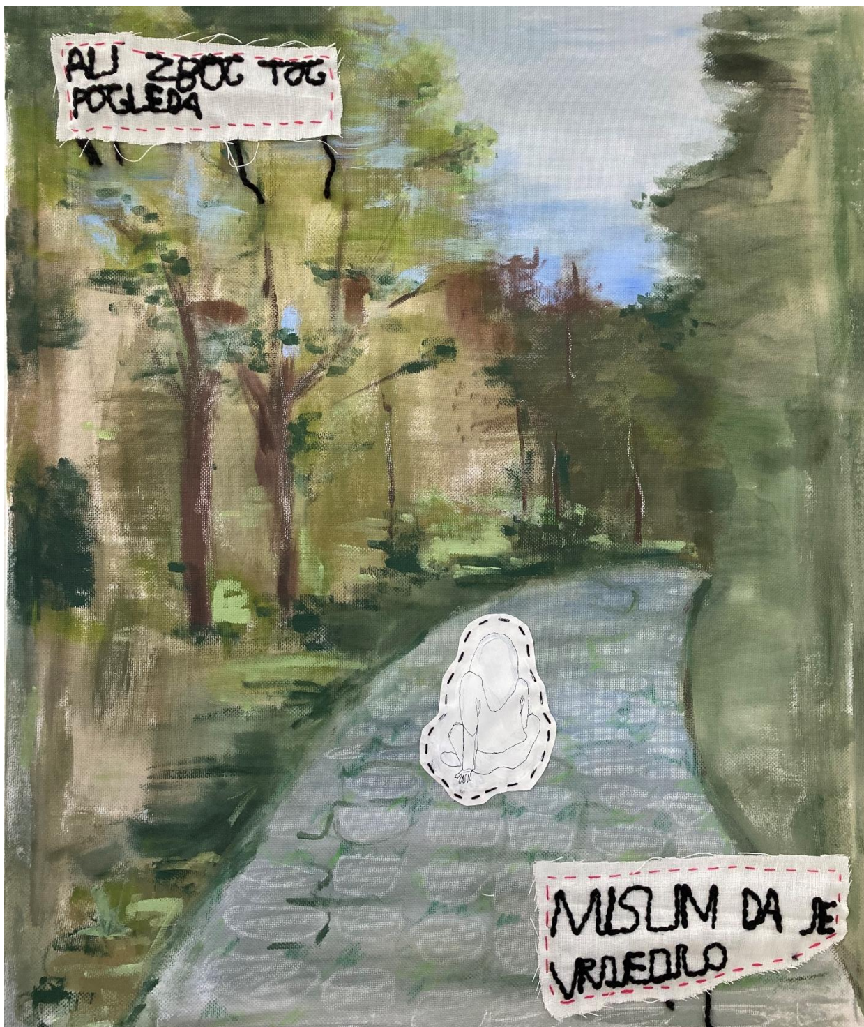
Strip „Kad se vraćam s faksa“ 2021., konac, papir, tkanina, akril, pastele na platnu, 100x90 cm