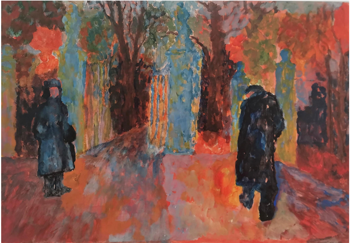
Baka i dida , akril na papiru, 50 x 40