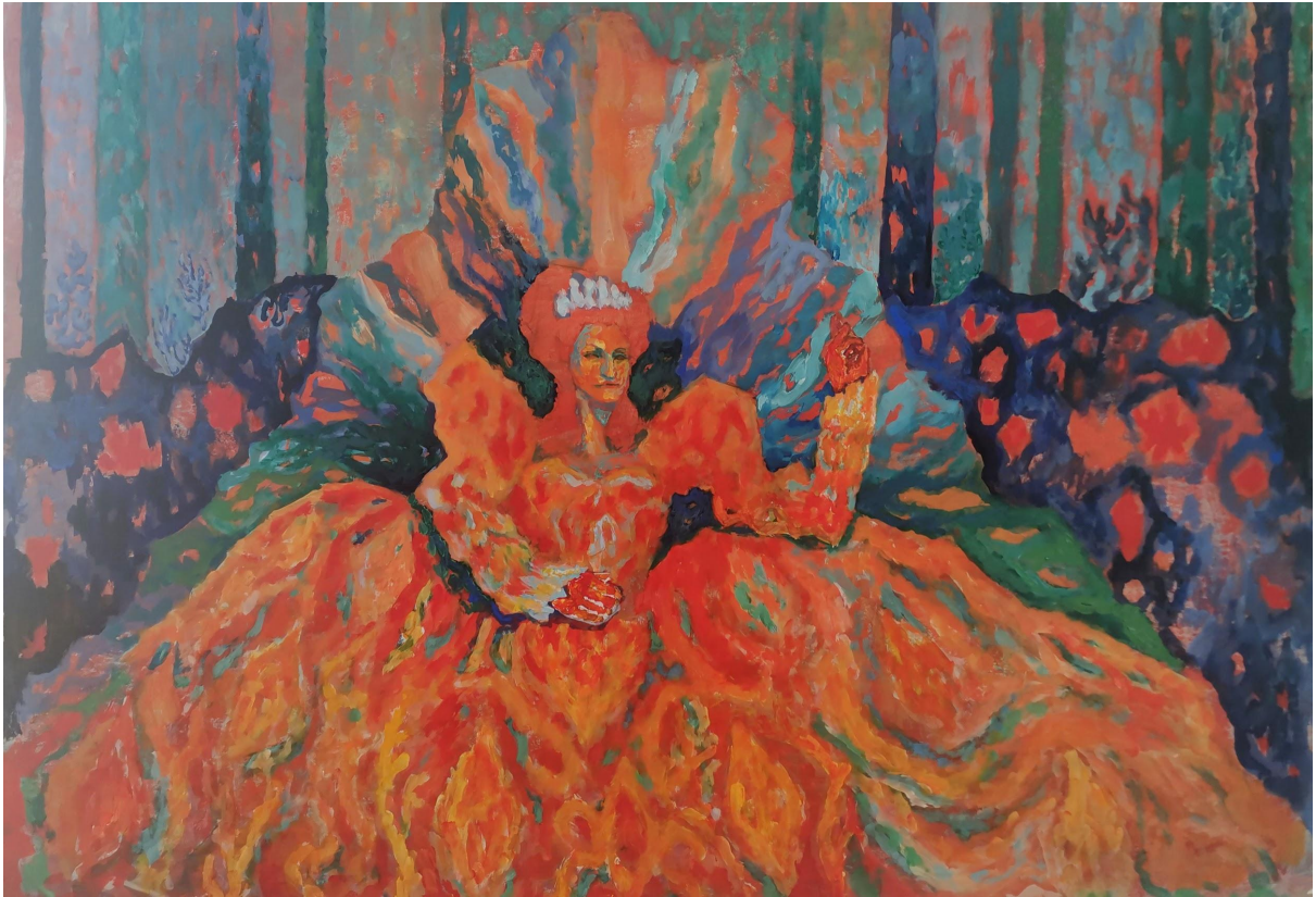
Zla kraljica , akril na papiru, 150 x 100