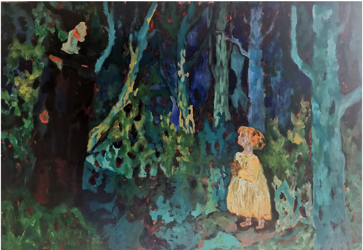
Zlurada i beštija , akril na papiru, 110 x 70