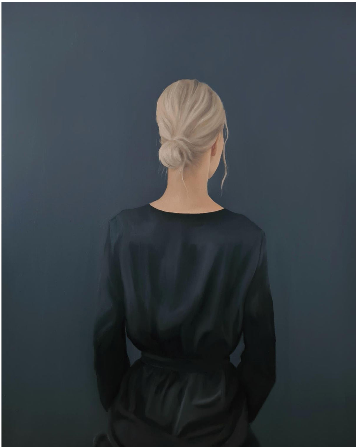
I, Turning point , 2021 ulje na platnu, 100x80 cm