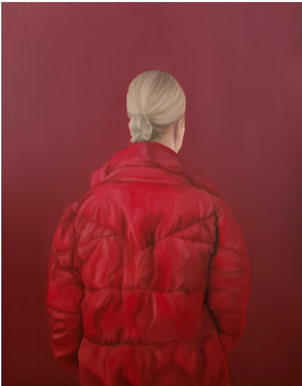
VIII, Turning point , 2021 ulje na platnu, 100x80 cm