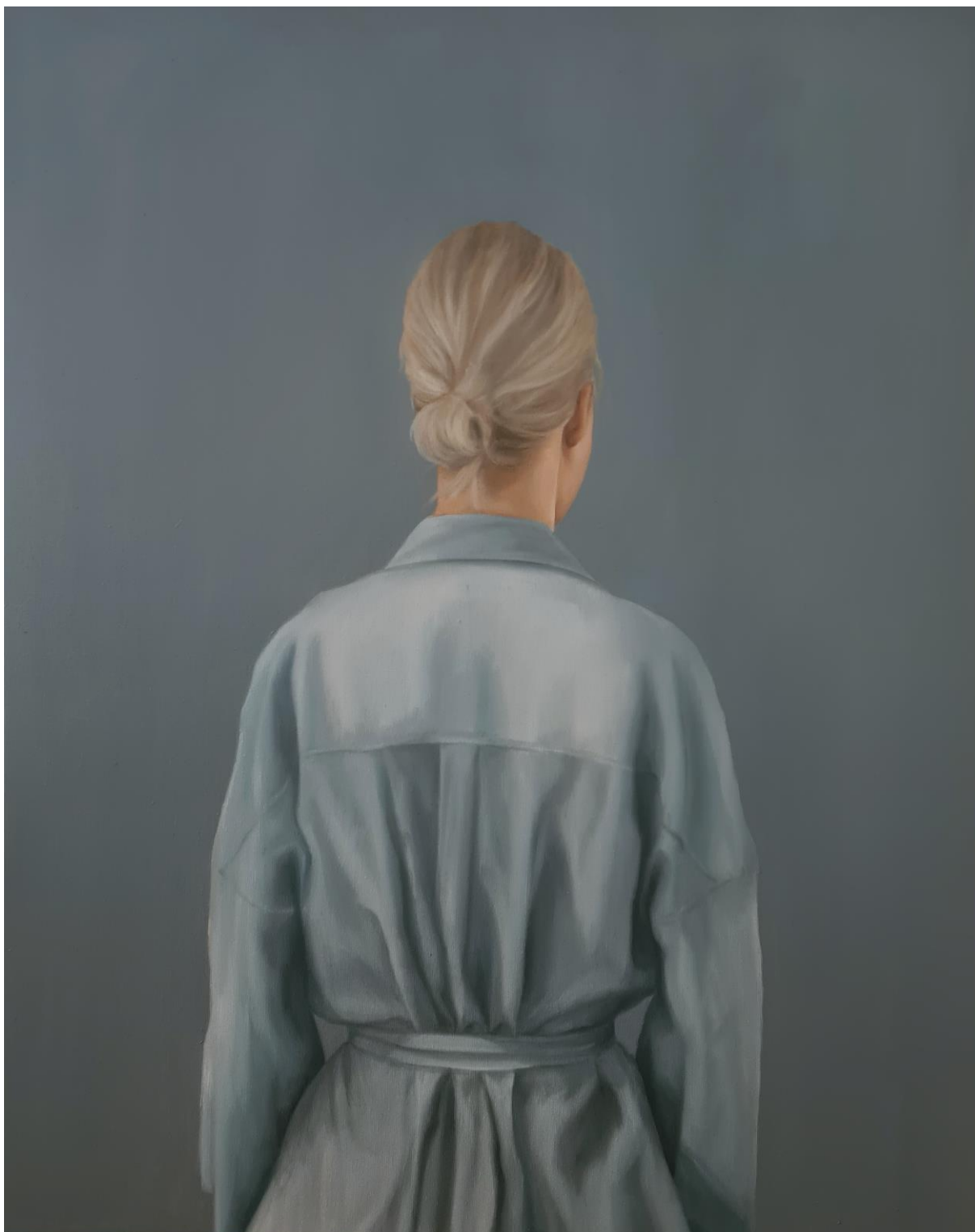
II, Turning point , 2021 ulje na platnu, 100x80 cm