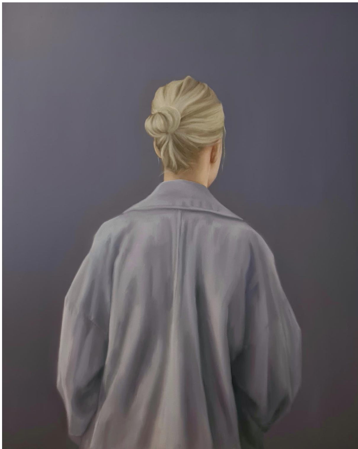
V, Turning point , 2021 ulje na platnu, 100x80 cm