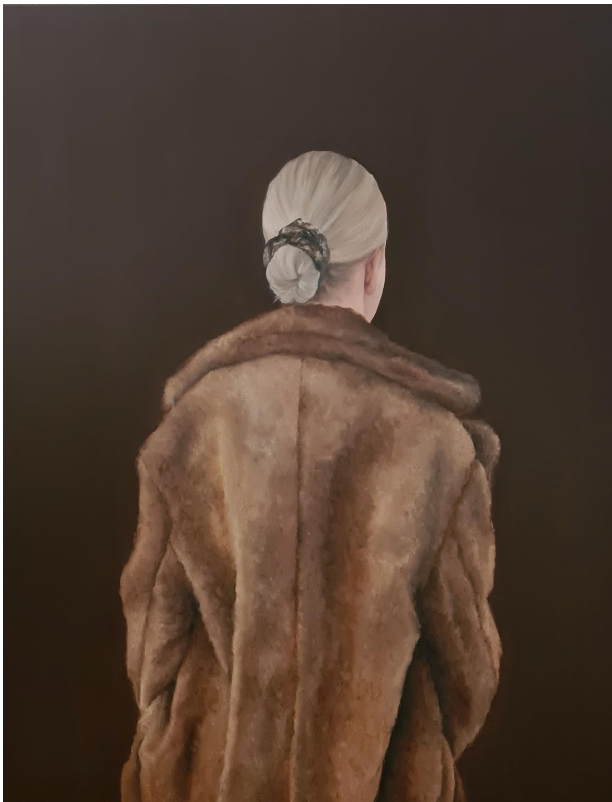
VI, Turning point , 2021 ulje na platnu, 100x80 cm