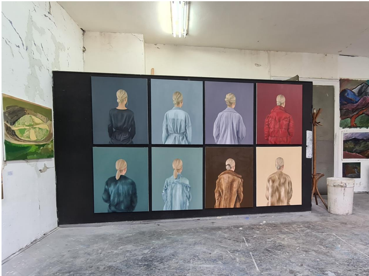
Ciklus radova "Turning point" u sklopu završne izložbe ALU perspektiva 2021