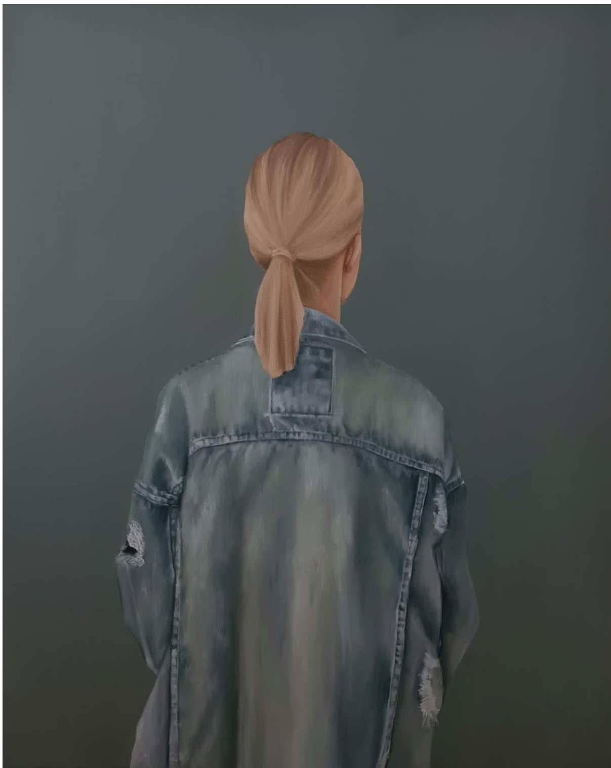
IV, Turning point , 2021 ulje na platnu, 100x80 cm