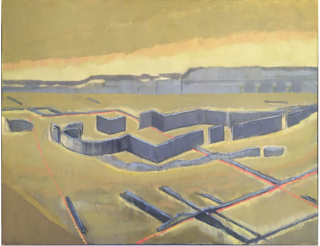
“Rimska ruševina” - 180 x 140cm, ulje na platnu.