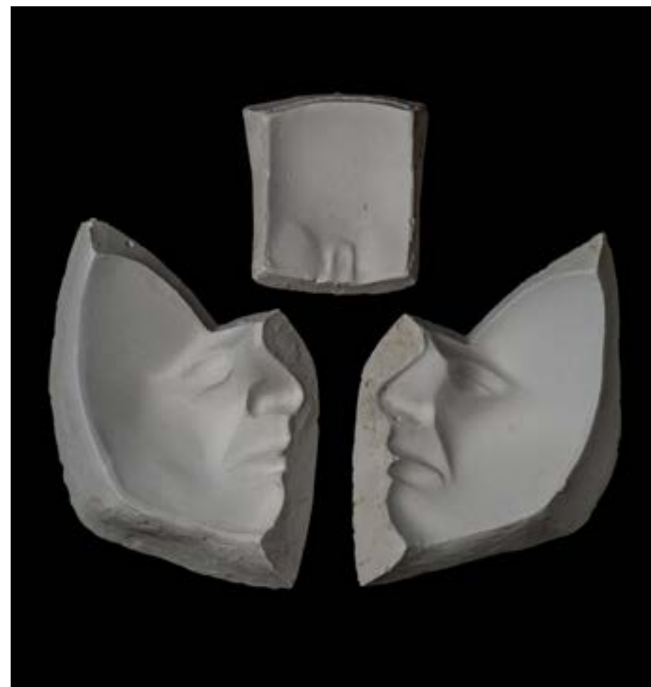
- sadreni kalup za višestruko lijevanje - tuga