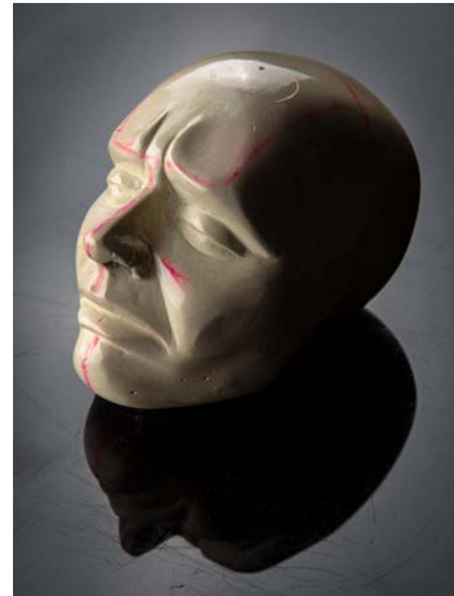
- sadreni modul - tuga