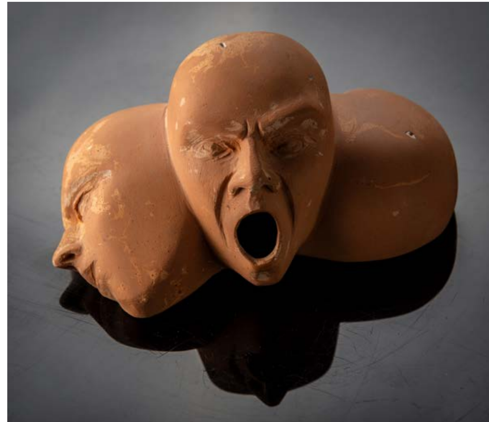
-Skica S.T.S., terakota