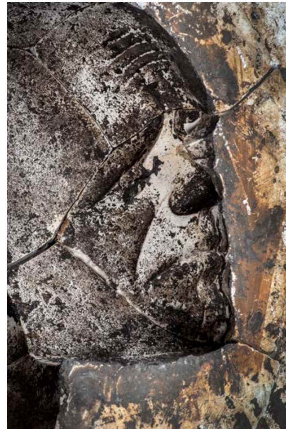
- kalup za višestruko lijevanje - S.T.S. - detalj