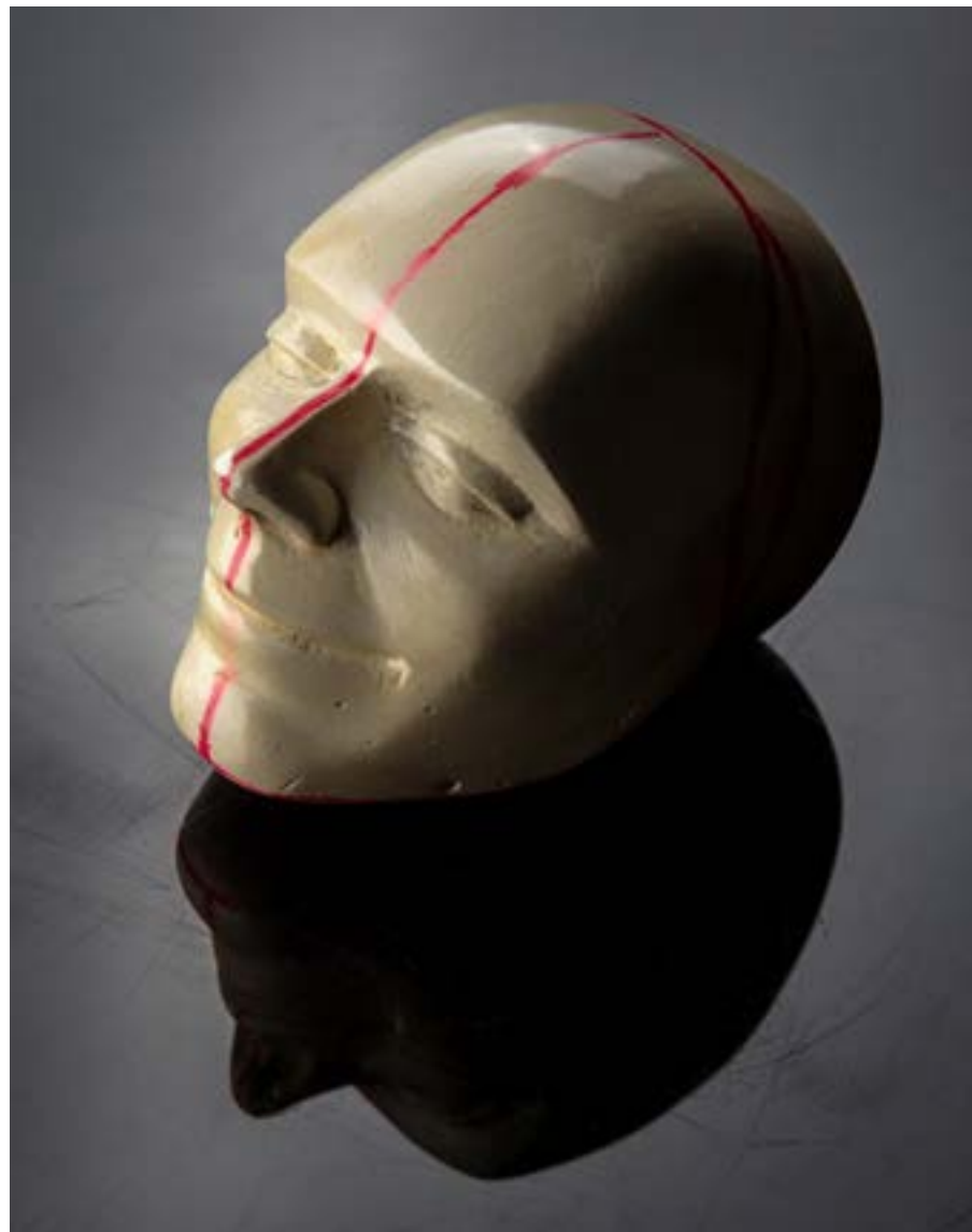
- sadreni modul - sreća

Kroz vođenje dnevnika emocija dobio sam inspiraciju za prvi rad. Izmodelirao sam glave od plastelina od kojeg sam napravio sadreni negativ te zatim pozitiv. Zaključio sam da bi kao završni materijal modula htio koristiti porculan, za koji sam napravio višedijelne kalupe za lijevanje gline. Tako samo dobio četiri kalupa u koja sam mogao simultano lijevati glinu. Nakon vađenja odlijeva iz kalupa iste je trebalo retuširati, posušiti te zatim ispeći.