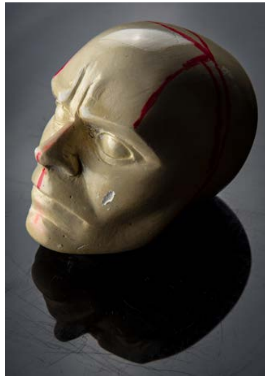
- sadreni modul - bijes