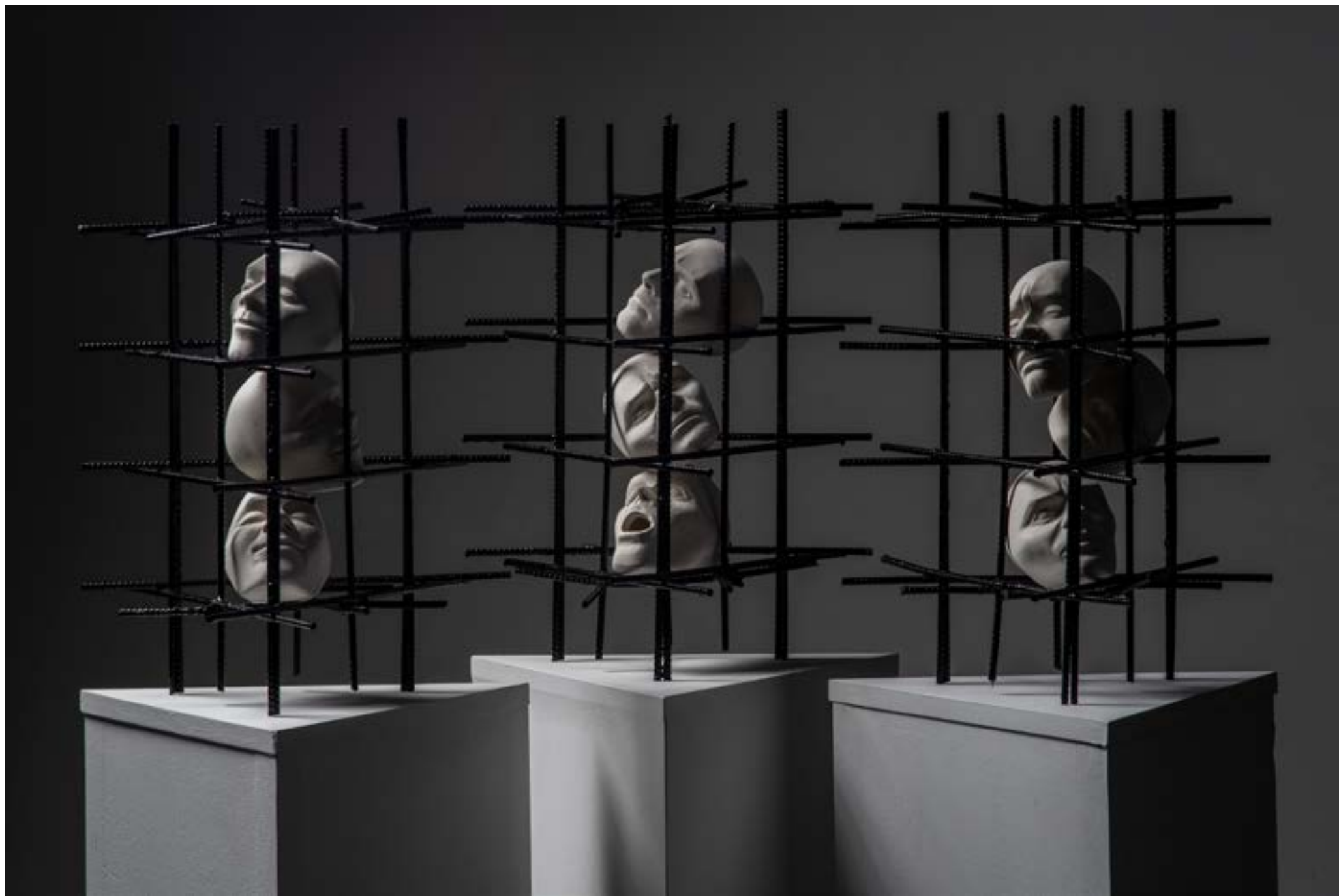
- "3." - porculan i željezo