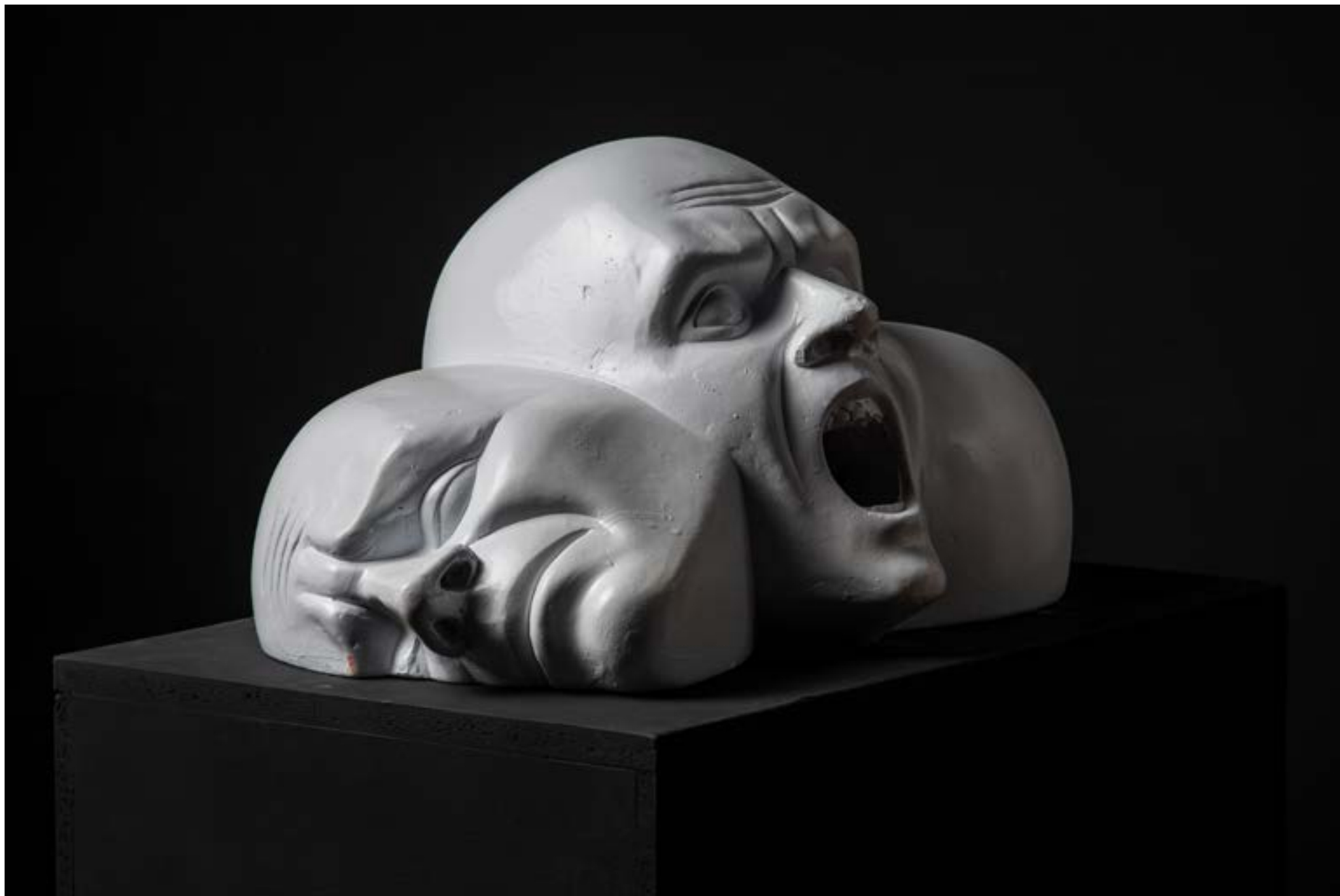
- "S.T.S. 1" - lakirana sadra