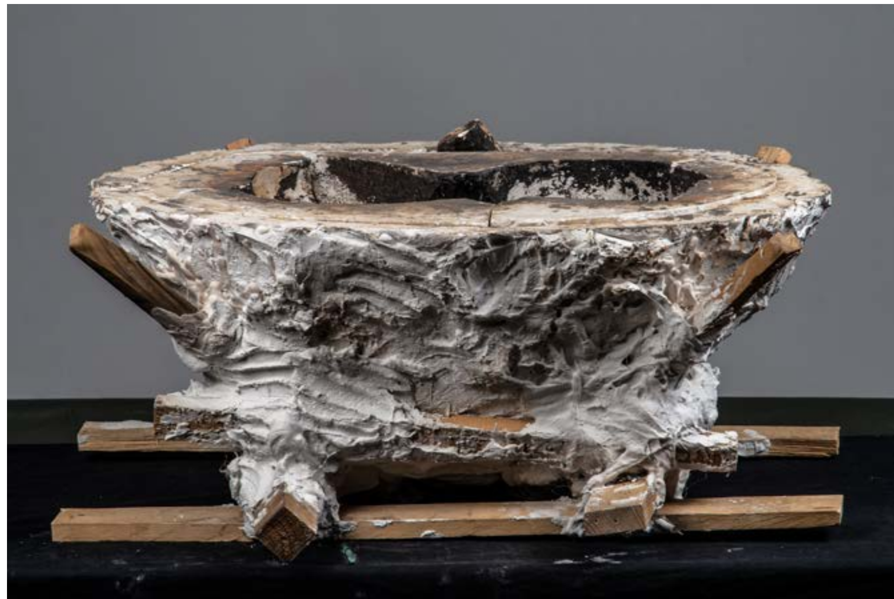
- kalup za višestruko lijevanje - S.T.S.

Gipsani pozitiv sam zatim podijelio na petnaest dijelova koji omogućavaju razdvajanje kako bi se u kalup glina mogla utisnuti i izvaditi bez uništavanja kalupa. Kalup također omogućuje višestruko lijevanje. Za izradu drugog pozitivna odlučio sam koristiti crni beton kako bi bojom i teksturom bio u kontrastu s gipsanim pozitivom. Također teksturom sugerira raspadanje koje se dešava kada se ne nosimo s ovim problemom.