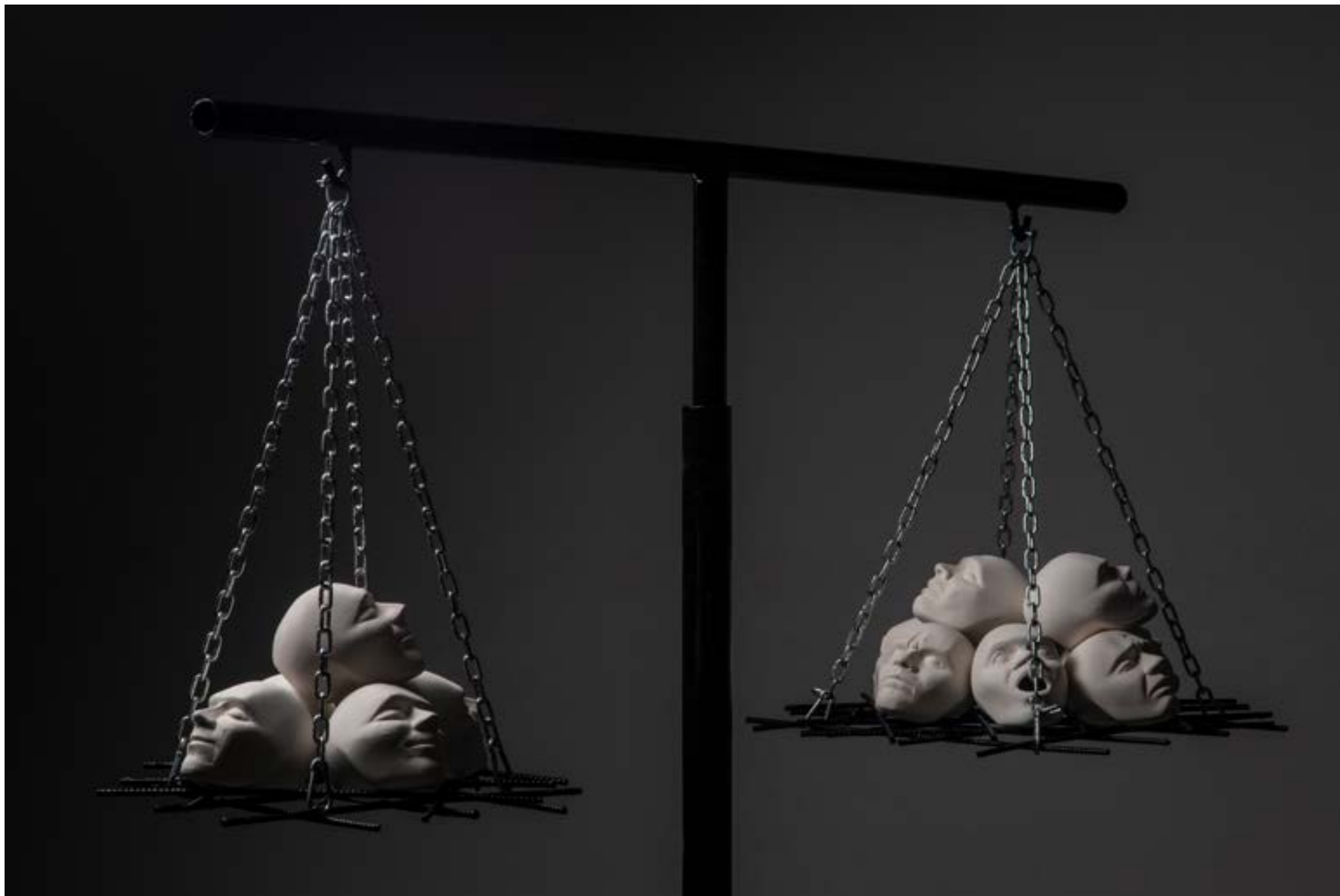
- "2." - porculan i željezo