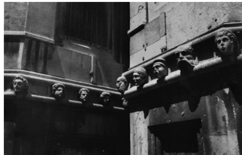
- Katedrala sv. Jakova u Šibeniku