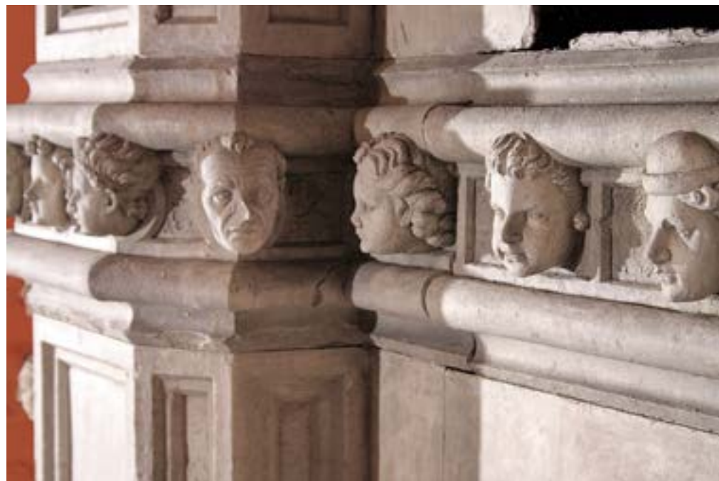
-sadreni odljevi Katedrale sv. Jakova u Gliptoteci Hazu

Srednjovjekovni, gotički i renesansni arhitektonski elementi, ukrašeni skulpturama, iz povijesne zbirke Gliptoteke su me također zainteresirali. Posebice odljevi s Katedrale sv. Jakova u Šibeniku sa svojih nizom od 71 isklesane glave, od kojih je 40 djelo Jurja Dalmatinca, dok su ostale radovi njegovih suradnika. 11 Ova kompozicija dala mi je inspiraciju za formiranje instalacija nizanjem modula glava. S time na umu započeo sam crtati i modelirati kako bi pronašao motive kroz koje bi mogao predočiti opširnost i kompleksnost ove teme. Kroz igru oblika pronašao sam prvo rješenje koje će postati vodilja za ostale radove.