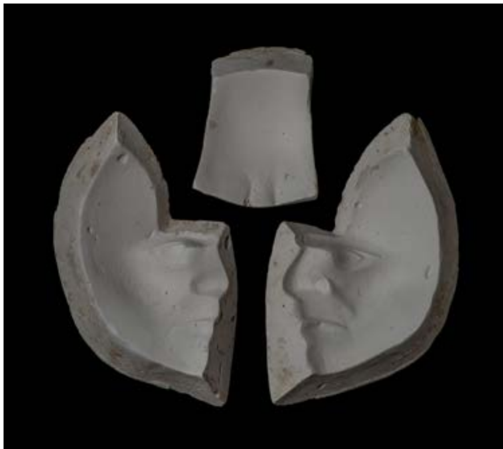
- sadreni kalup za višestruko lijevanje - bijes