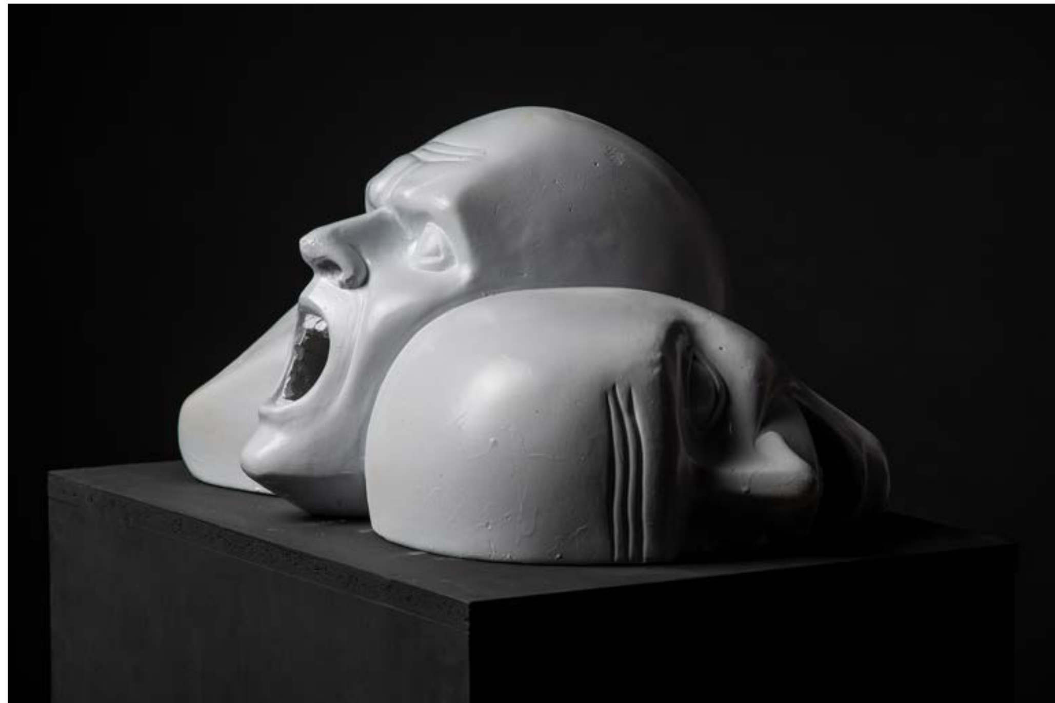
- "S.T.S. 1" - lakirana sadra