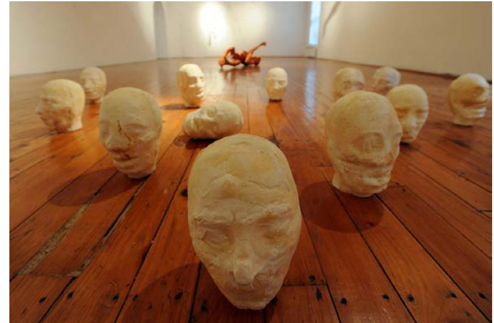
-skulpture Stjepana Gračana u Gliptoteci, fotografirao Davor Kovačević.

Radovi Stjepana Gračana, njegove poliuretanske svinje i bebe, izrađene u velikim brojevima koristeći jedan kalup inspirirao me da i sam upotrijebim sličan modularni pristup s mogućnosti multipliciranja.