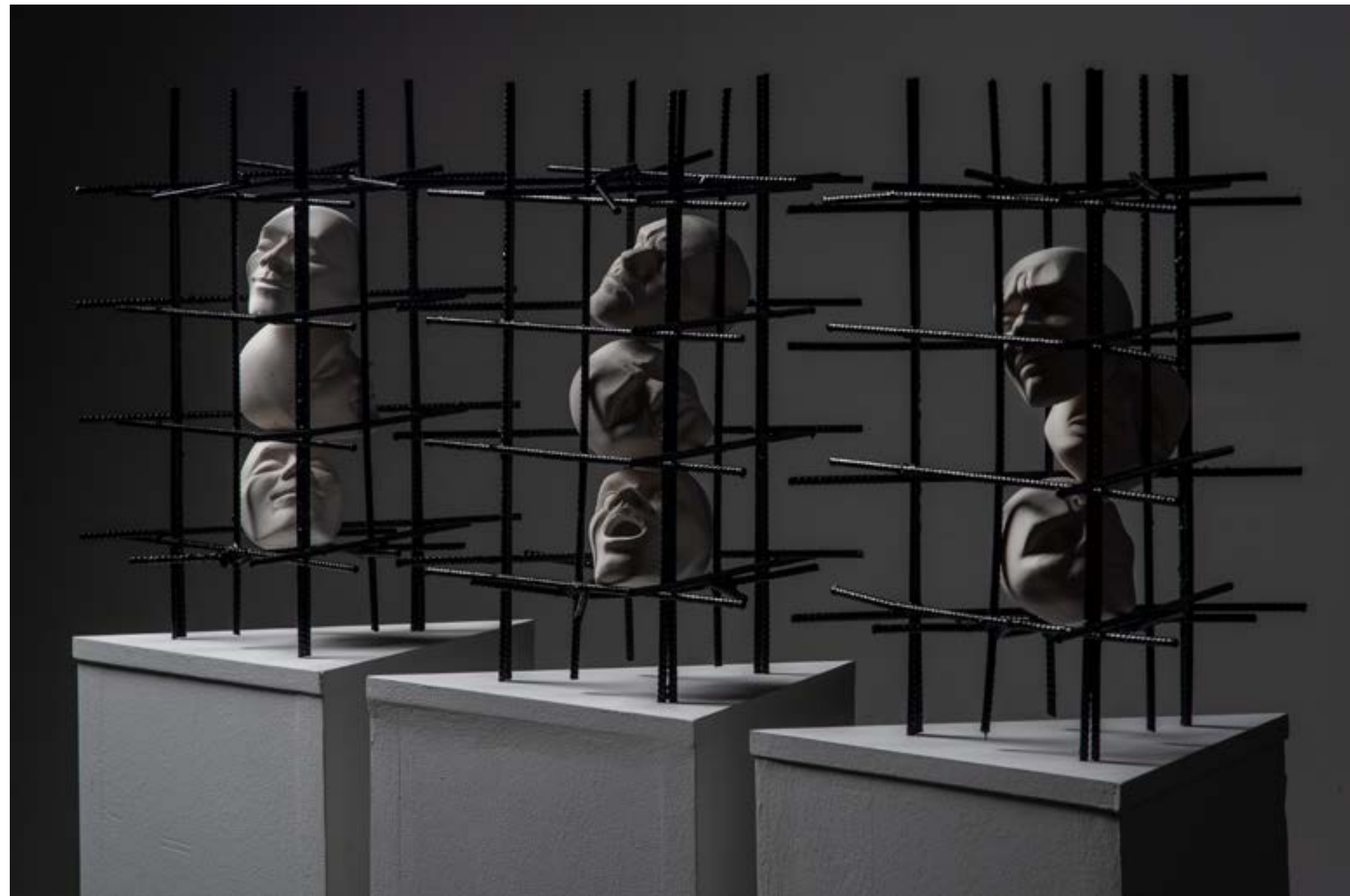
- "3." - porculan i željezo