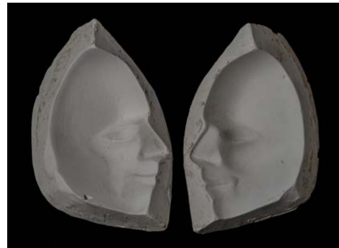
- sadreni kalup za višestruko lijevanje - sreća