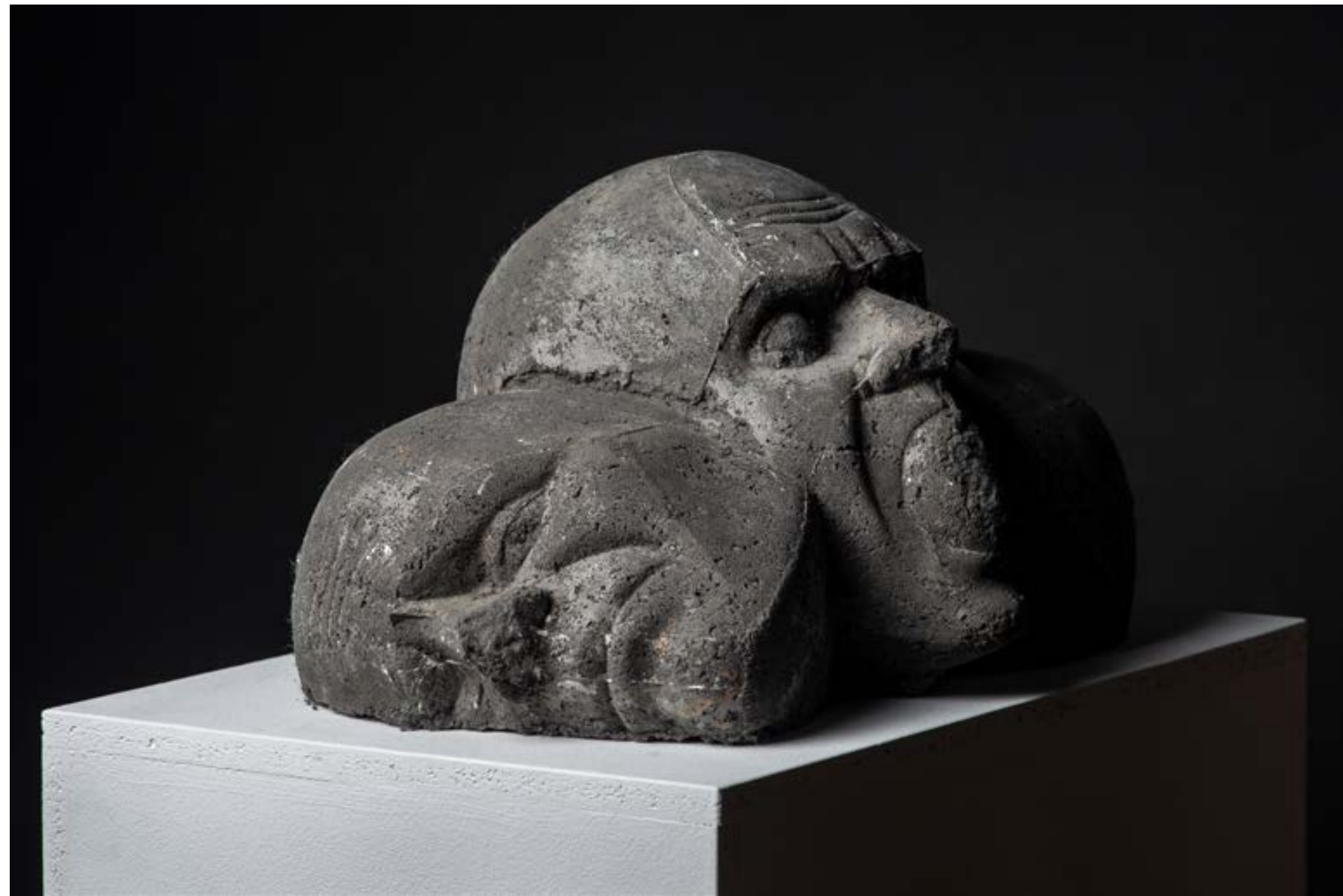
"S.T.S. 2"- crni beton