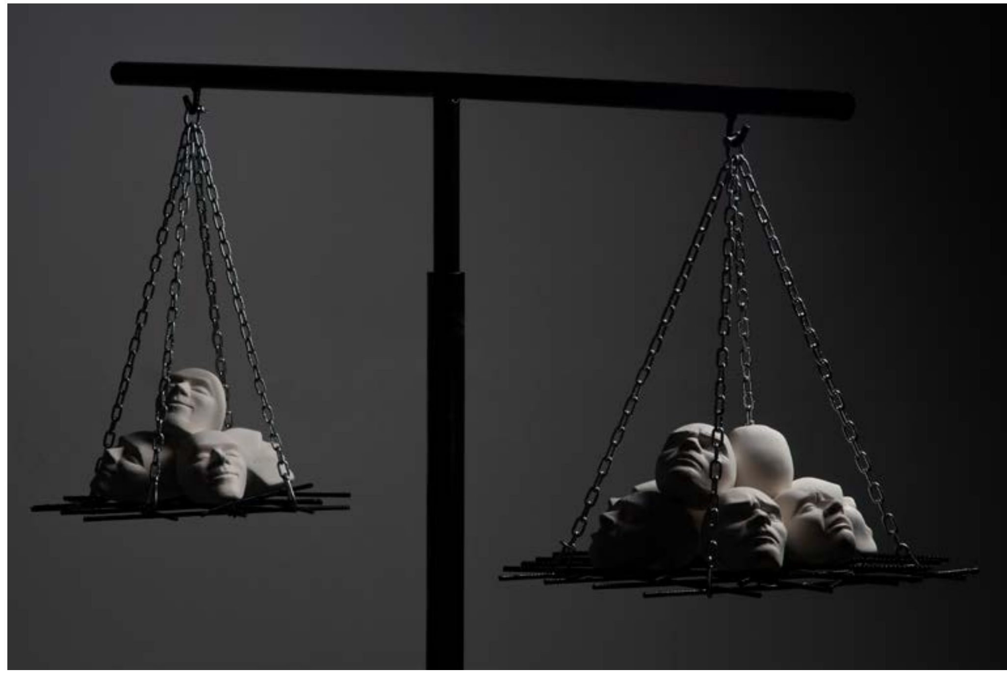
- "2." - porculan i željezo