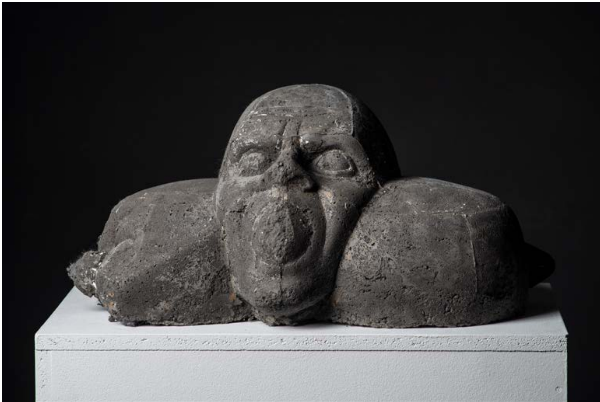
- "S.T.S. 2"- crni beton