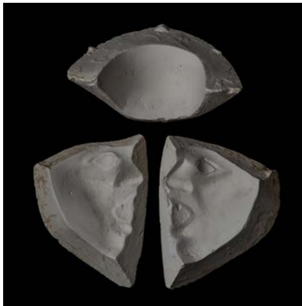
- sadreni kalup za višestruko lijevanje - strah