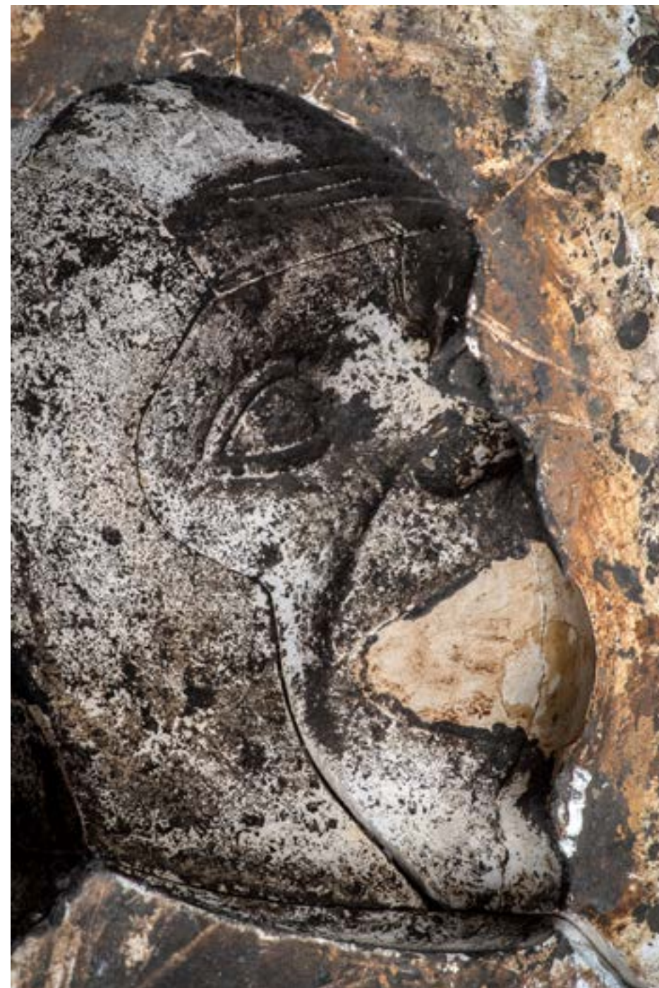
- kalup za višestruko lijevanje - S.T.S. - detalj