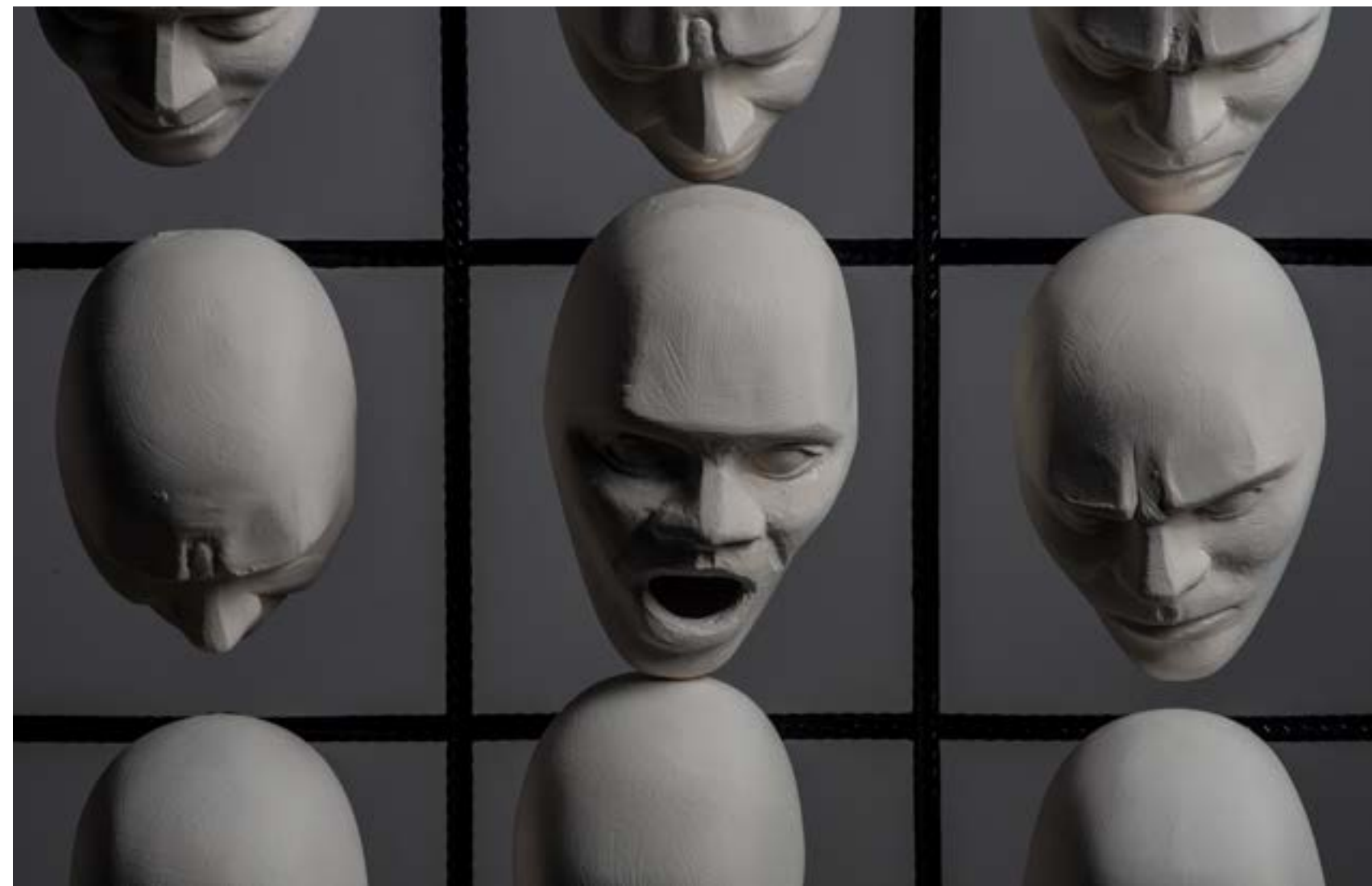
- "1." - porculan i željezo

Odlučio sam iskoristiti željeznu armaturu koja svojim pravokutnim ćelijama podsjeća na ćelije kalendara. Postavio sam trideset modula u kompoziciju na armaturu tako da svaki zauzima jednu ćeliju. Oblik armature i emocije odgovaraju mjesecu koji sam odabrao prikazati. Grafizam željezne armature sam odlučio provesti kroz ostatak radova.