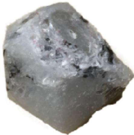
Sl. 14. Nakupine , 2019./2020.