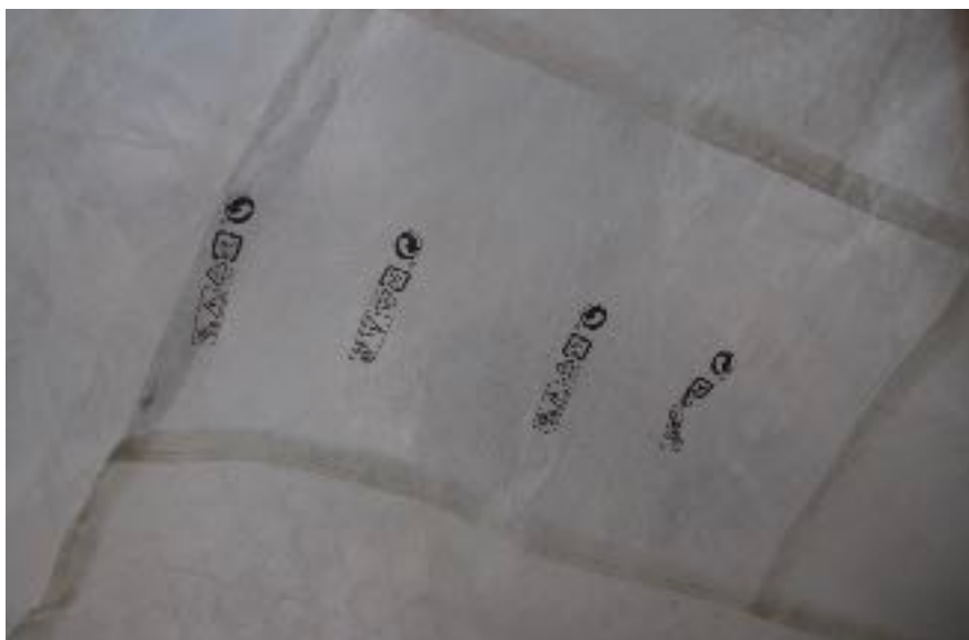
Sl. 11. Šator T - 01 , 2020., detalj

Umjetnički rad Šator T - 01 nastao je motiviran idejom za stvaranjem primarne, metaforičke prostorne jedinice za život. Šator kao lako pomična nastamba, zaklon od tkanine ili bilo kojeg drugog nepromočivog materijala, jedan je od najstarijih oblika ljudske nastambe. U izlagačkom prostoru postaje metafora nestalnosti i nestabilnosti ljudskih okolnosti u današnjem vremenu. Šator T - 01 je fragilan, poluprozirni, prenosivi objekt napravljen od recikliranog, prešanog, rastopljenog i šivanog najlona koji je prethodno bio korišten za pakiranje i transport avionskih paketa i pošiljaka. Materijalom naglašavam ideju promjene, nestalnosti i pokreta.