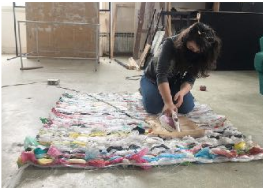
Sl. 9. Tkanica , 2019., izrada