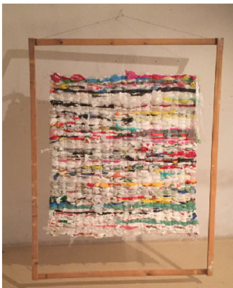
Sl. 10. Tkanica , 2019.