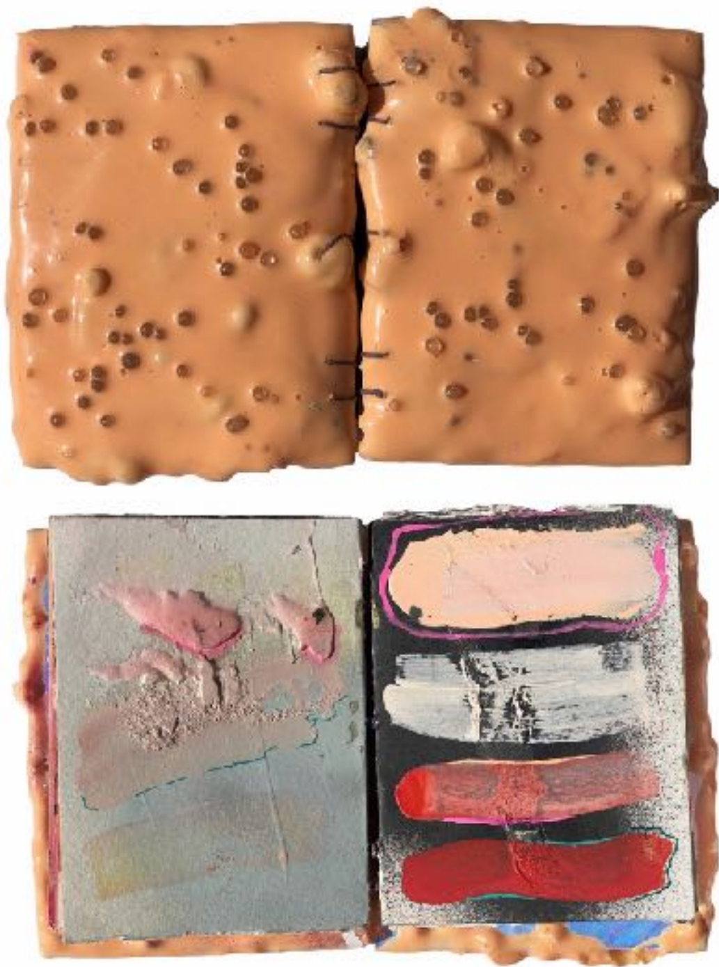
Sl. 5. Laura Soto, Sketchbook , 2018., detalj