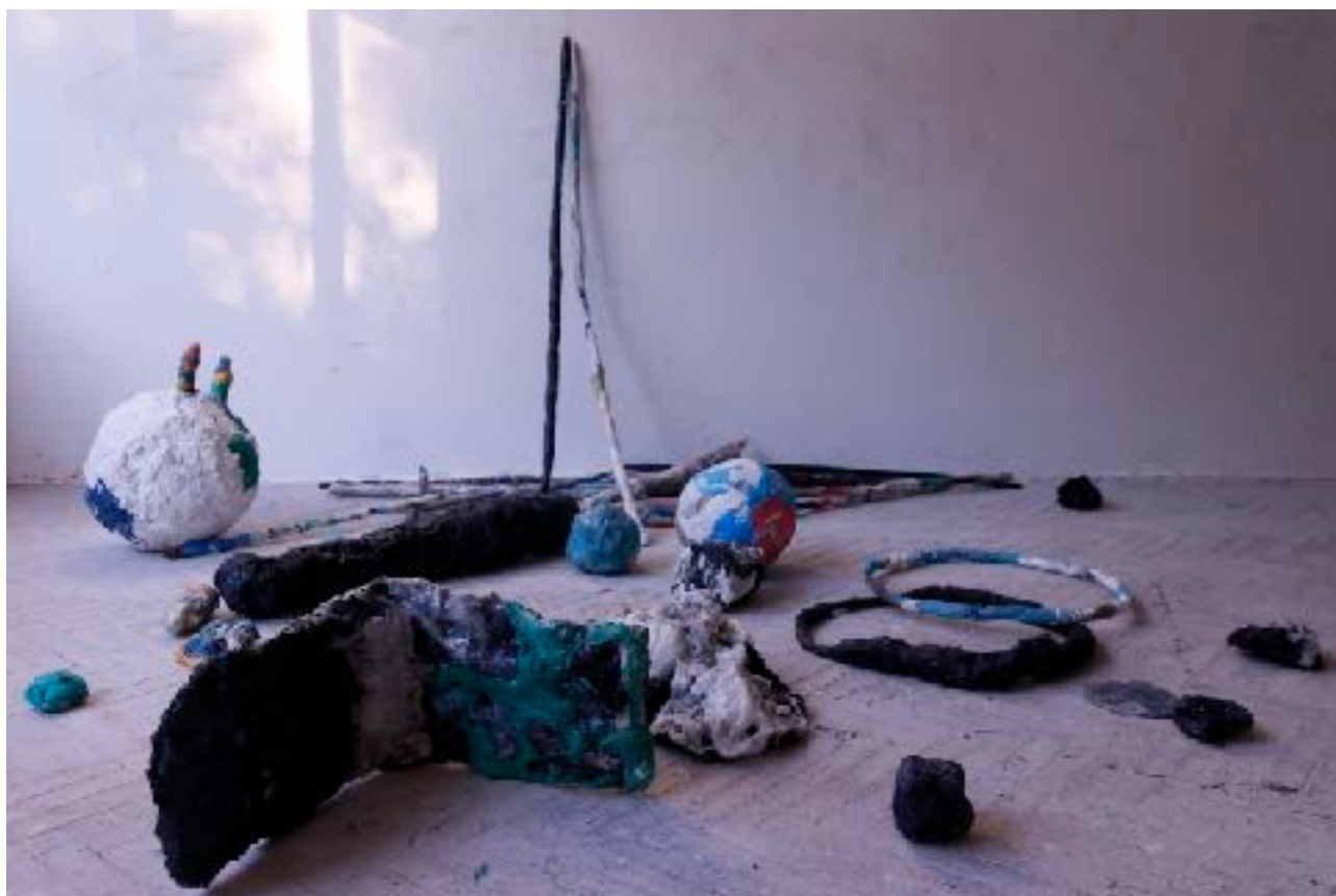
Sl. 19. Plastično igralište , 2020. postav

Na kraju, mogu zaključiti da je moja igra stvaranje “teške plastike”, skulpturalnih objekata i taktila, a interaktivna prostorna instalacija Plastično igralište prostor je kreativnosti i slobodnih interpretacija za posjetitelje/sudionike koji su pozvani da svojom igrom “interveniraju” i otvore nove prostore za imaginaciju.