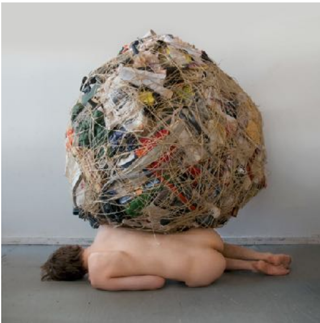
Sl. 2. Mary Mattingly, Život objekata , 2013.

Mary Mattingly američka je umjetnica koja obrađuje teme putovanja, doma, konzumerizma i ekologije. Svoje umjetničke akcije dokumentira i prezentira fotografijama. Život objekata jedan je od sedam radova iz serije Dom i svemir . Umjetnica je gomilala osobne predmete te ih je vezivala špagom, vukla ih je i postavljala u različite prostore, stvarajući narativ. Radovima se referira na mit o Sizifu, prevodeći ga u suvremeni kontekst hiperprodukcije i fenomena konzumerizma. 9