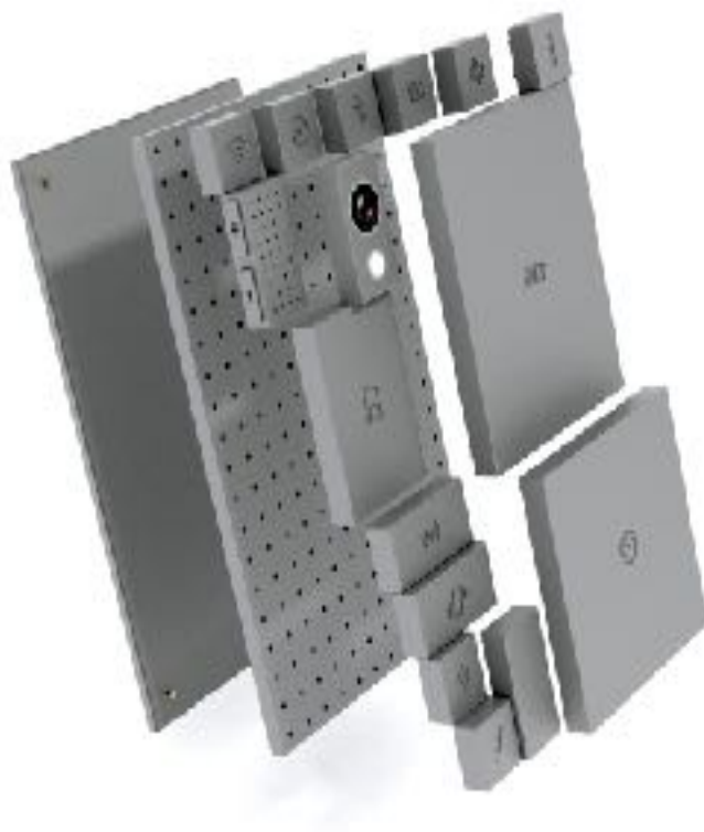
Sl. 7. Dave Hakkens, Phonebloks , 2013.

2016. godine na mrežnim stranicama sam naišla na video nizozemskog dizajnera Davea Hakkensa u kojem objašnjava kako tehnološka pomagala nisu dizajnirana da traju dugo i predlaže novi način korištenja tehnologije i ekološki pristup. Phonebloks je njegov projekt modularnog mobitela koji se sastavlja od personaliziranih komponenta poput Lego kocaka. 12 Taj me je projekt zainteresirao za autora i njegove aktivnosti u području ekološkog dizajna.