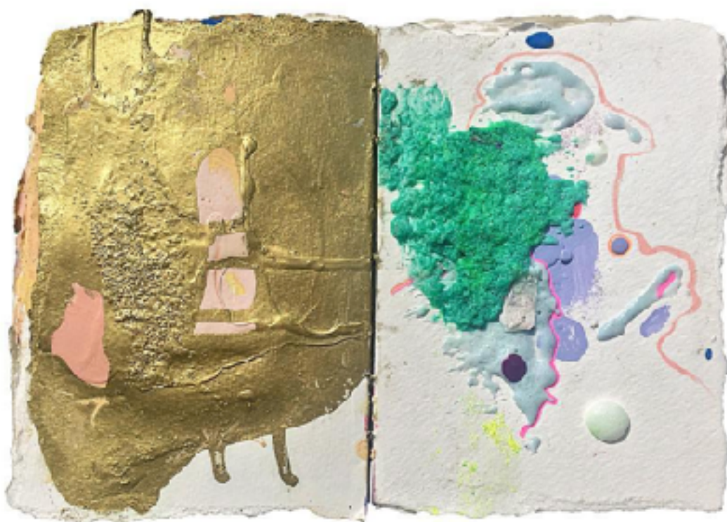
Sl. 4. Laura Soto, Sketchbook , 2018., detalj

Laura Soto američka je umjetnica. Njezini radovi posjeduju optički privlačne i taktilne odlike jer kombinira različite teksture materijala s bojom i reflektirajućim materijalima i objektima. 11 Izdvajam seriju umjetničkih objekata u formi bilježnica za crtanje koje umjetnica sama izrađuje. Korice “bilježnica” modelirane su upotrebom različitih sintetičkih materijala, kojima dobiva zadebljane površine. Listove bilježnice oblikuje i ispunjava apstraktnim “zapisima” izvedenim u različitim likovnim tehnikama.