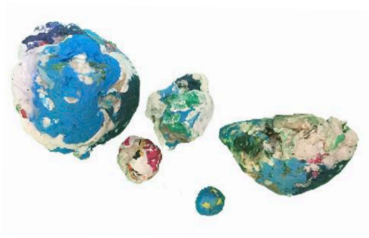
Sl. 13. Nakupine , 2019./2020.

Tijekom eksperimentalne faze i učenja o svojstvima materijala kroz praksu, topljenjem jednokratne plastike nastaju predmeti manjih dimenzija koji svojim oblicima i strukturom nalikuju nakupinama - taktilima 15 . Podsjećaju na naslage žvakaćih guma ili plastelina u boji. Uglavnom, forme nastaju spontano, ali završna je dorada planska. Neki objekti manjih dimenzija brušeni su i rezani tračnom pilom.