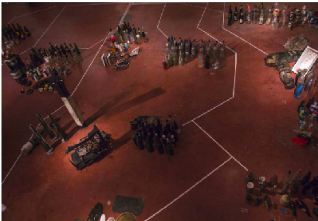
Sl. 3. Vanja Babić, Forest, happy birthday , 2017.

Vanja Babić je hrvatski novomedijski umjetnik. Kroz svoj rad artikulira antropološke i kulturološke teme, kao što su odnosi pojedinca i ekonomske moći i ekosfera u kontekstu antropocena. 2017. godine boravio je na rezidenciji Akademie Schloss Solitude u Stuttgartu gdje razvija istraživanje o temi otpada i recikliranja u kontekstu današnjice. Umjetnik je svoj projekt započeo istraživanjem lokacije, mapirao je kretanje i sakupljao otpad po okolnoj šumi, a kasnije ga je iskoristio u izradi instalacije. Forest, happy birthday sastojala se od fotodokumentacije umjetnikovog kretanja i “pronalezaka”. 10 Nakon umjetničke prezentacije sav sakupljeni materijal propisno je odložen i recikliran.