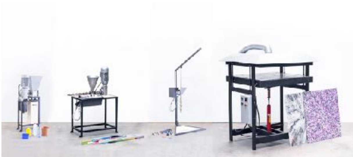
Sl. 8. Fotografija mašina izrađenih u Precious Plastic radioni

Projekt Precious Plastic iz 2013. godine hardver je otvorenog koda koji omogućava dijeljenje i dopunjavanje sadržaja na web stranici s misijom i vizijom recikliranja plastike. 13 Na web stranici projekta Daveov tim suradnika objavljuje nacрте za mašine različitih funkcija (poput mašine za topljenje, drobljenje i oblikovanje plastične ambalaže). Svi nacрти su besplatni kao i upute za upotrebu i sastavljanje mašina. Cilj projekta je reciklirati, učiti o procesima proizvodnje, dizajna i ekološkog djelovanja i povezivati ljude sa sličnim interesima iz različitih dijelova svijeta.