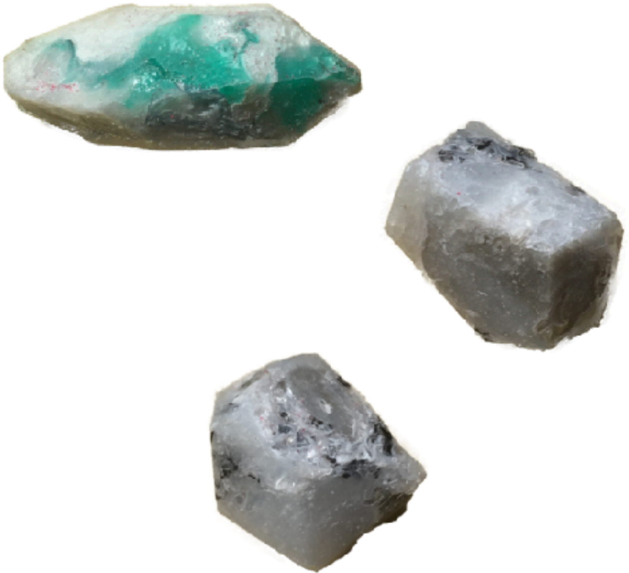
Sl. 14. Nakupine , 2019./2020.