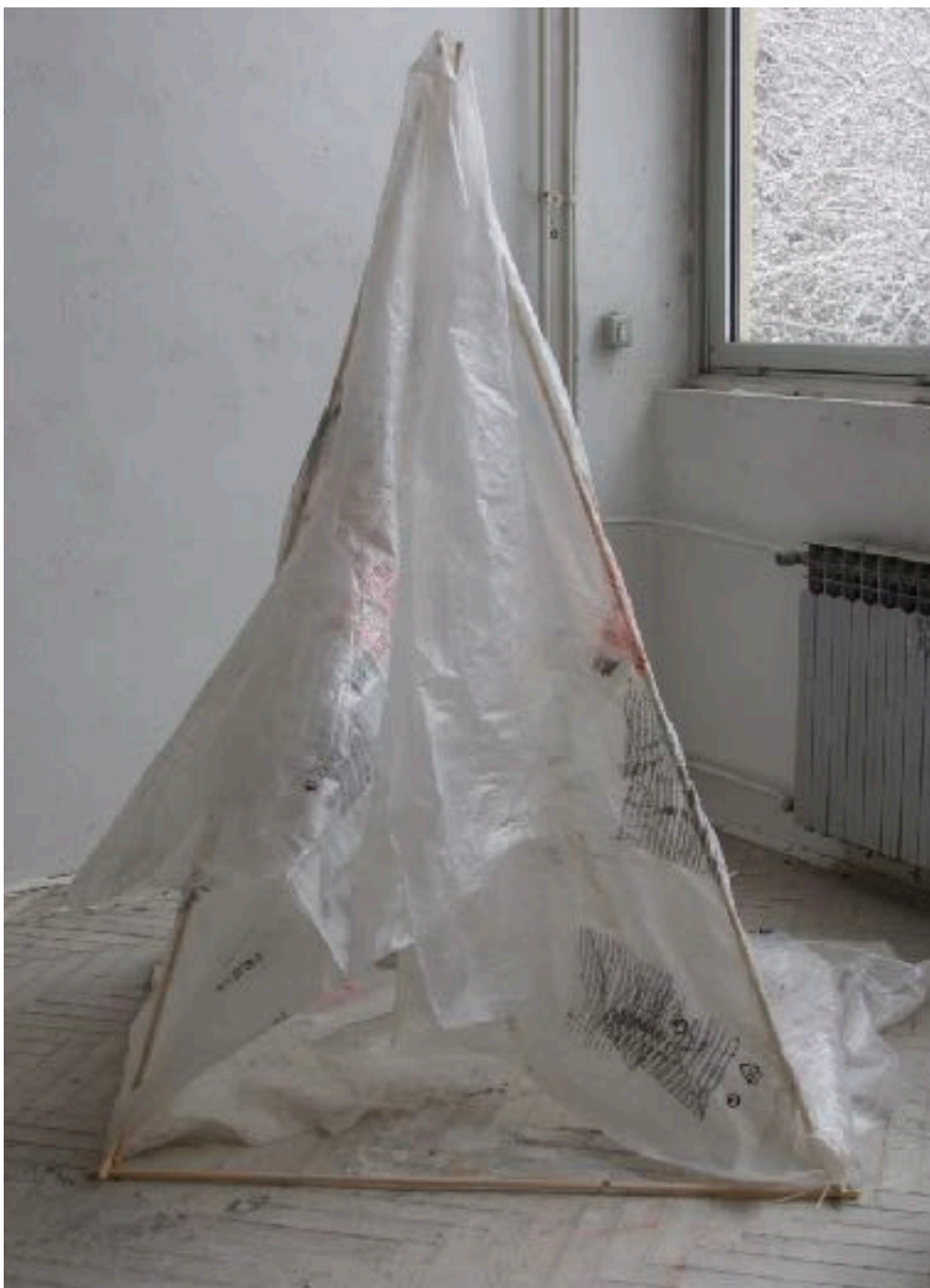
Sl. 12. Šator T - 01 , 2020.