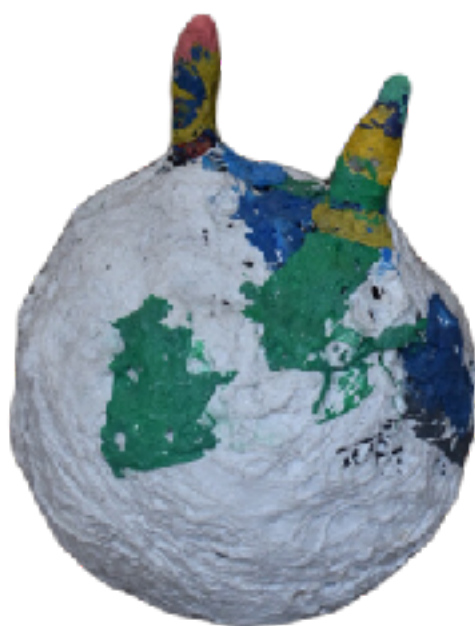
Sl. 18. Plastično igralište: Jo-jo lopta, 2020.

Izvedena po modelu igrčke, promatrača može asociirati na dječju loptu na napuhavanje koja je namijenjena za skakanje, ali ova teška, nepravilna kuglasta tvorevina s dva roga lišena je funkcije skakanja. Ima “manu” i njome možemo samo ljuljati se na mjestu.