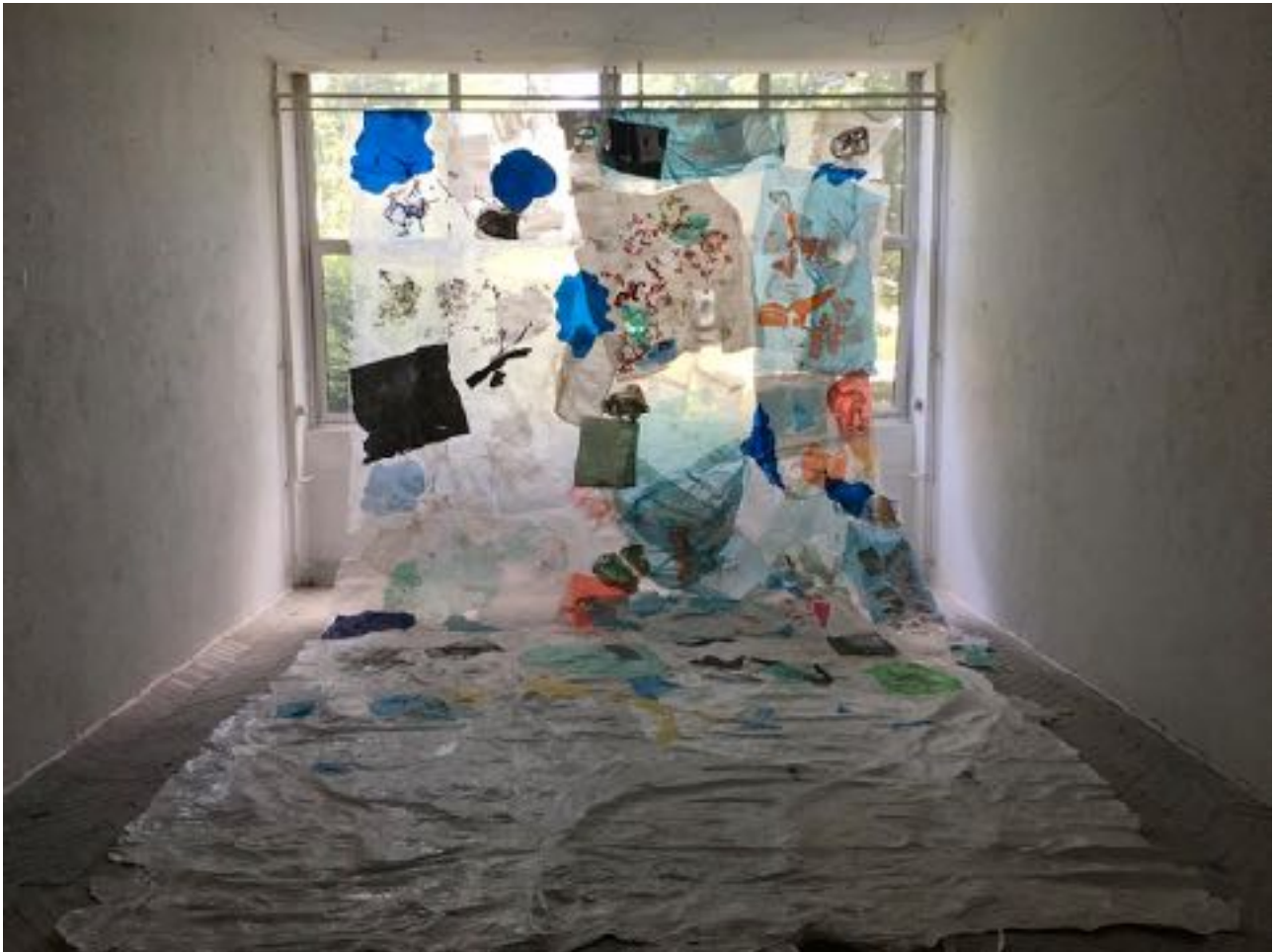
Sl. 17. 2021., 2021.

Svaki komadić višemetarske instalacije nastao je peglanjem, topljenjem, prešanjem i lijepljenjem odbačenih vrećica i industrijskih plastičnih folija. Dodatan element rada je njegov postav uz prozore i pozadinsko osvjetljenje prirodnim svjetlom. Svjetlo poništava, dodaje, otkriva i mijenja kompoziciju.