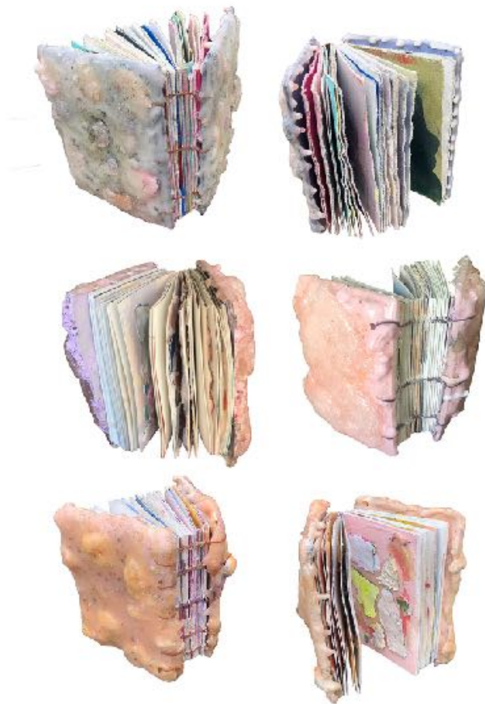
Sl. 6. Laura Soto, Sketchbook , 2018.