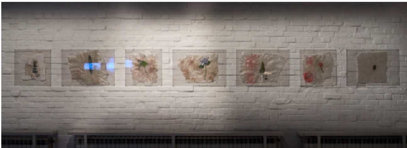
Sl. 15. Plastični herbarij, 2021. , Galerija SC, Zagreb

Nakon iskustva predavanja, razgovora i konzultacija, kao krajnji rezultat moga umjetničkog istraživanja nastao je rad Plastični herbarij (Sl. 4.). Tradicionalno, praksa herbarija je postavljanje odabranih biljnih vrsta unutar tankih listova papira uz popisane relevantne podatke o biljci: karakteristike, latinski naziv, mjesta pronalaska i ime osobe koja je evidentirala biljku. Rad Plastični herbarij imitira praksu tradicionalnog herbarija, a plastične biljke postavljene su unutar tankih listova iskorištene plastike te su rastopljene/ ispeglane kućnom peglom. Radom ironiziram odnos suvremenog, neosvještenog potrošača prema prirodi. Činjenica je da smo sve češće okruženi jednokratnom plastičnom ambalažom nego živom prirodom