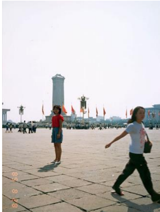
Chino Otsuka, Kina 1985./2005., iz serije radova Imagine finding me , 2005, kromogeni otisak, 305x406 mm

Opisanim procesom umjetnica daje značaj promjenama pomoću kojih želi oživjeti trenutke sa starih fotografija, pokrenuti komunikaciju s vremenom, s prošlošću zbog koje se oblikovala u osobu kakva je danas.