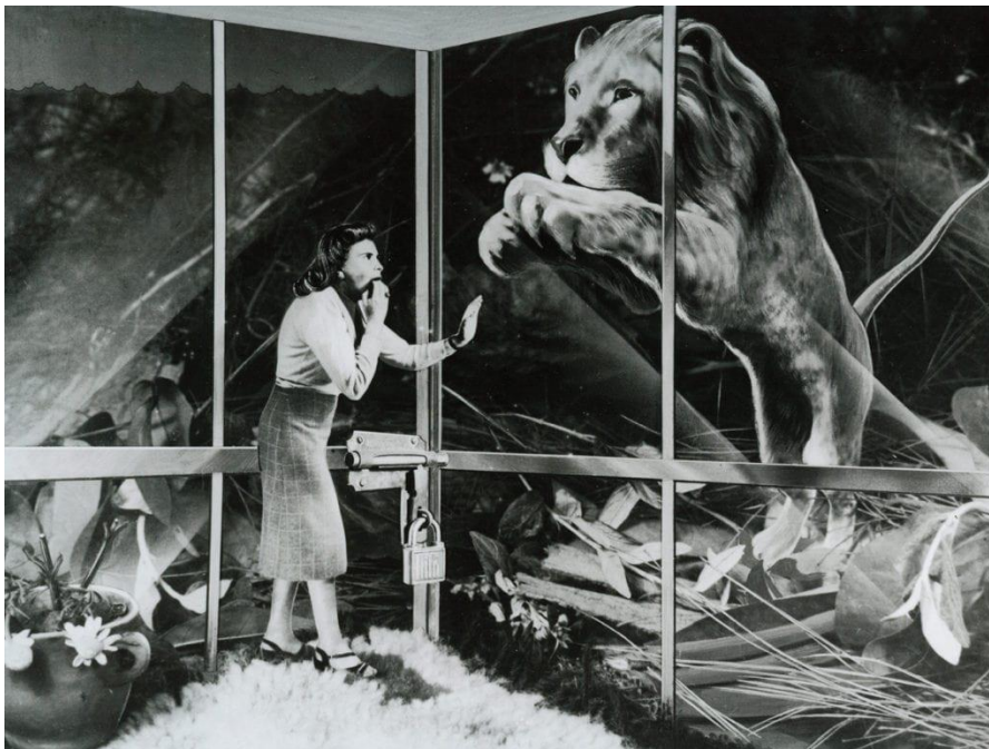
Greta Stern, Sueño (dream) N° 12 , 1948.

Kolaž kao umjetnička praksa svoj puni potencijal ostvaruje početkom 20. stoljeća nudeći bezbroj mogućnosti u tumačenju i kritici društvenih, ideoloških i ekonomskih aktualnosti. 12 Kao novi pogled na svijet kroz umjetnost, kolaž otvara dotad neotkrivene prostore za eksperimentiranje i razumijevanje slučajnosti u umjetničkom procesu. Tako ova tehnika uvodi i kombinira elemente slika i fotografija, tekstove, dijelove časopisa, novina i drugog, dok je sam postupak kolažiranja sačinjen od slaganja i prenamjene različitih elemenata u novu cjelinu. Već iz rečenog vidljivo je da korištenje kolaža nudi niz mogućnosti. To isto vrijedi i za medij fotokolaža koji primjenjujem u svome radu, a pomoću kojega se, spajanjem različitih elemenata fotografija, kreira neki novi prizor i na taj način postiže dojam nove slike. Nadrealistički fotokolaži vizualiziraju prizore izvan stvarnog i fizičkog svijeta stvarajući pritom nelagodnu atmosferu zbog realnog prikazivanja nestvarnih elementa. Tako, primjerice, Greta Stern, argentinsko-njemačka fotografkinja, kroz svijet fotokolaža stvara imaginarne i nadrealističke prizore u kojima najčešće žene imaju glavnu ulogu, a kojima propitkuje i kritizira njihovu ravnopravnost.