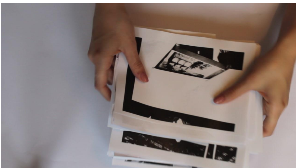
Fotografija iz videorada

U video radu također pokušavam prostor blagovaonice dublje sagledati i zapamtiti kroz proces dekonstruiranja i poništavanja originalnog prostora kako bi saznala nešto više o ostatku toga prostora te svim njegovim fizičkim i misaonim elementima.