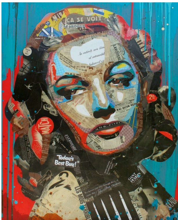
Arnaud Bauville; "Le Combat de Trop", kolaž na platnu, 100 x 120 cm