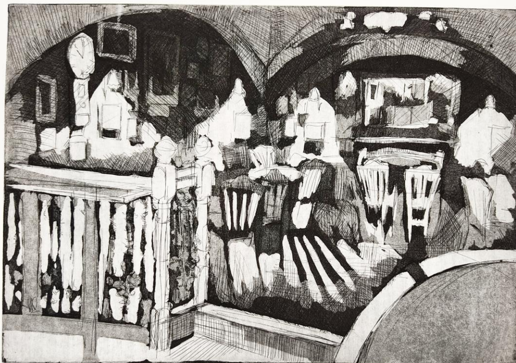
»The Old Pharmacy«, 2021., bakropis i akvatinta, A4 pločica.