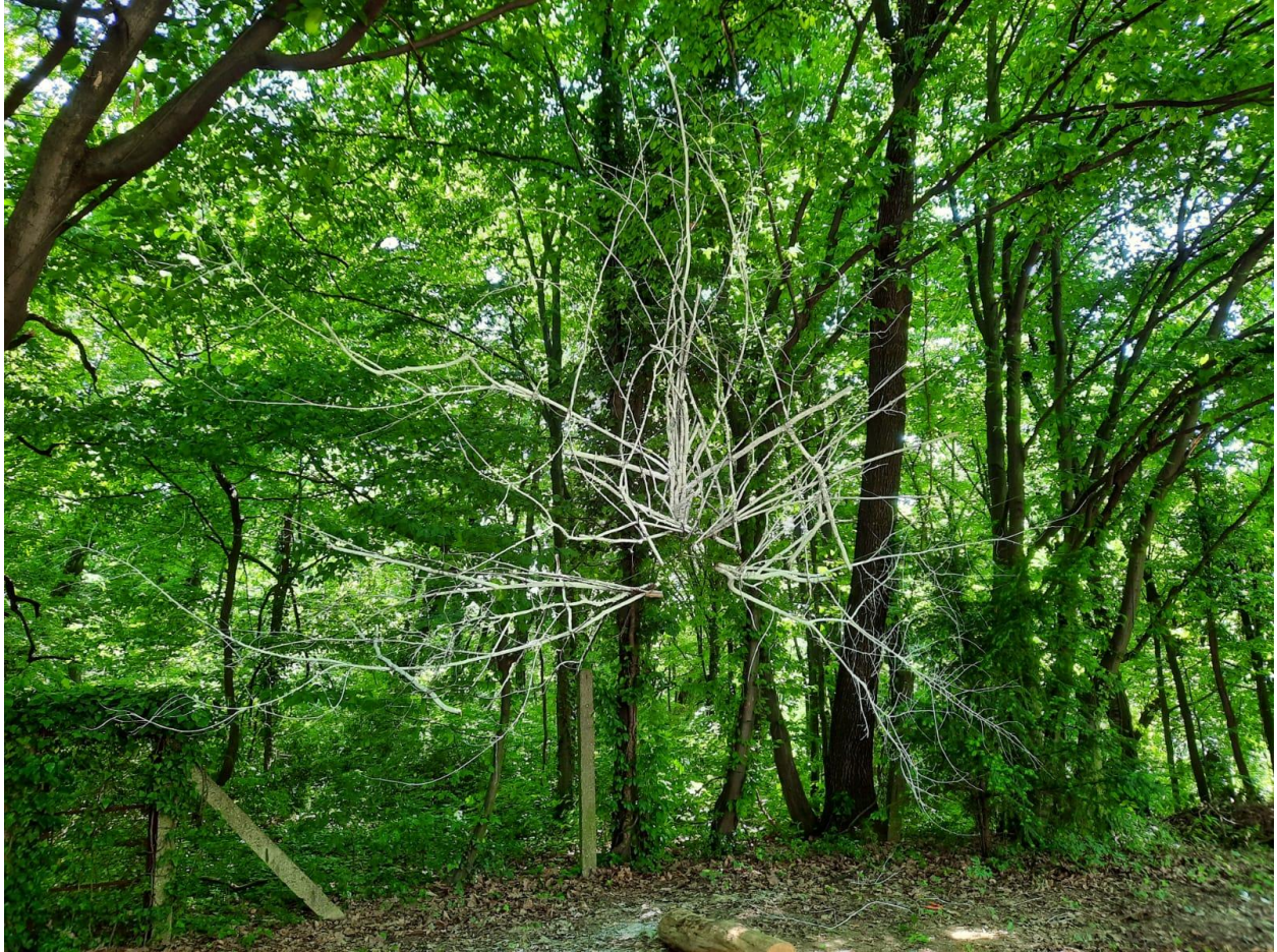
Bez naziva, 2022., instalacija, cca 5 x 3 m.