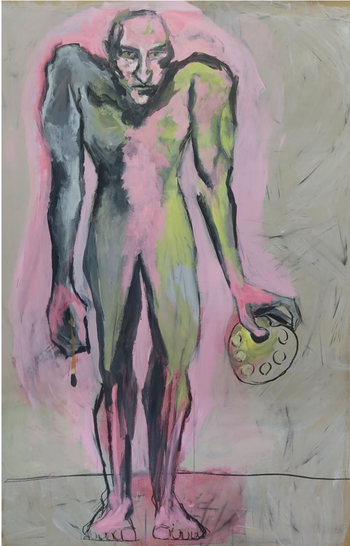
»Slikar I«, 2022., ugljen, akril, 170x120cm.