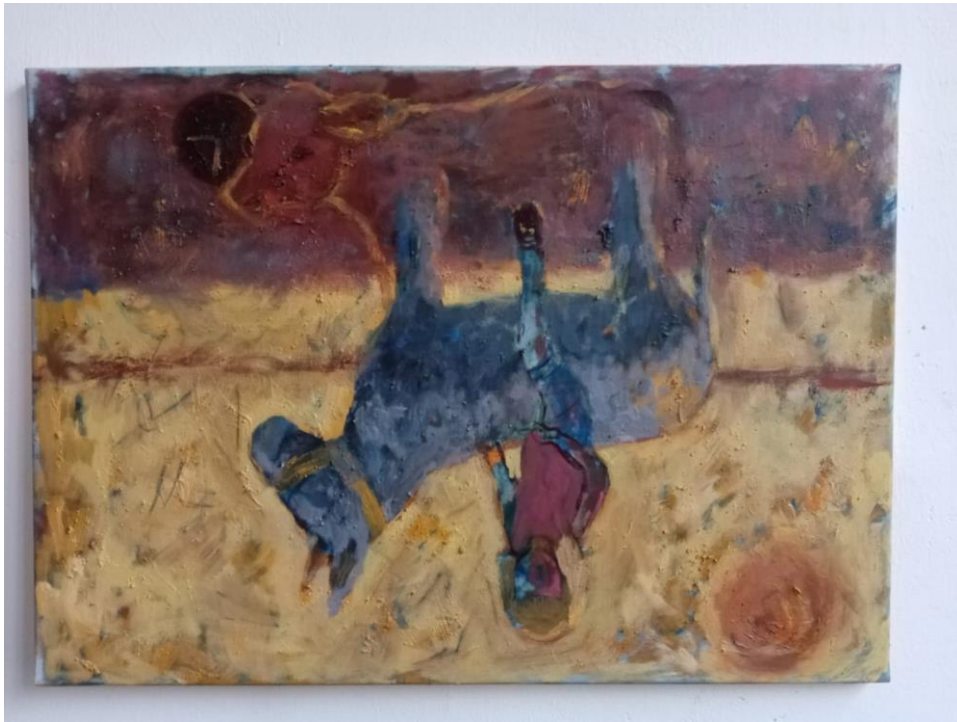
Žuta , 70 x50, Ulje na platnu