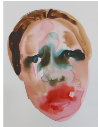
Portreti, akvarel, 21.0 x 29.7 cm (108), 42x 59,4 cm (14)