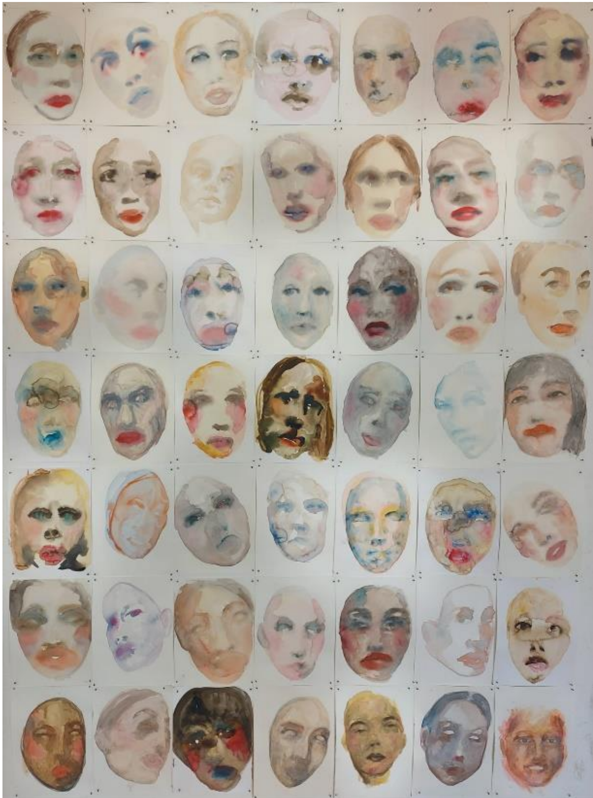
Portreti, akvarel, 21.0 x 29.7 cm (108)