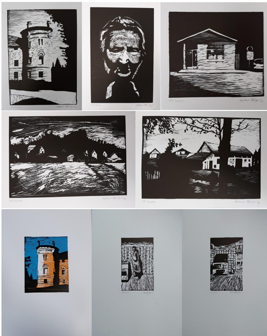
Kula dvorca u Lovrečini, 2020., linorez, 20x30 cm; Dragica, 2020., linorez, 20x30 cm; Stari kiosk na kolodvoru, 2020., linorez, 20x22 cm; Pogled na Pavlovec iz vlaka, 2020., linorez, 20x30 cm; Dvorište, 2020., linorez, 20x30 cm; Kula, 2021., linorez, 16x21 cm; Marica, 2021., linorez, 12x20 cm; Mačka, 2021., linorez, 12x20 cm