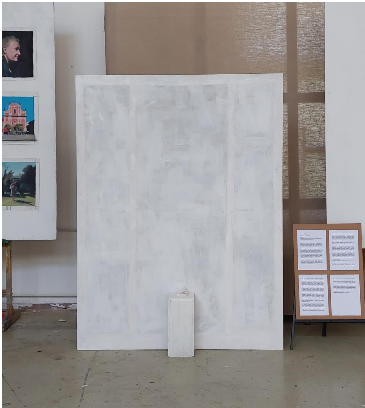
Idea: Ivan 1:1, 2022., instalacija: akril i tempera na platnu 150x200 cm, drveni postament 17x40x17 cm, knjiga: Biblija. 8x11 cm