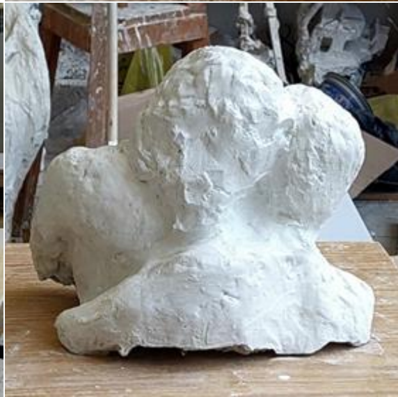
Poljubac, 2022., gips, visina: 30 cm