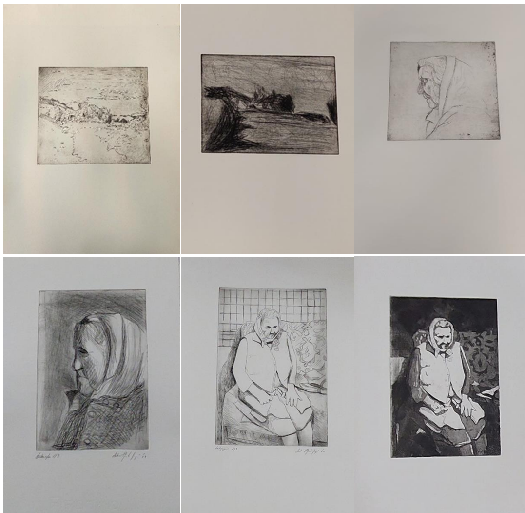
Štručljevo 1, 2022., bakropis, 20x24 cm; Štručljevo 2, 2022., suha igla, 15x20 cm; Pogled, 2022., bakropis i akvatinta, 20.5x21 cm; Baka, 2022., suha igla, 15x20 cm; U kuhinji, 2022., bakropis, 20.5x29 cm; U kuhinji, 2022., bakropis, akvatinta i suha igla, 20.5x29 cm