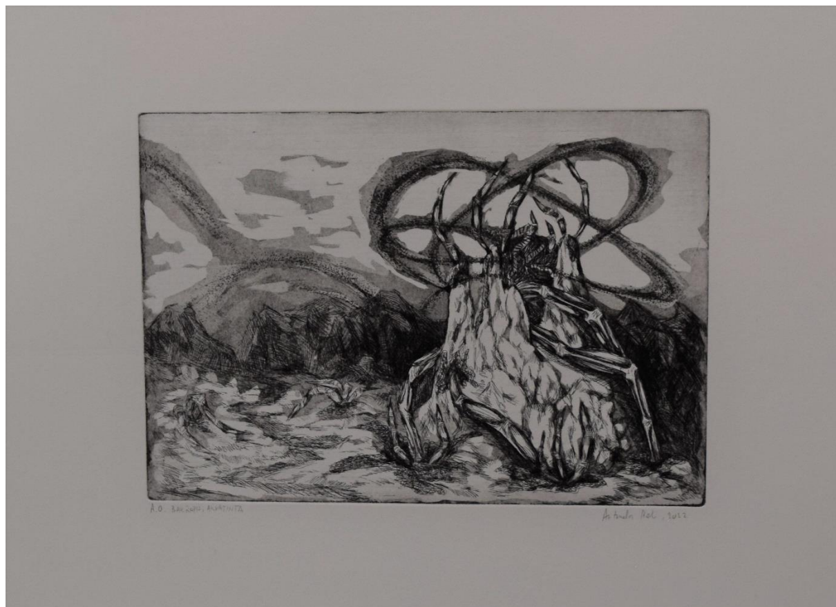
Bez naslova, 2022., bakropis, akvatinta

Na kraju radim usporedbu prvotne skice i zadnjeg otiska gdje jasno mogu uočiti koliko se kroz proces rada promijenila ideja i kako se rad kroz namjerne intervencije, ali isto tako i slučajne, individualizira i poprima svoj identitet.