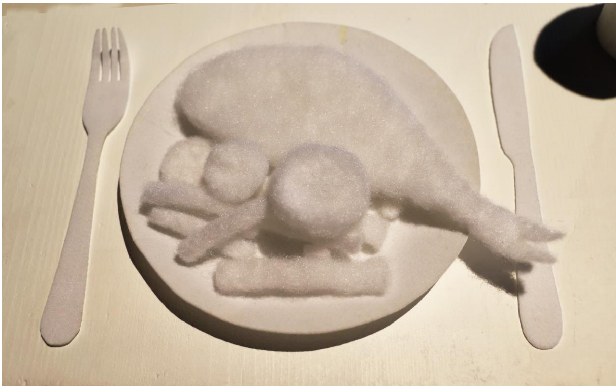
Dobro sam, jela sam , postav u Galeriji SC u Zagrebu, svibanj 2022. (detalji)