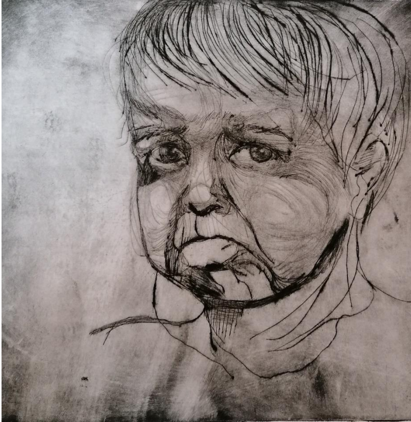
“Tuga”, 2021., suha igla