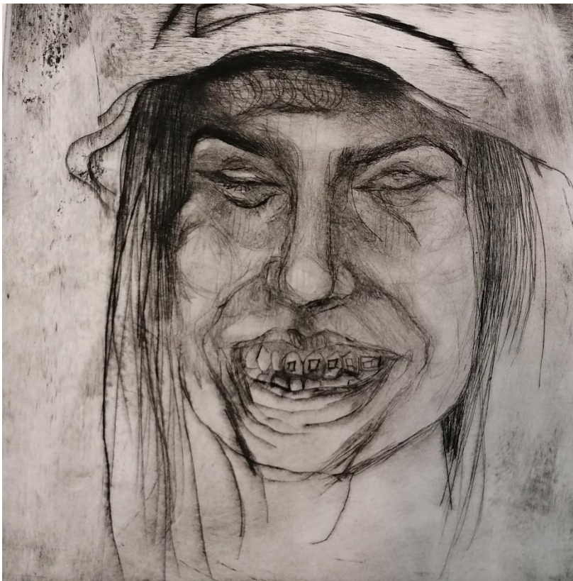
“Sreća”, 2021., suha igla