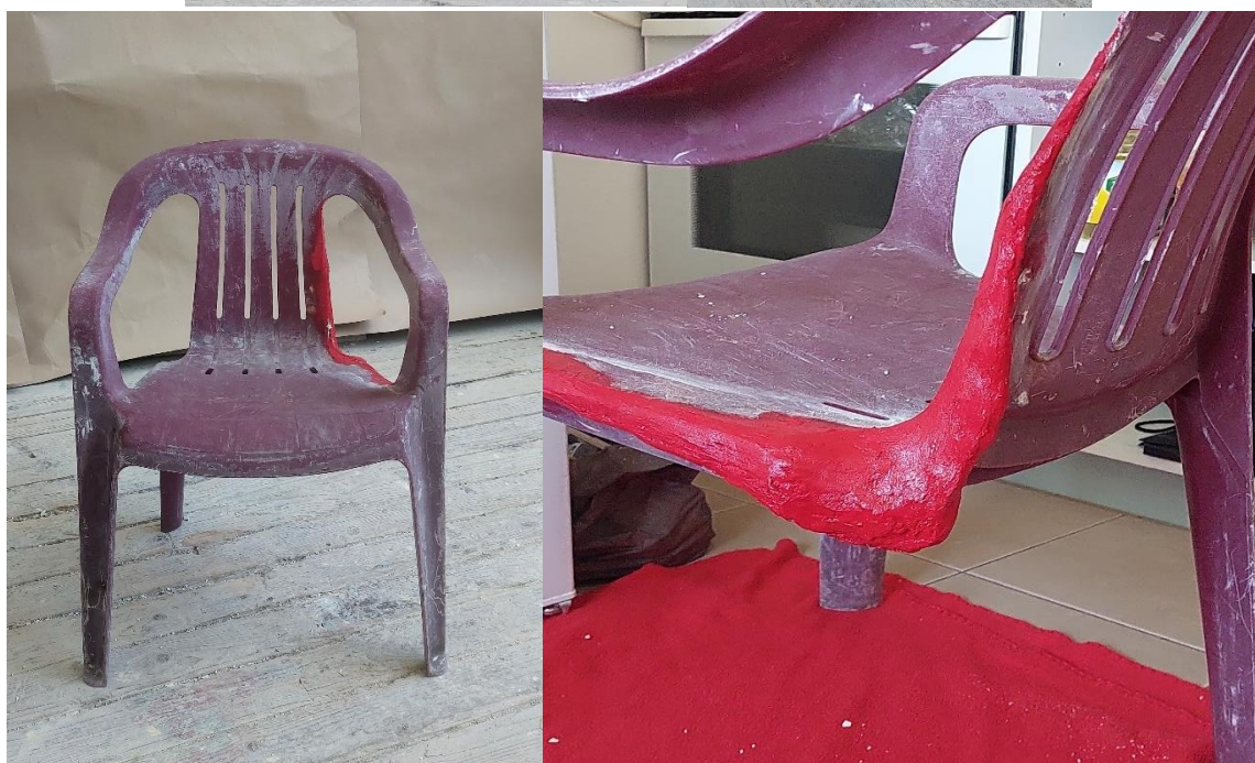
„Autoportret“, 2023., intervencija gipsom na plastičnom stolcu