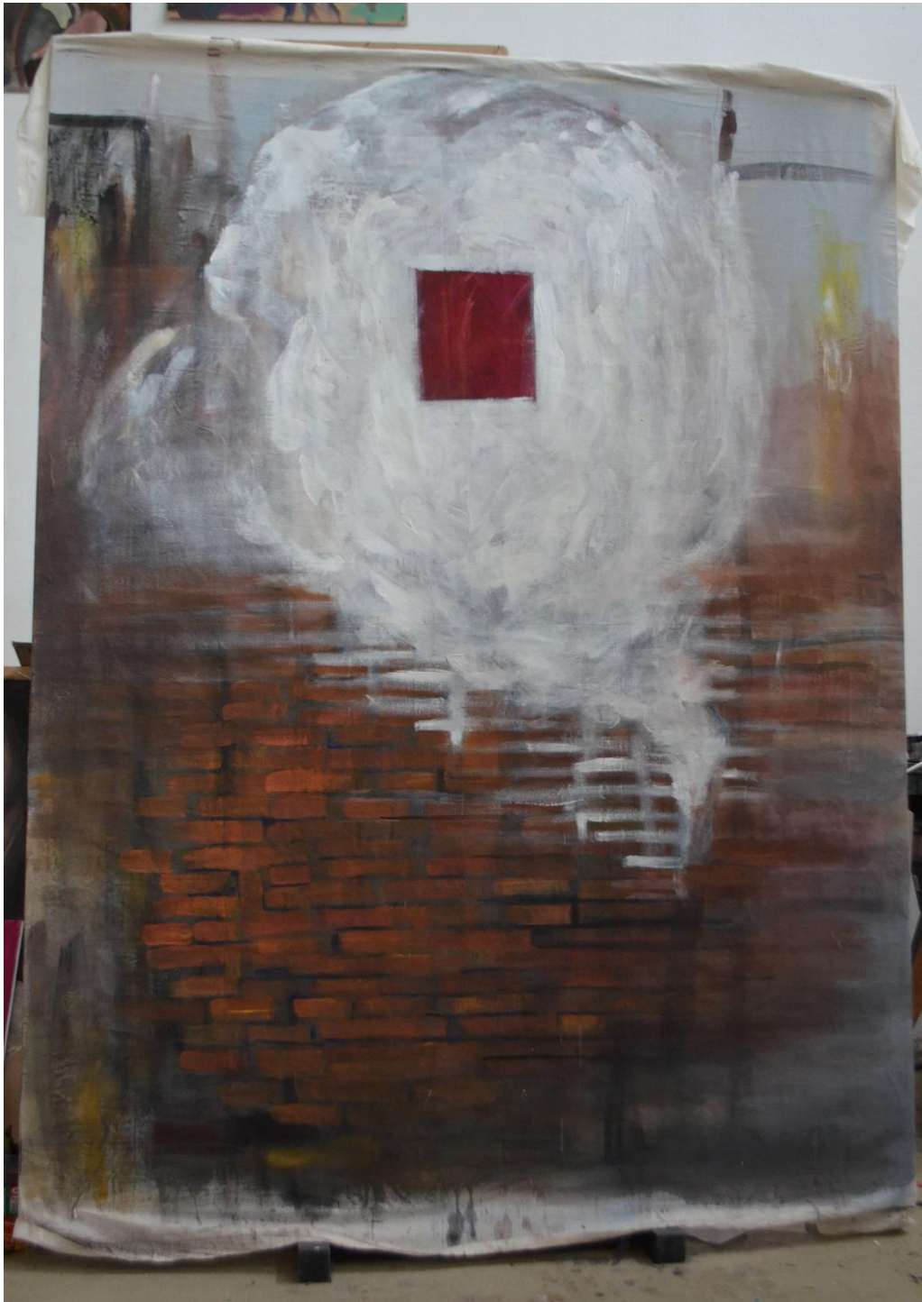
„Autoportret“, 2023., akril, tempera, drvofigs, ugljen, pastele, 200 x 150 cm