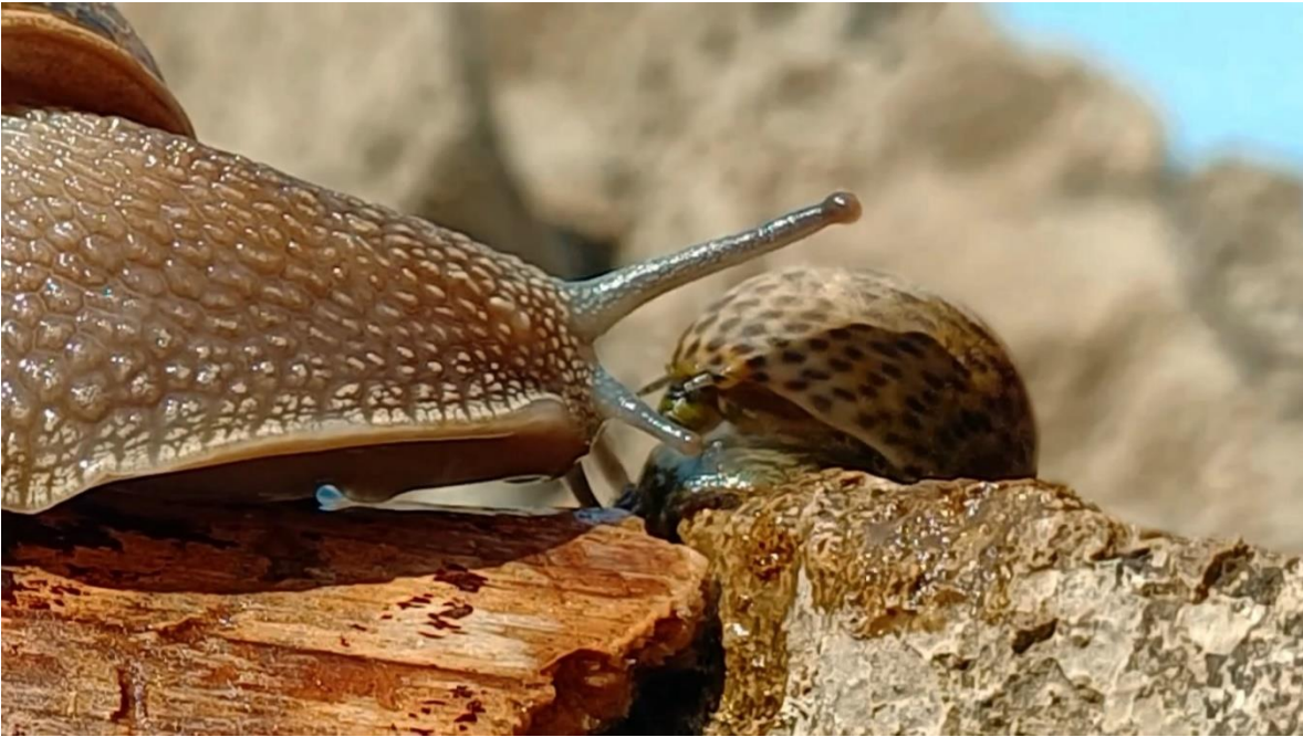
Slika 3. Kadar iz videa, scena susreta dvaju puževa.

Slijedi slučajan susret ovih dvaju bića. Zaintrigirani svojim naoko sličnim, a ujedno različitim obilježjima, prilaze jedno drugome i njihovi se svjetovi spajaju.