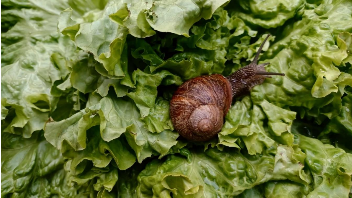
Slika 5. Kadar iz videa, gozba uz salatu.

Nakon uživanja u salati kopneni puž prolije obližnju bocu piva naslonjenu na kamen. Slijedi scena pijanstva. Ta je sekvenca tehnički najeksperimentalniji dio videa, budući da priroda opijenosti ostavlja prostor za poigravanje s video efektima kao i za eksperimentiranje sa stop animacijom.