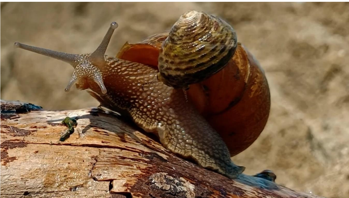
Slika 4. Kadar iz videa, nanar na puževoj kućici.

Morski puž odluči poći s kopnenim popevši mu se na kućicu, što nas uvodi u iduću cjelinu – njihov zajednički odlazak na gozbu. Prolaskom kroz šumu oni dolaze do poznate lokacije, one gdje je kopneni puž započeo svoj dan – to je njegov dom.