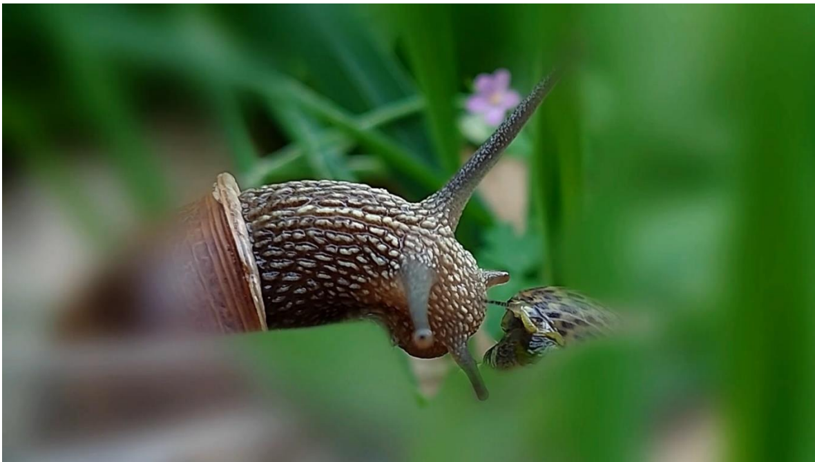
Slika 8. Kadar iz videa, snoviti, romantičan trenutak usred pijane kaotičnosti (2)

Iduća je cjelina scena sna morskog puža u kojoj se stereotipno i na komičan način upotrebljava zvuk harfe kao nagovještaj upadanja u san. Morski puž sanja svoj dom, prijatelje i obitelj, a san završava njegovim povratkom u more. Iduća cjelina započinje buđenjem morskog puža. Primjećujemo da je pala noć – koloristička promjena scene stvara promjenu atmosfere videa iz lepršave i vesele u ozbiljniju i sumornu. Kopneni puž je i dalje je u snu, dok ga morski napušta.