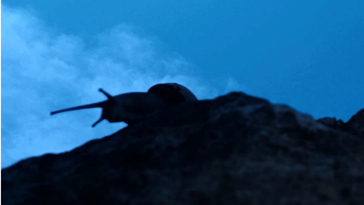
Slika 11. Posljednji kadar videa, puž s ruba kamena gleda u morsko dno.