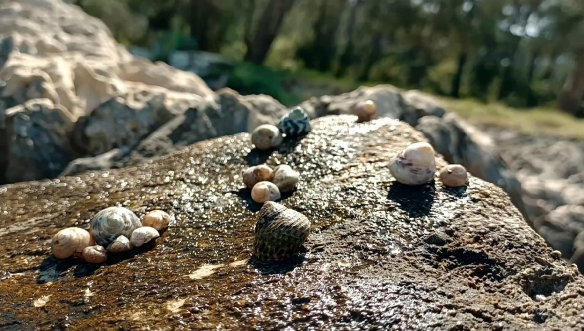
Slika 1. Kadar iz videa, nanar sa svojom obitelji i prijateljima.

Video rad Puževim korakom sastoji se od osam cjelina. Prva od njih započinje prikazom uobičajenog dana jednog morskog puža i na lepršav nas način uvodi u priču prikazujući jedan mikro svijet – nanara među svojom obitelji i prijateljima, naglašavajući kako je to mjesto gdje pripada, što ujedno i nagovještava buduće događaje filma. Također nas upoznaje s glavnim tehničkim obilježjem videa, ubrzanim kretanjem puževa.