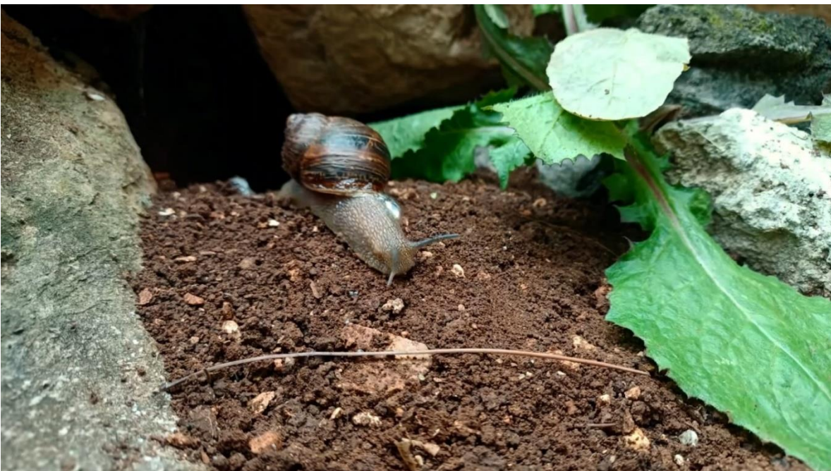
Slika 2. Kadar iz videa, puž izlazi iz svog kamenog skrovišta.

Druga cjelina slijedi uobičajen dan jednog kopnenog puža. On se budi i izlazi iz svog skrovišta u kamenu te kreće u šetnju kroz šumu.