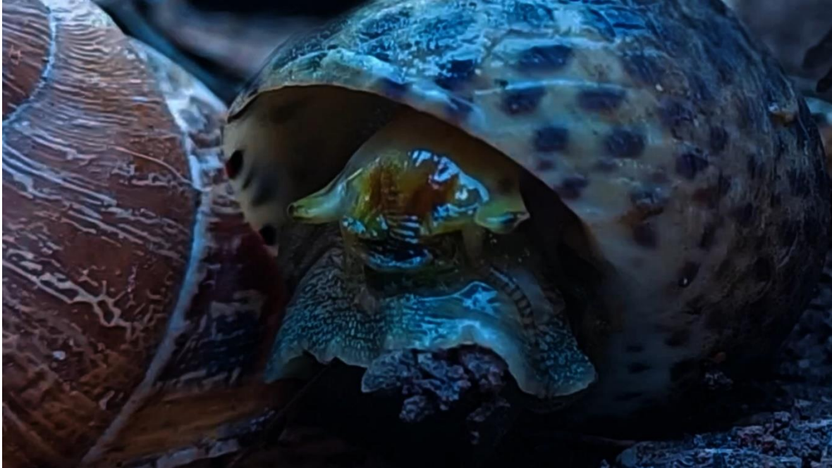
Slika 9. Kadar iz videa, nanar probuđen iz sna.

Posljednja cjelina obuhvaća potragu kopnenog puža za morskim, te kraj videa. On se nakon nekog vremena budi i, uvidjevši da je sam, kreće kroz šumu u potragu koja ga neminovno vodi do mora. Posljednji kadar prati kopnenog puža koji dolazi do samog ruba kamena te gleda dolje u more. Video ovdje završava naglim rezom, ne otkrivajući gledatelju je li kopneni puž pronašao onoga koga je tražio, odustao od potrage ili pošao za njim u morsku dubinu.