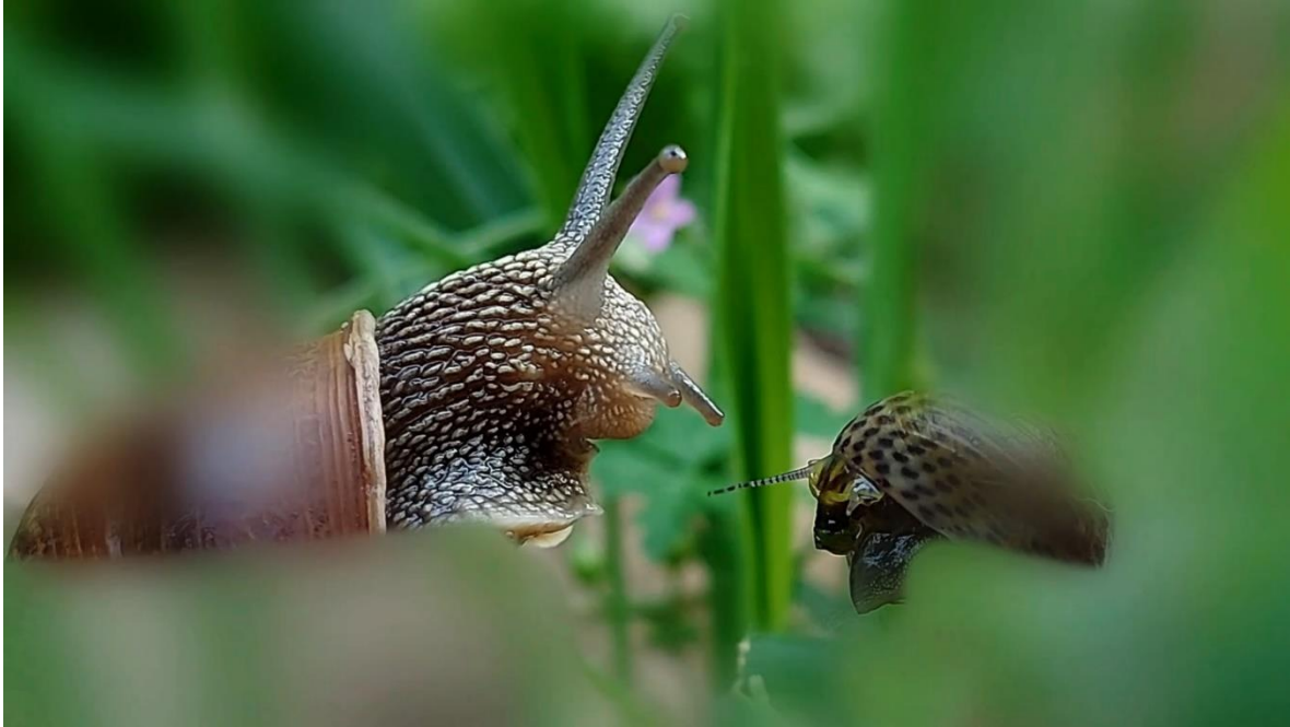
Slika 7. Kadar iz videa, snoviti, romantičan trenutak usred pijane kaotičnosti (1)