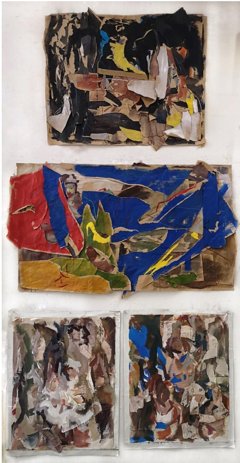
Bez naziva, 2019., akril na platnu i papiru