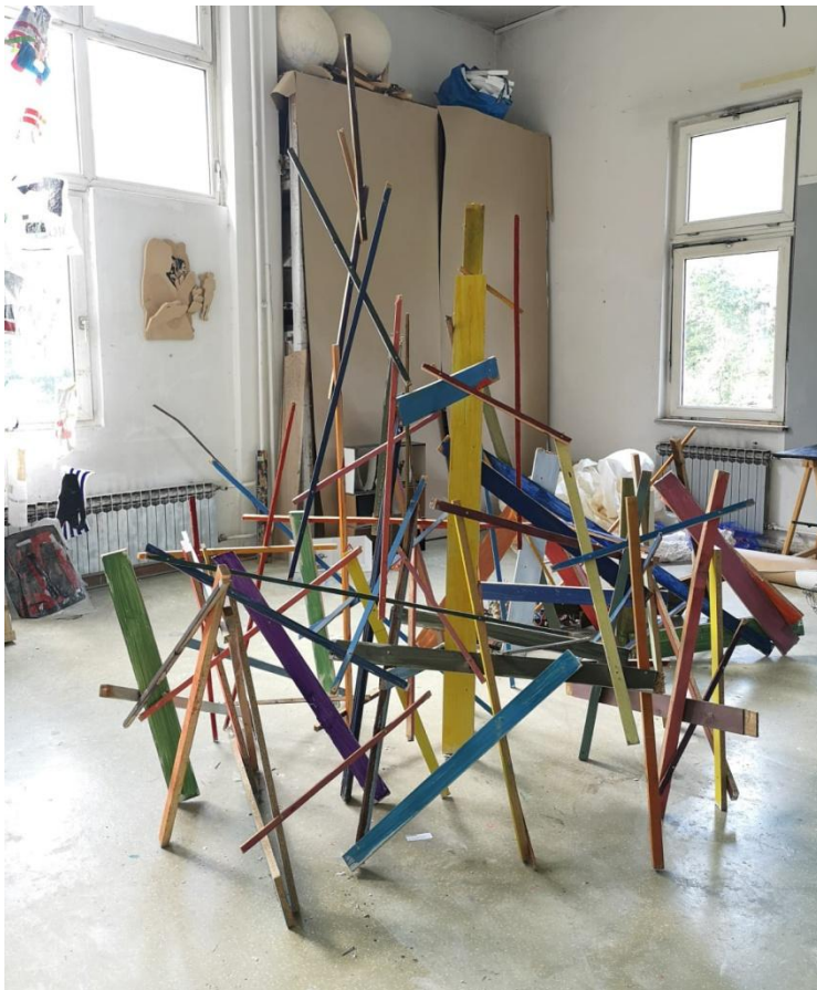
Igra, 2019., drvene letvice i daske