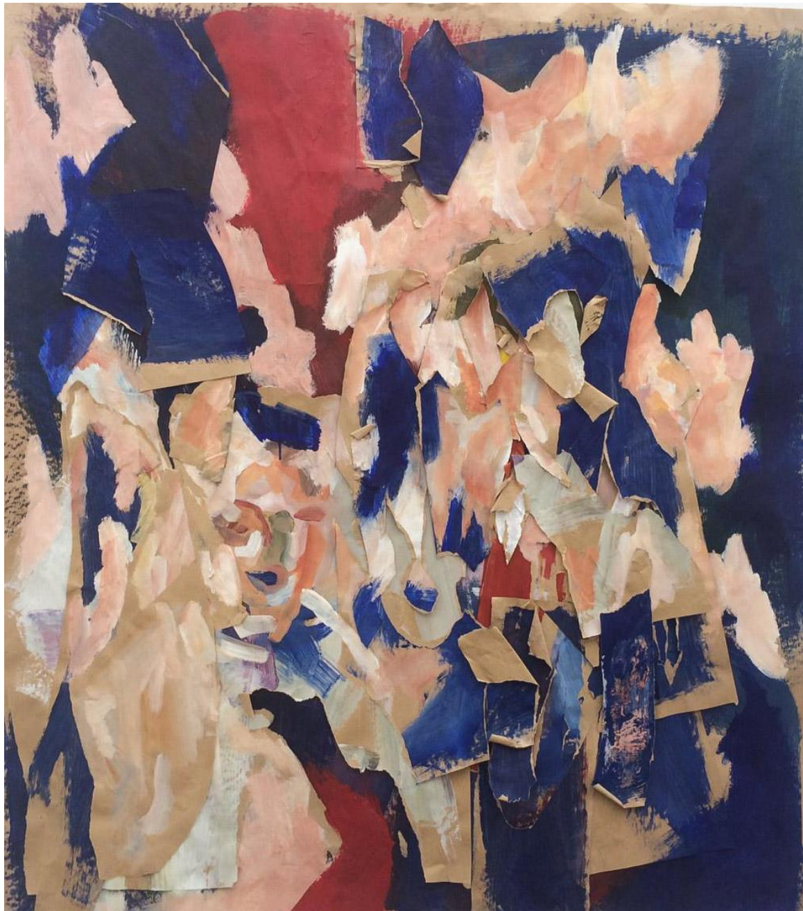
Bez naslova, 2019., akril na papiru

nedovršenosti i nepotpunosti. Taj dojam želim i sama postići u svojim radovima, te promatraču ostaviti mogućnost vlastitog sastavljanja konačnog prizora.