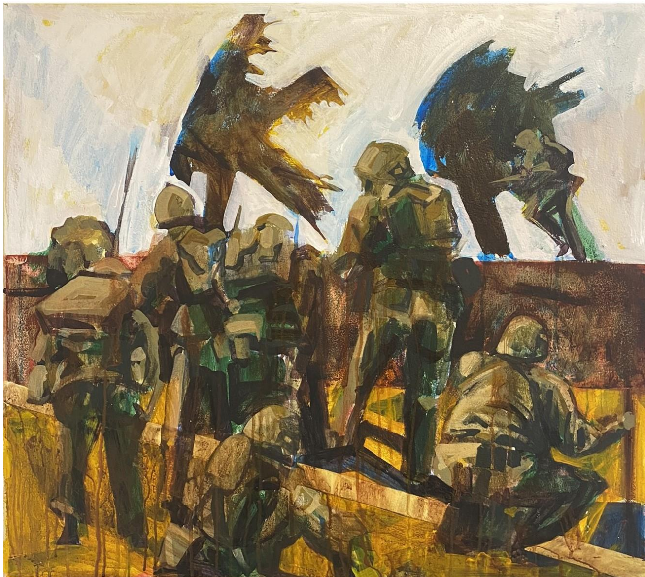
Slika 11. Bez Naziva 2023. 85x65cm, akril na drvenoj dasci