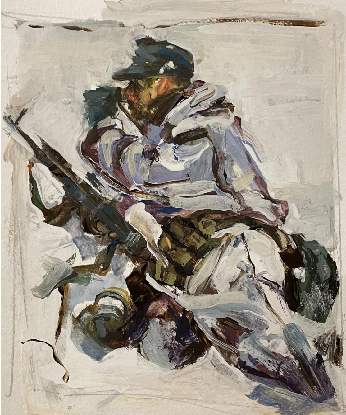
Slika 10. Bez Naziva 2023. 20x17cm, akril na papiru