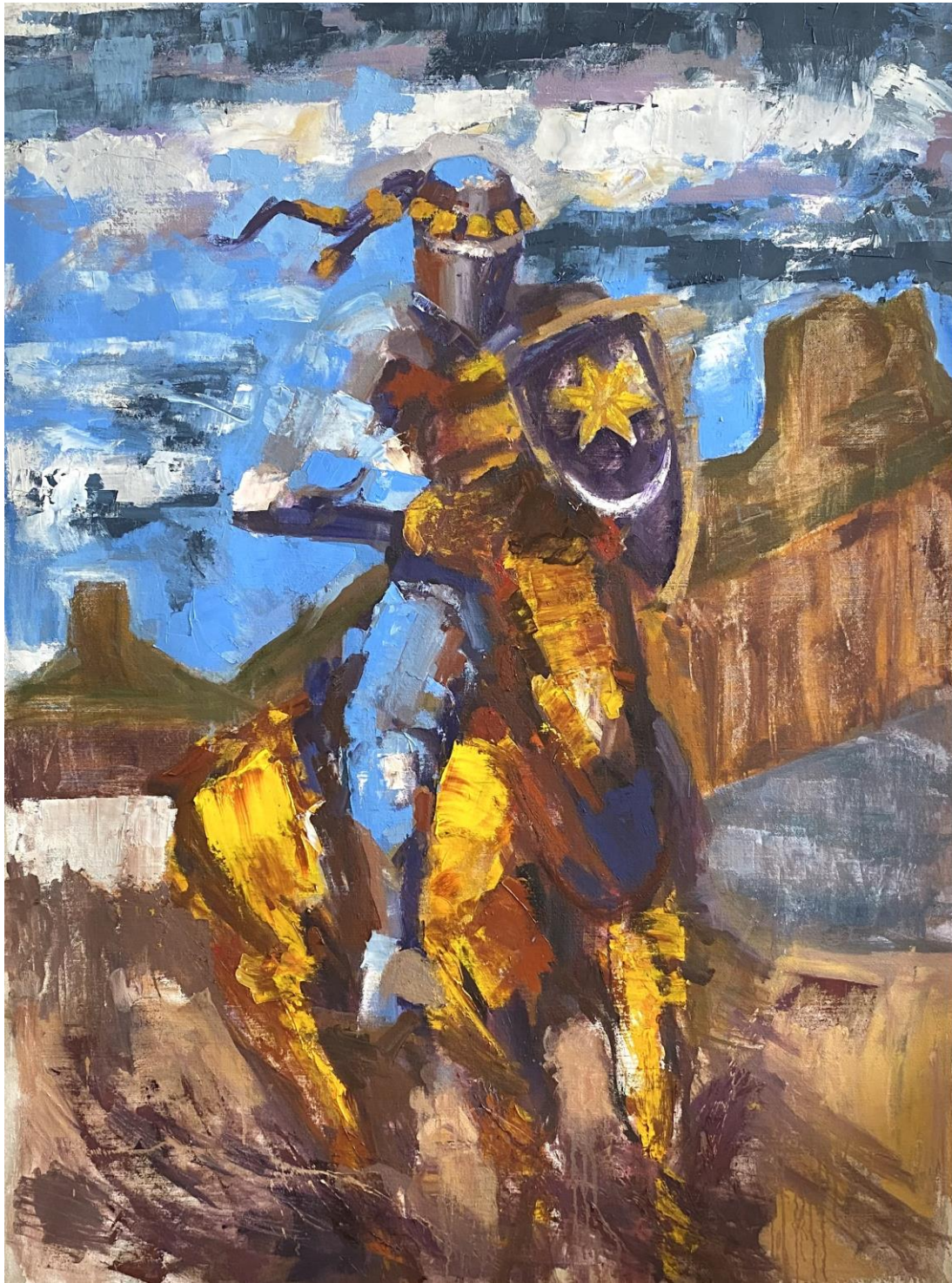
Slika 5. Bez Naziva 2022. 180x150cm, ulje na platnu