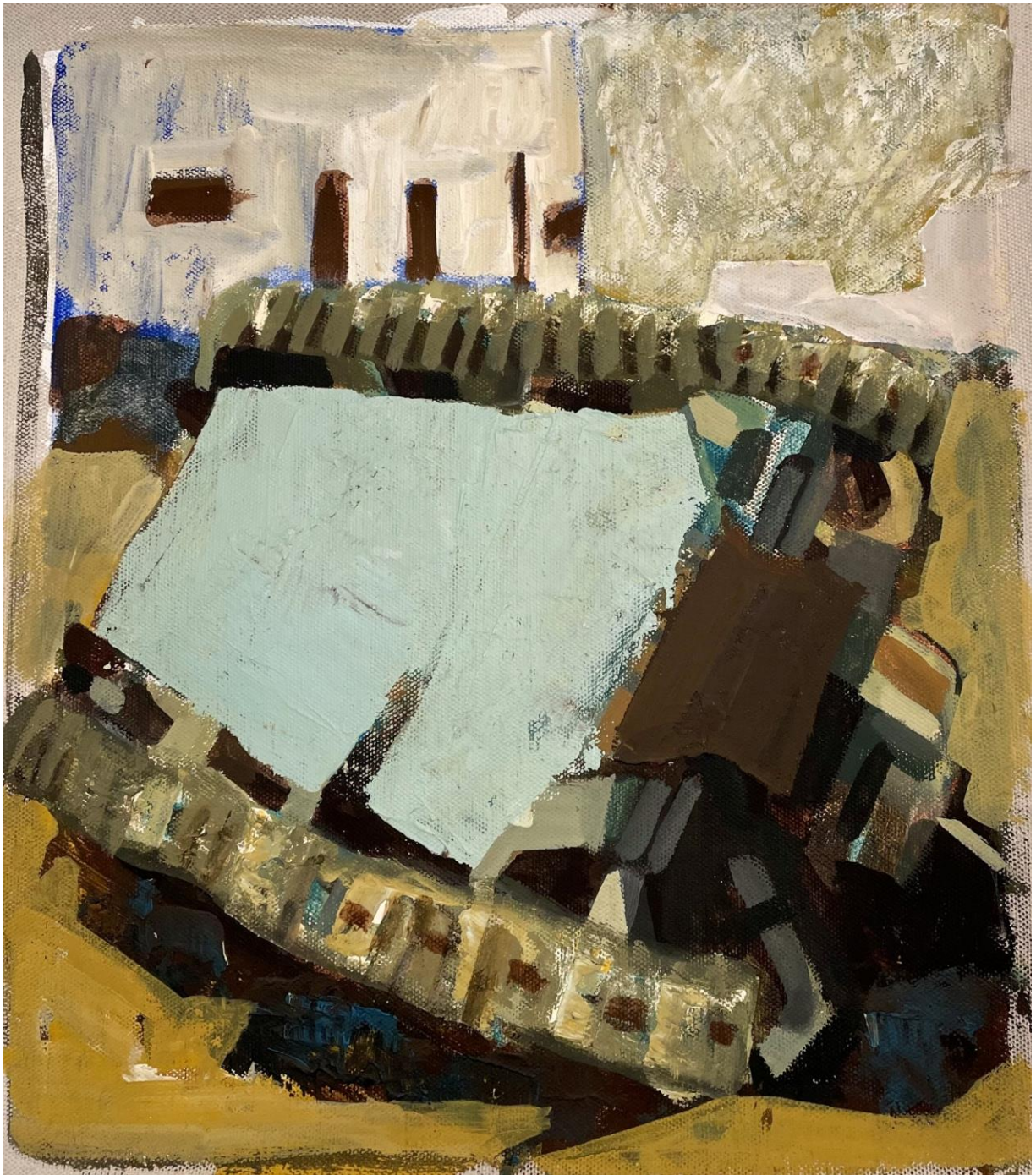
Slika 12. Bez Naziva 2023. 50x45cm, akril na platnu