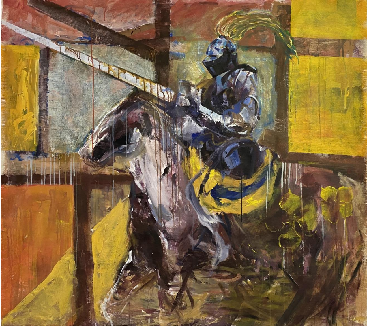
Slika 4. Bez Naziva 2022. 150x160cm, akril na platnu