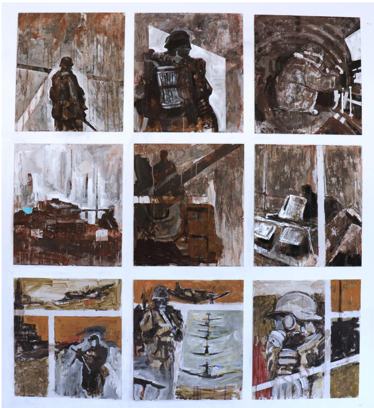
Slika 8. Bez Naziva 2023. 45x50cm pojedinačna, akril na drvenoj dasci