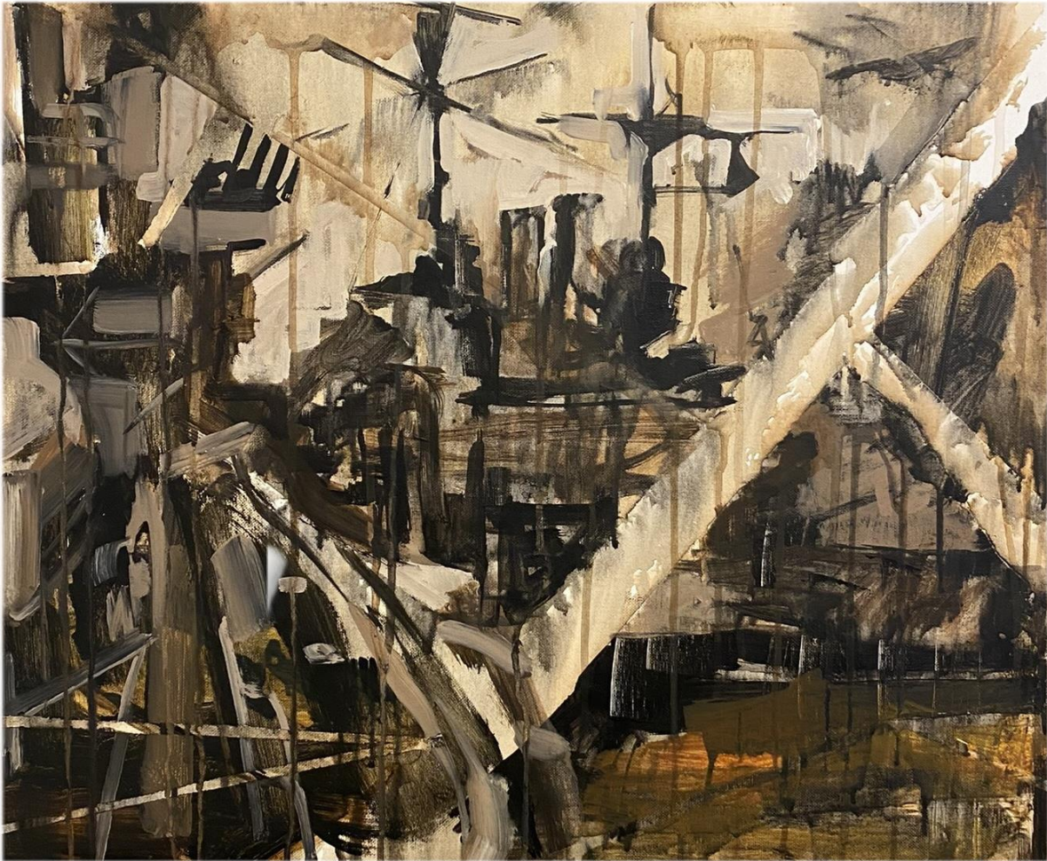
Slika 7. Bez Naziva 2023. 50x60cm, akril na platnu