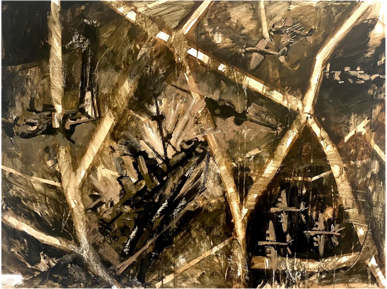
Slika 6. Bez Naziva 2023. 130x100cm, akril na platnu