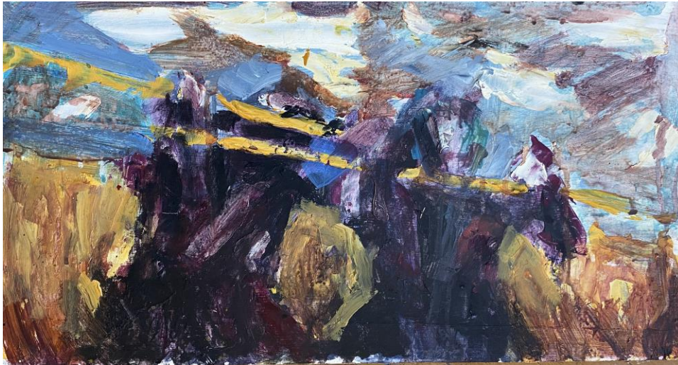
Slika 2. Bez Naziva 2022. 28x52cm, akril na drvenoj dasci