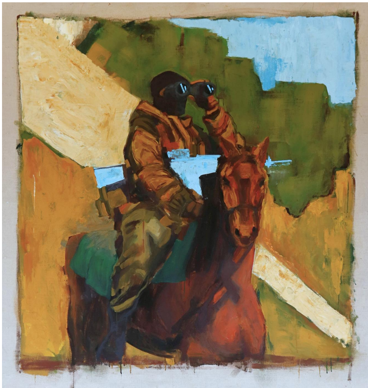
Slika 13. Bez Naziva 2023. 170x150cm, akril na platnu