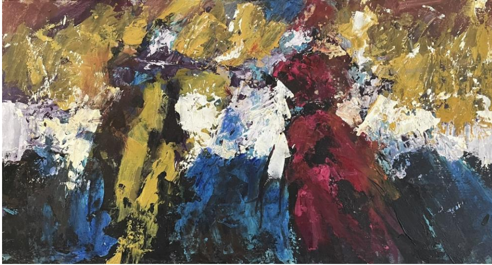
Slika 1. Bez Naziva 2022. 28x52cm, akril i kit za drvo na drvenoj dasci

dovoljno otvoreni da promatrač može u njima pronaći vlastito značenje, ispričati svoju priču o njima.