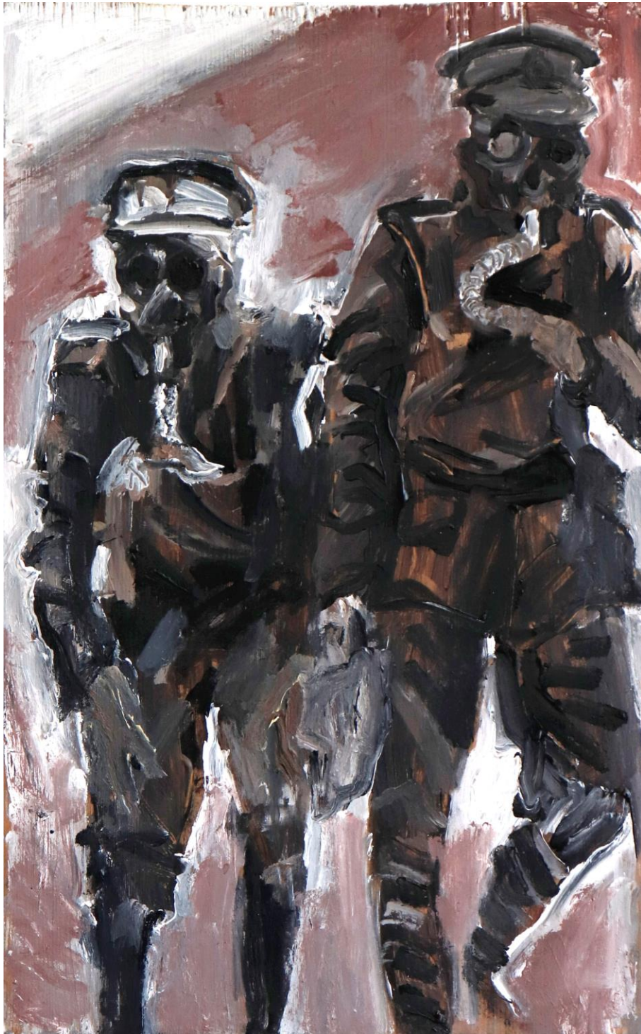
Slika 9. Bez Naziva 2023. 50x30cm, akril na drvenoj dasci