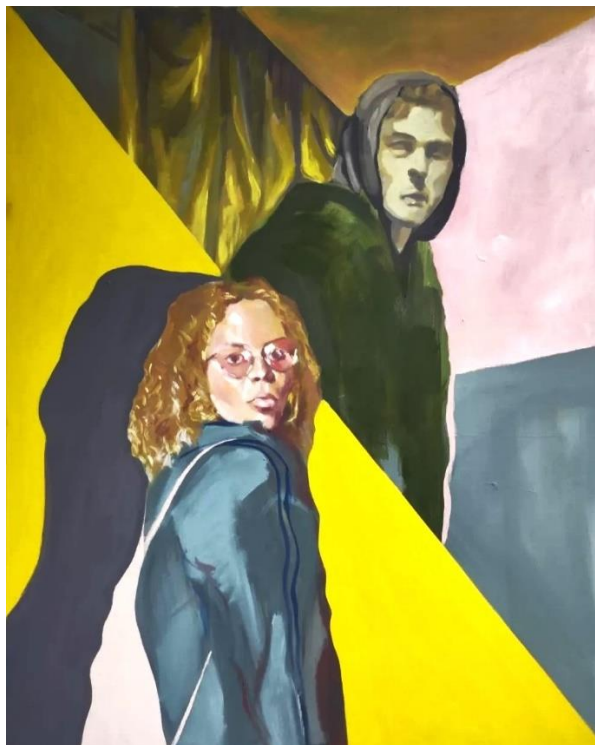
slika 1: „Dišpet“ iz serije „Pleši samnom“, 65x85cm ulje na platnu, 2022.