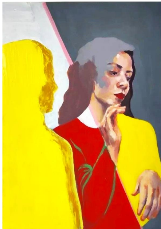
slika 2: „Pokret“ iz serije „Pleši samnom“, ulje na platnu, 2022.