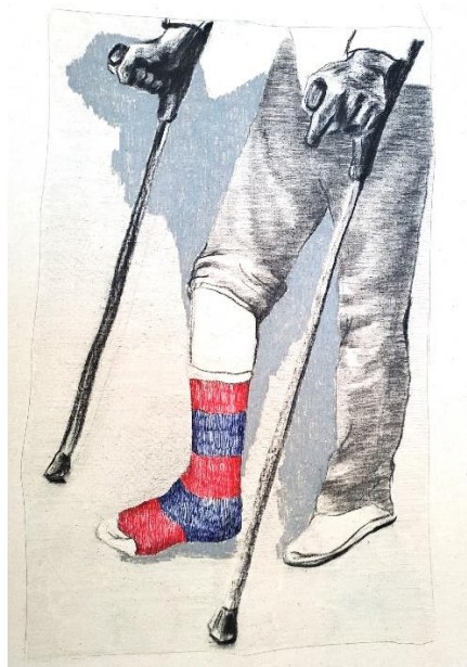
Slika 5: „U danima sretnim, u danima grubim“ iz serije „Kartoline“, 53x33cm, grafitna olovka, ugljen, rapidograf na platnu