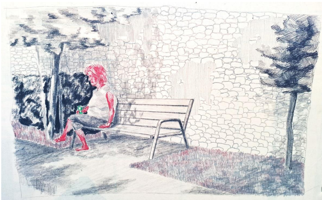
Slika 10: „Nediljka“ iz serije „Kartoline“, 53x33cm, grafitna olovka, ugljen i rapidograf na platnu