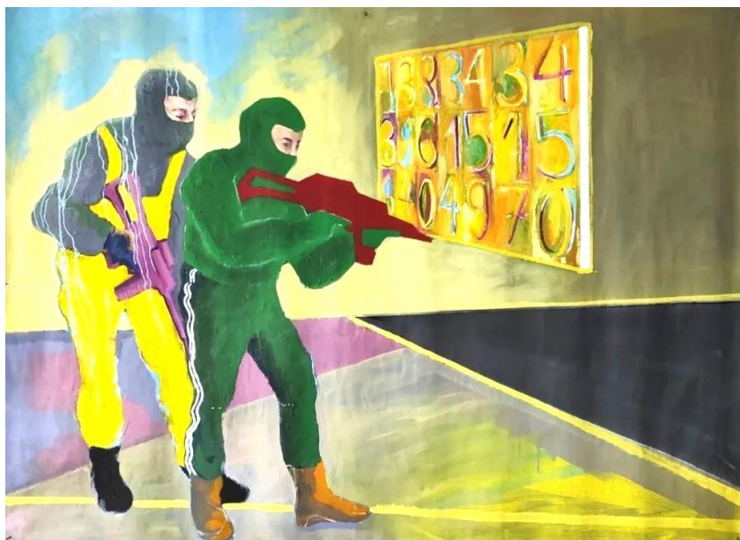
Slika 3: „Strah“ iz serije „Pleši samnom“ 125x85cm, 2022.