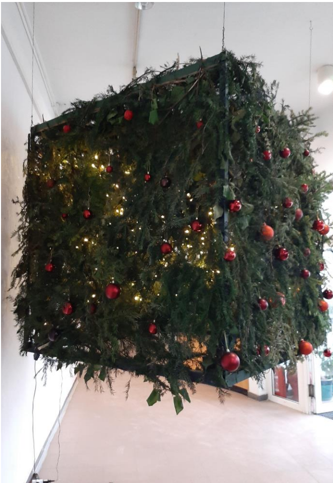
Unutarnja vanjština u predvorju zgrade Akademije na Jabukovcu, prosinac 2022.

Landart me sve više privlači i divim se mogućnostima koje nam priroda pruža, a pogotovo kada je i vrijeme uključeno u proces rada; godišnja doba, kiša, sunce... zamišljam samoodrživi ciklus postavljen na kocki, koji nema kraj.