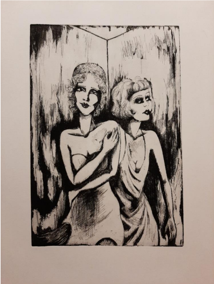
Lude dvadesete, 2023., bakropis, akvatinta, 35 x 50 cm