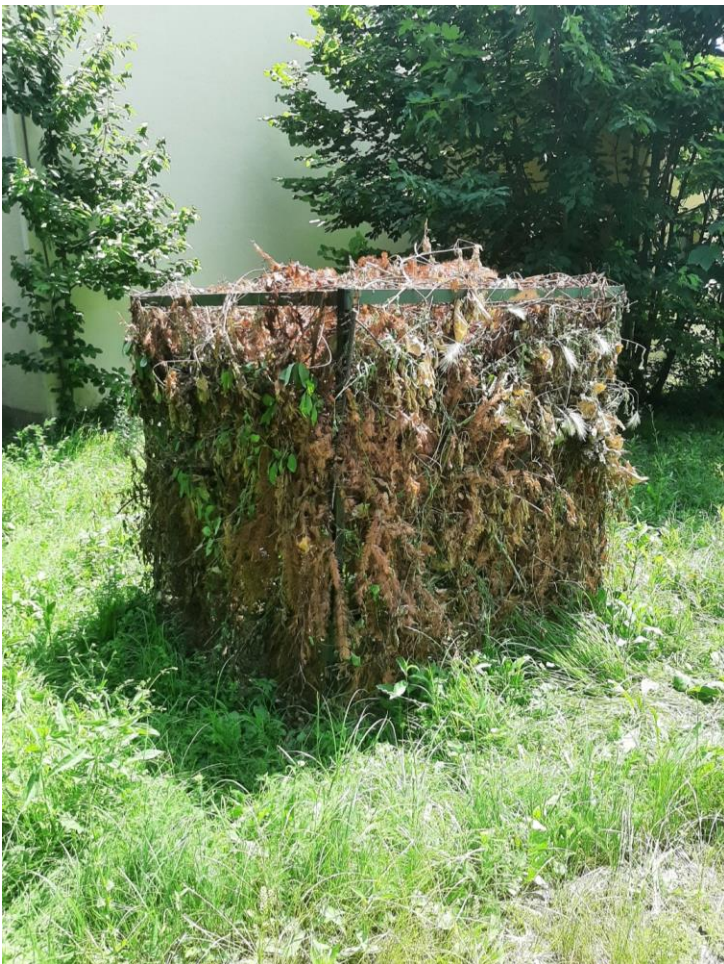
Unutarnja vanjšina ispred zgrade Akademije na Jabukovcu, lipanj 2023.