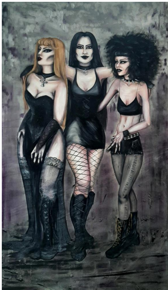
3 alter ega, 2023., ulje na platnu, 200 x 110 cm